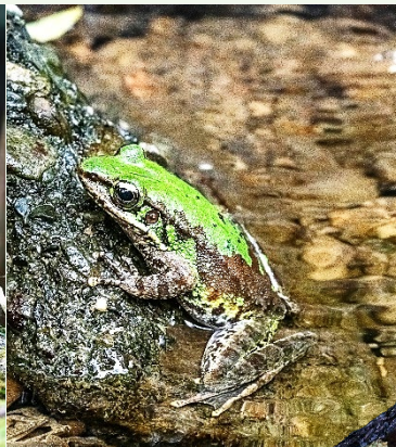
| 藍腹鵝 (Swinhoe's Pheasant)、斯文豪氏赤蛙 (右上) 斯文豪氏攀蜥