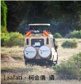
| safari · 柯金儀 攝

肯亞位於東非，瀕臨印度洋，面積約 58 萬平方公里 (約台灣的 16 倍大)。東非大裂谷將肯亞分為兩半，恰好與橫貫全國的赤道相交叉，特殊的地理環境，造就肯亞多元的地形與氣候。