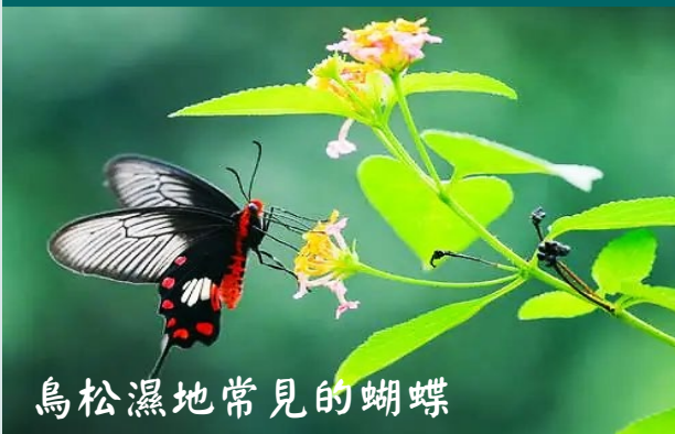
鳥松濕地常見的蝴蝶