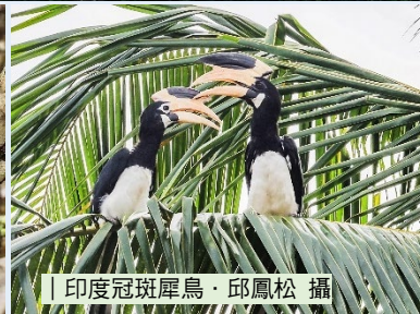
印度冠斑犀鳥