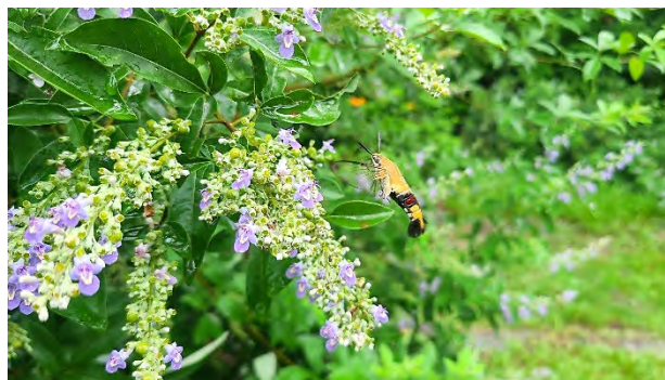
| 門口的三葉埔姜開花，吸引了透翅天蛾前來