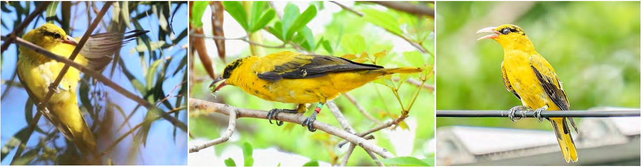
黃鸝繫放陸續傳來好消息～左圖一：市議會黃鸝大寶 8 月在衛武營現蹤；左圖二：去年繫放的 GR，4/03 出現在 5 公里外的宏南高爾夫球場；右圖一：黃鸝 YG，5/16 飛到 50 公里外的枋寮藝術村

鴉的棲息與繁殖環境。棲地營造的工作漫長且艱難，特別是碰到草鴉如此敏感的物種，也希望我們的努力是有效的，期待草鴉的降臨！