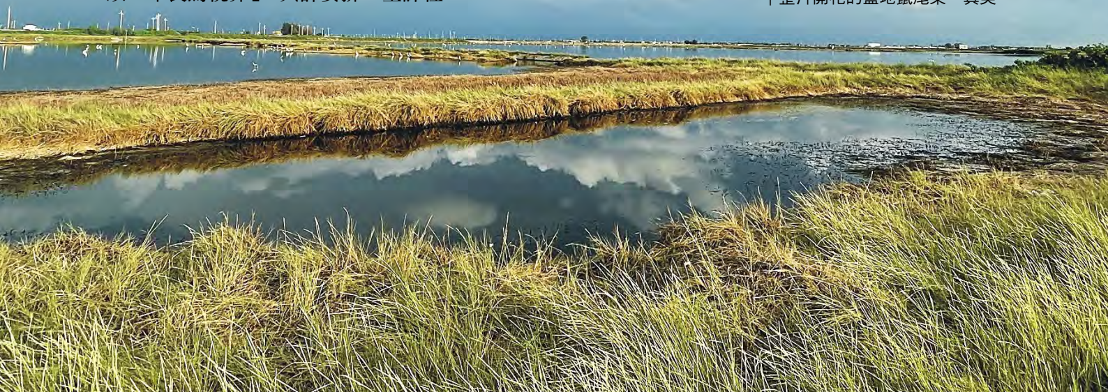
| 整片開花的鹽地鼠尾粟，真美