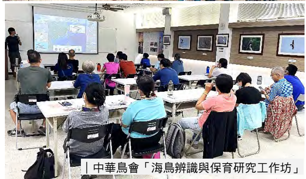
| 中華鳥會「海鳥辨識與保育研究工作坊」