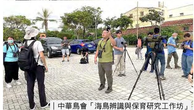
| 中華鳥會「海鳥辨識與保育研究工作坊」