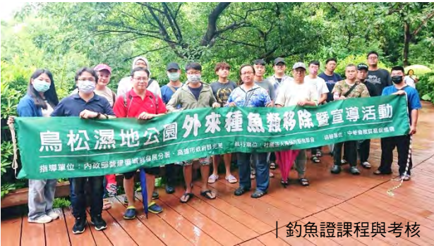
釣魚證課程與考核