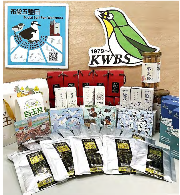
為線上募資準備的感恩回饋禮