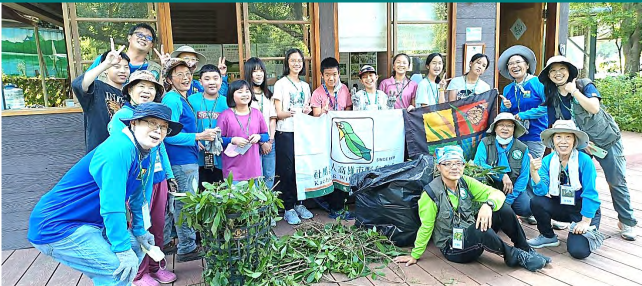
| 鳥松濕地青少年生態志工培訓圓滿成功，感謝所有協助支援的志工夥伴們

這兩個月來有幾次颱風侵襲及暴雨降臨濕地，雖為濕地補足了水分，但也造成附近地區因排水不及而有臨時淹水的情況。下雨的天氣意外地為昆蟲帶來舒適的環境，門口三葉埔姜在小雨後的黃昏，總是集結了許多昆蟲，甚至有如同蜂鳥般的長喙天蛾與透翅天蛾，這也點燃了昆蟲攝影師的熱情，即便淋雨也要來拍攝難得的美景。