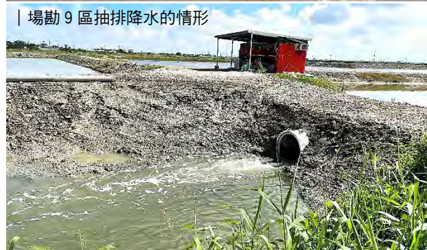
| 場勘 9 區抽排降水的情形