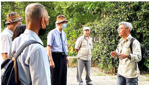
| 李遠哲博士蒞臨鳥松濕地參訪