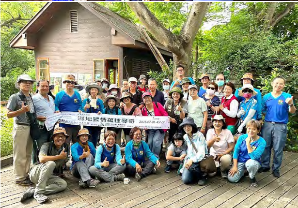
鳥松濕地藝術實驗基地 - 濕地豐情萬種尋奇展覽盛大開展