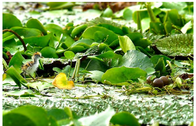
| 志工陳慧珠家的鰲池也傳來育雛成功的好消息

鳥，大種苗池有 4 隻亞成鳥與 1 隻雛鳥，周邊野蓮田則有 7 隻雛鳥，志工陳慧珠家族的停養鰲池則有 2 隻雛鳥。