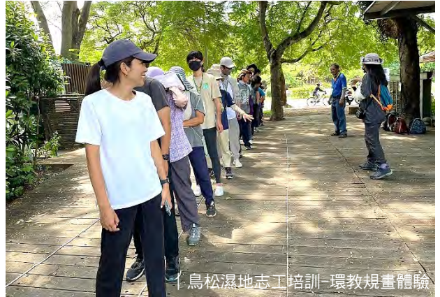
鳥松濕地志工培訓-環教規畫體驗

* 8/28 前中央研究院院長李遠哲博士蒞臨鳥松濕地參訪，感謝林昆海總幹事親自帶領李博士認識鳥松濕地。