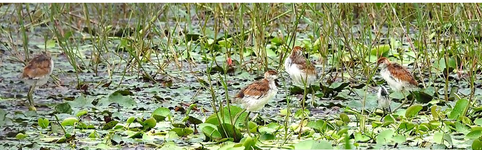
走散的雛鳥與四隻較大雛鳥相處融洽

田流浪而來的雛鳥，讓小小的種苗池更加擁擠熱鬧了，同時有雉久、4 隻中型水雉雛鳥與 1 隻孵化約兩週的雛鳥，新來的雛鳥與原本雉久一家相處融洽(圖二)。官田水雉生態教育園區過去亦曾觀察到水雉收養非親生雛鳥，對於未來減少雛鳥因親鳥被驚飛，或雛鳥因野蓮採收而與親鳥走散，導致雛鳥夭折風險極有幫助。