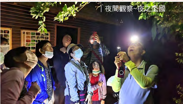
夜間觀察-夜之奎國