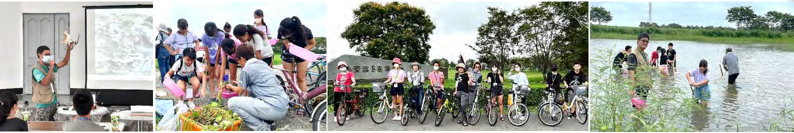
| 多樣一典~典寶溪青少年志工培訓，不僅認識水雉生態、下水種水生植物，還能騎單車賞鳥...，課程豐富又有趣！