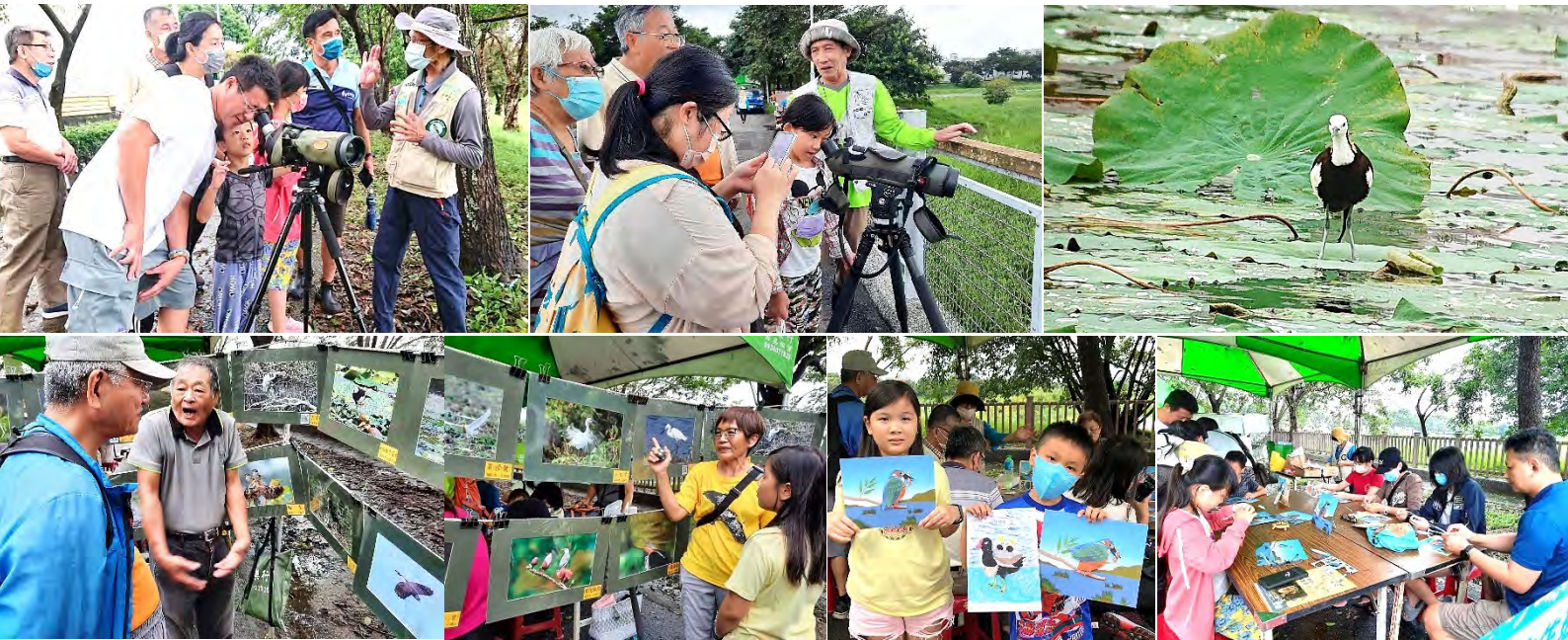
9/10 在典寶溪 A 區滯洪池辦理一場生態環境教育活動，感謝鳥友協助支援；水雉也來現蹤支持

括：生態之美攝影展、鳥類定點觀察解說、水鳥塗鴉彩繪 DIY、翠鳥紙雕 DIY 等，約吸引近 200 人參加，感謝生態季召集人蔡喬木老師，以及何克祺、李立方、李委靜、李慧文、周詩芸、林昆海、邱秀梅、邱南毅、柯金儀、翁秀麗、張嫚芬、陳軒彬、陳添彥、陳清樹、曾志成、蔣郁婷、簡美祺等志工的協助。