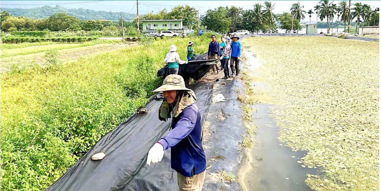
| 為了避免小水雉掉落排水溝，志工們以抑草蓆搭起金洲大橋