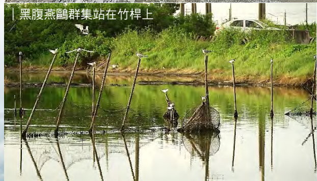
| 黑腹燕鷗群集站在竹桿上