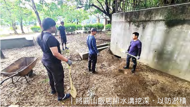
將圓山飯店排水溝挖深，以防淤積