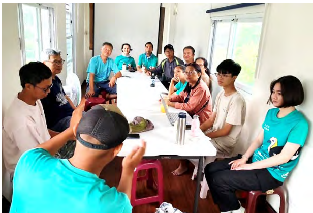
| 開會討論如何減少泰國鱧對雛鳥的威脅，並在志工協助下先清除部分水生植物，方便釣客拋竿，增加泰國鱧吃餌的頻率