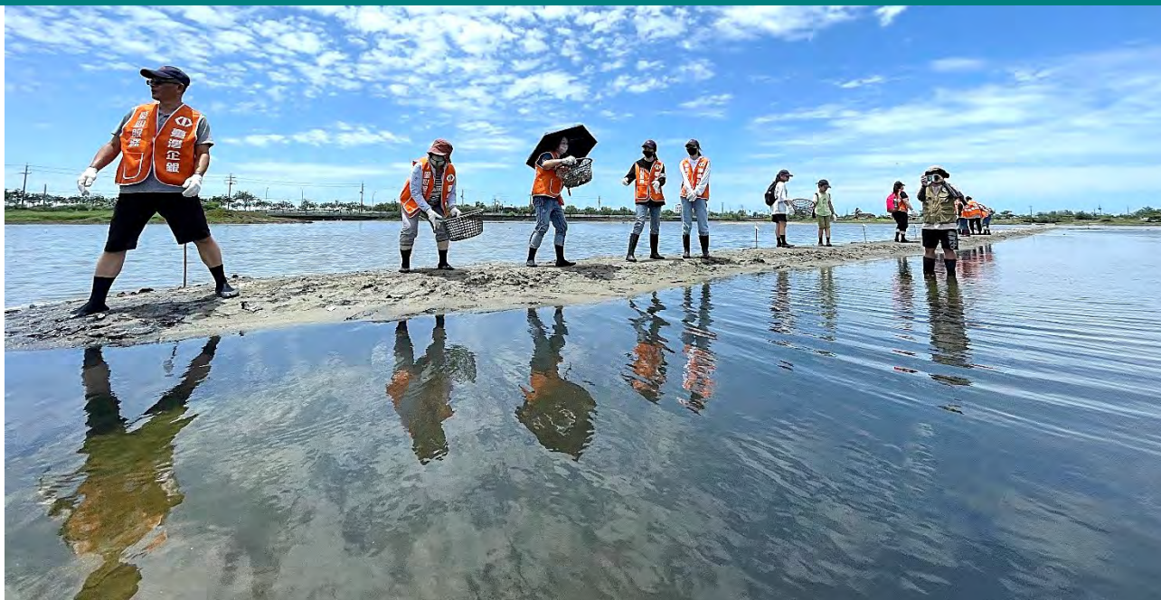
| 東方環頸鸕繁殖棲地改善工作假期，大家協力在長堤上，鋪設碎石混雜蚵殼當巢基以增加透氣排水

除了每星期例行的環境巡查工作外，今年我們從生物多樣性研究所(原特有生物研究保育中心)接手每個月的鳥類調查及水質採樣(共35個採樣點)工作，生多所今年還是會從旁協助我們熟悉各項調查及資料整理工作。