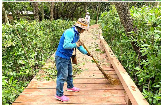
| 颱風造成園區不少枝條折斷(上圖)，所幸有志工的支援，在極短時間內恢復了步道的安全與舒適