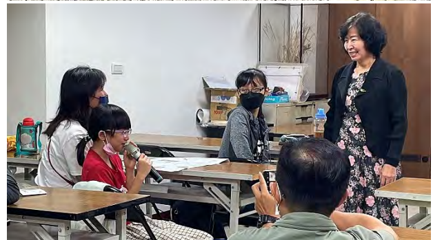
| 感謝前立委尹令瑛精采的演講分享