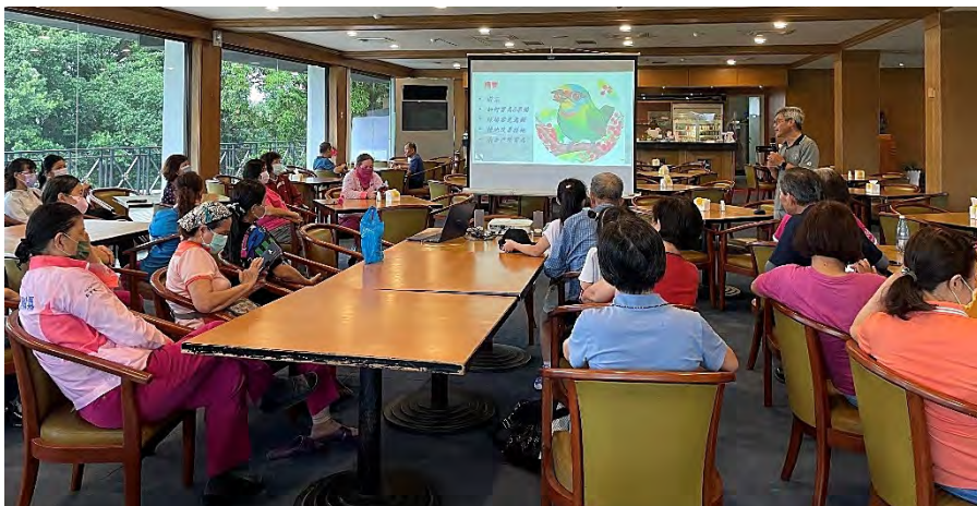
| 為高雄球場員工辦理 2 場基礎培訓課程，介紹場內常見的鳥類；而設置的棲架，也吸引大冠鷲、領角鴉前來棲息

近期連續大雨，草本植物生長異常迅速，當然路科草鴉棲地內的外來入侵植物：美洲含羞草更是猖獗，快速佔據了整個草地，連要動員志工們進去清除都非常困難！因此動員除草隊協助清理至地面後，再動員志工們協助挖除根部，希望能夠斬草除根，降低美洲含羞草、盒果藤的危害，為白茅草提供更好的生長空間，進而作為草