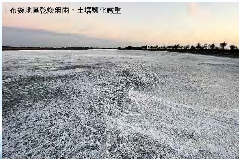
| 出水區域土壤開始鹽結晶，如大雪一片亮白