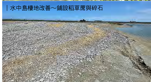
| 水中島棲地改善～鋪設稻草蓆與碎石