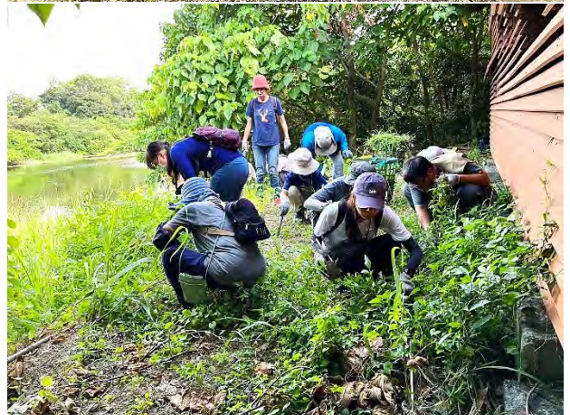
| 鳥松濕地志工培訓-新舊志工一起動手整理棲地環境