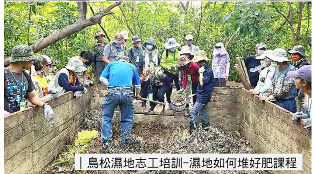
鳥松濕地志工培訓-濕地如何堆好肥課程