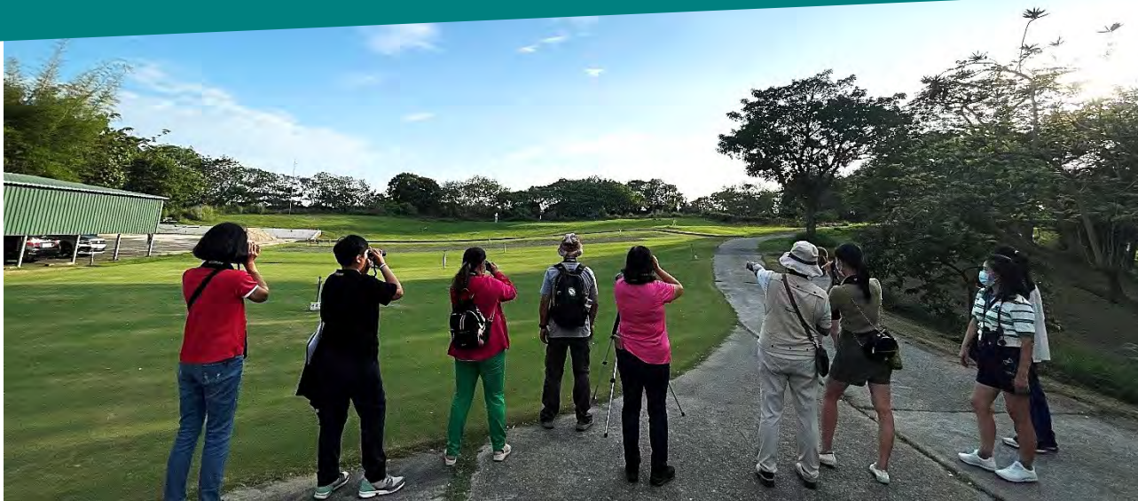
| 帶領高雄球場員工進行鳥類戶外觀察