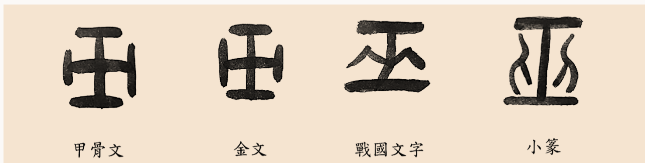
| 圖1、「巫」字自甲骨文至篆文的演變

另由甲骨文「巫」字的形義探究，有研究者認為：巫字甲骨文橫直從工，是事神所用的道具，此道具很可能就是河圖洛書，巫字甲骨文的字形