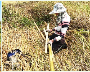
| 路科棲地認養營造與架設草鴉棲架