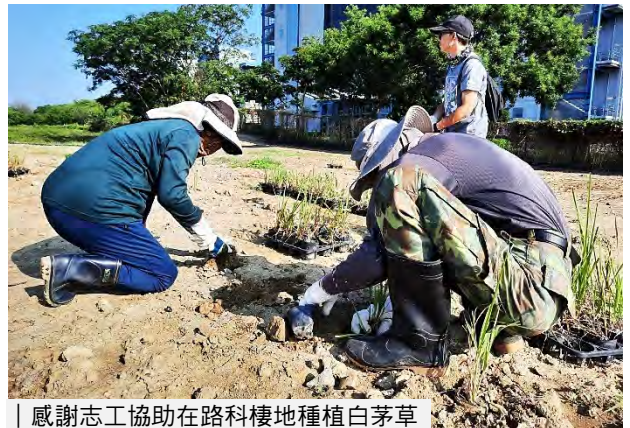
| 感謝志工協助在路科棲地種植白茅草