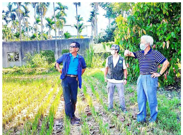
| 拜訪農友，以推廣友善農地給付「草鴉棲架監測獎勵金」