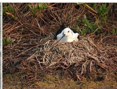
高蹺鷸坐巢孵蛋中