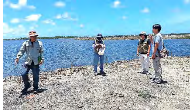
| 參加鳥會在美濃湖水雉棲地召開的會員大會