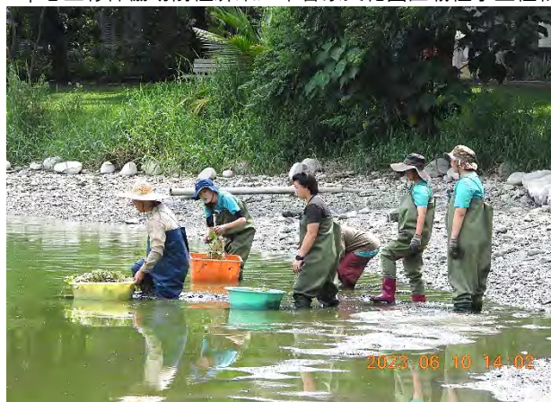
| 志工夥伴協助前往屏東六堆客家文化園區栽植水生植物

感謝客家委員會客家文化發展中心的邀請，讓美濃湖水雉棲地一同參與六堆客家文化園區邁向生態博物館的過程。