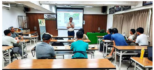
| 專職工作坊，將所有專職齊聚一堂，互相交流學習