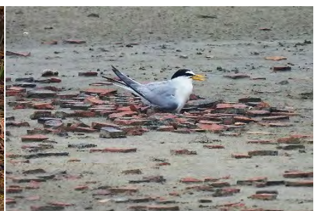
小燕鷗在十區瓦盤鹽田孵蛋