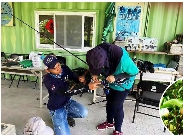
| 老師指導志工手釣與活餌放棍陷阱的訣竅