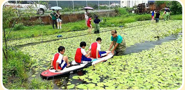
| 九曲國小走繩自然體驗團