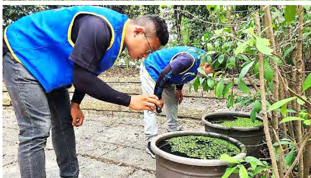
| 園區內帆布及可能積水處巡檢並清理