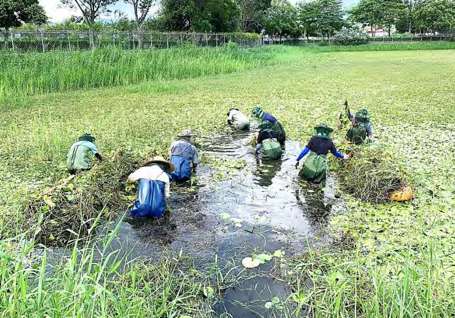
| 志工協助清空部分水草，以進行泰國鱧移除