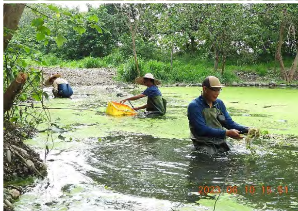
| 志工夥伴協助前往屏東六堆客家文化園區栽植水生植物