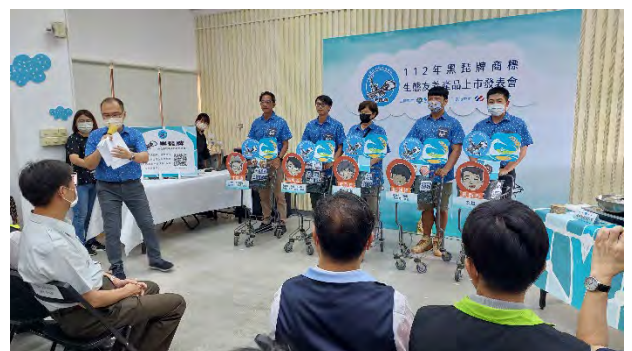
| 台江國家公園黑琵牌商標友善產品上市發表會