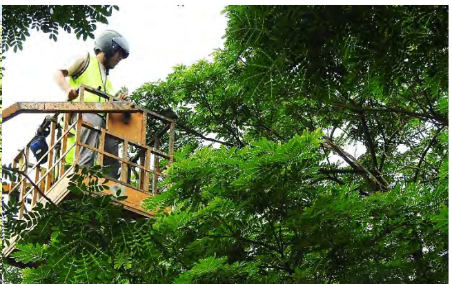
| 利用吊車進行黃鸝幼鳥繫放，共繫放了 13 隻幼鳥