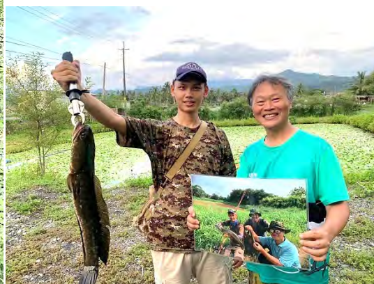
| 指導志工捕捉泰國鱧的熊先生曾替民間集資棲地移除過泰國鱧