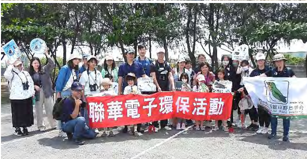
為彰化銀行與聯電員工分別辦理三場次的工作假期