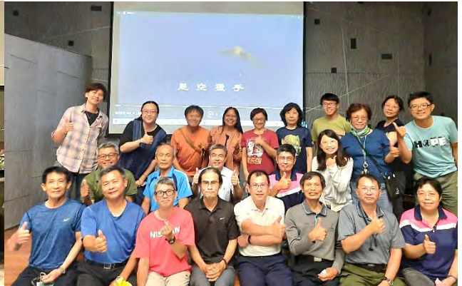
| 〈草鴉紀錄片〉內部試映會，邀請理監事、草鴉小組成員、專職先行欣賞，隨後針對影片內容及後續推廣進行討論