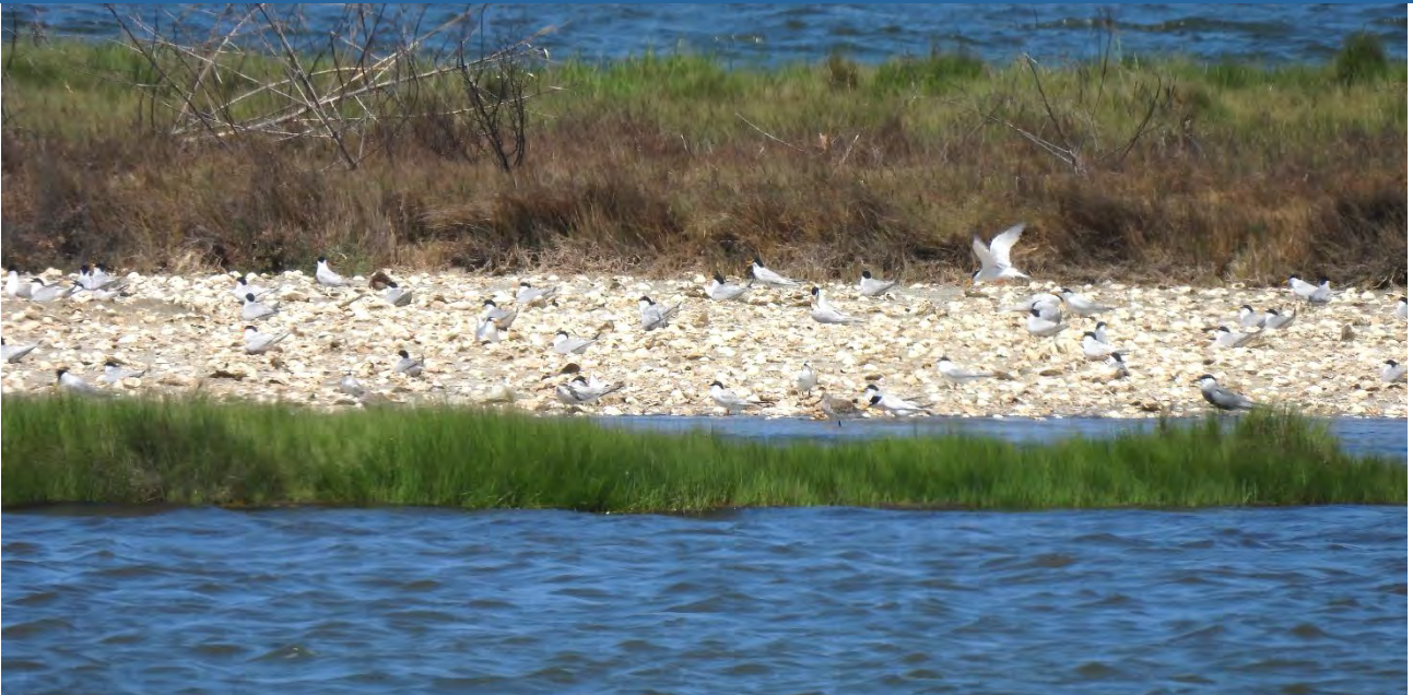
| 新塭滯洪池的水中島，有小燕鷗前來繁殖築巢