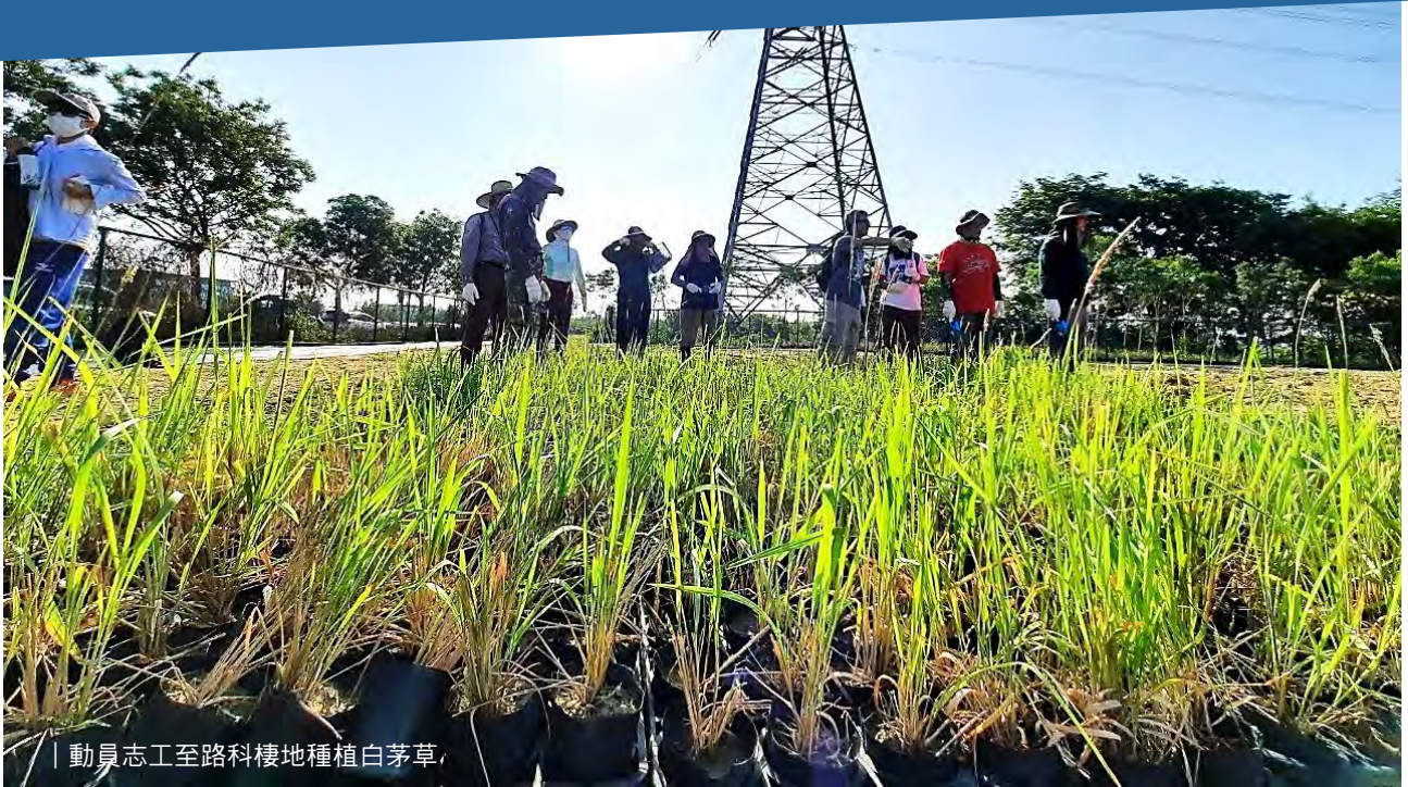
動員志工至路科棲地種植白茅草。