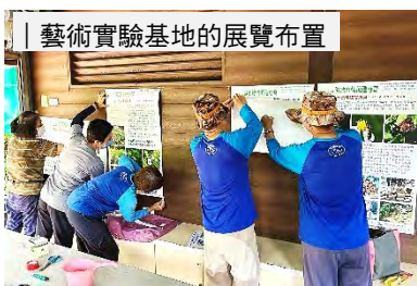
| 藝術實驗基地的展覽布置

* 5/18 召開「鳥松濕地藝術實驗基地」計畫之工作會議；6月時陸續將預計展覽之「濕地豐情萬種