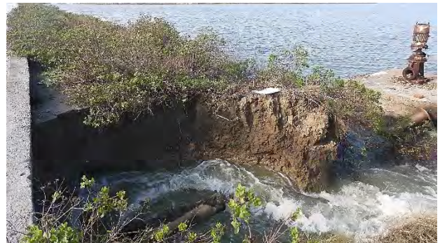
| 緊急搶修新塭沿岸支流堤防，以解除潰堤危機