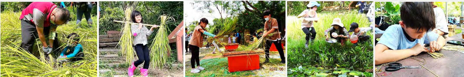
| 鳥松濕地「農事體驗：豐收～稻米收成活動」，在志工協助下，圓滿成功