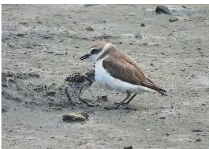
東方環頸鷸親鳥與幼鳥