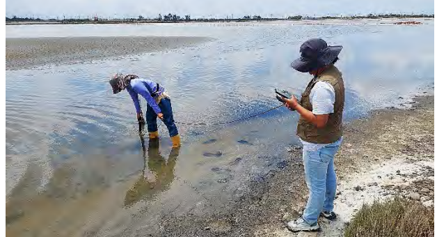
| 協助特生中心進行水質調查