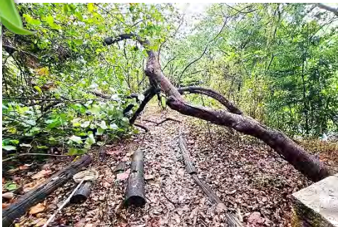
| 部分樹木因生長歪斜或蟲蝕而有倒塌現象