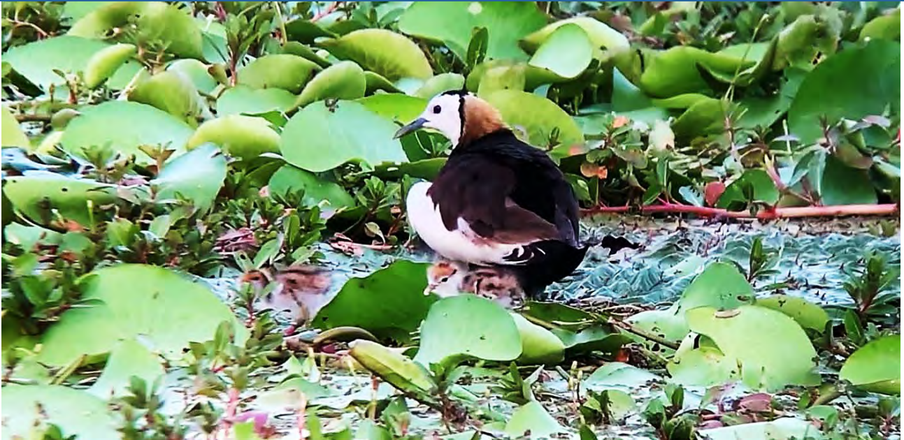
| 仰賴麥卡貝網路電視架設的全天直播系統，讓我們對水雉繁殖與棲地經營有更多仔細與全面的認識

仰賴美濃湖水雉棲地的志工辛勤追蹤繁殖進度，以及麥卡貝網路電視架設的全天直播系統，讓我們對水雉繁殖與棲地經營有更多仔細與全面的認識。