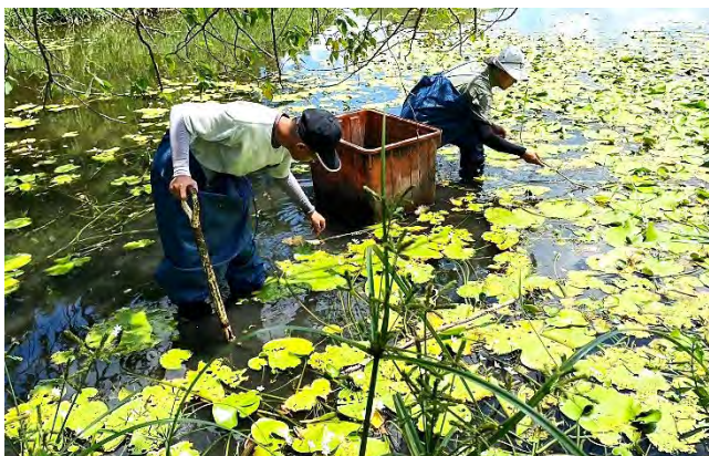
| 前往舊鐵橋濕地採撈印度荖菜種植於高雄球場水域