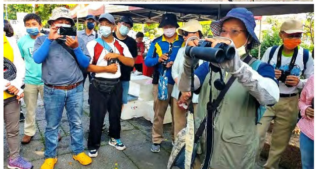
| 感謝鳥友協助支援每月一次的鳥類觀察解說