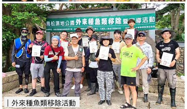
| 外來種魚類移除活動