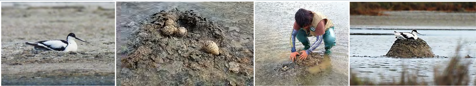
在 10 區首次記錄到反嘴鷸的巢蛋，但遇大雨而即將被淹沒，在團隊合力下將巢墊高後親鳥終於重新孵蛋，解決淹水危機

漁民蔡長億先生用石頭擋住閘門板留住縫隙，引水到他的魚塢。詢問後得知龍宮溪 6 號閘門中，有 4 個水閘門無法操作引水，因為維管單位拔掉水門齒輪，以杜絕釣客隨意打開閘門引水，這也是為何七區在今年會嚴重乾涸的一個原因。