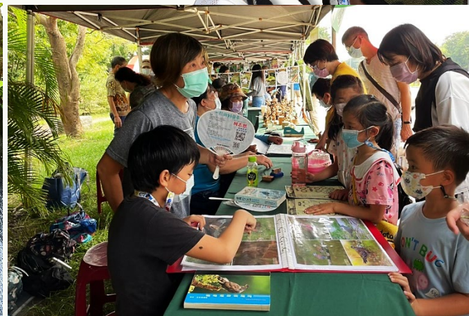
| 媽媽與妹妹都會陪著參加活動