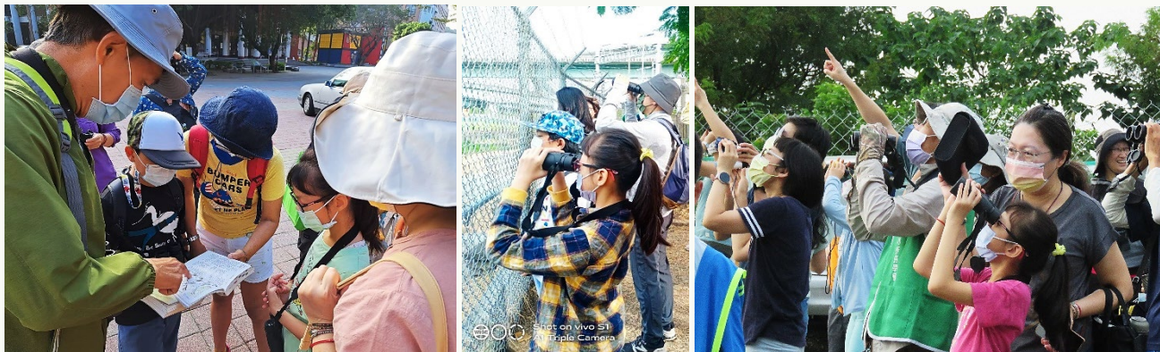
鳥會的老師每次都會詳細的說明每種鳥的特性 | 綾瑜除了參加 Bird City 賞鳥，也會到禮納里欣賞猛禽過境的盛況