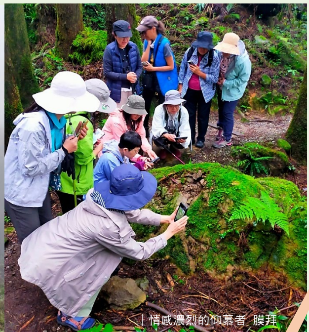
情感濃烈的仰慕者 膜拜