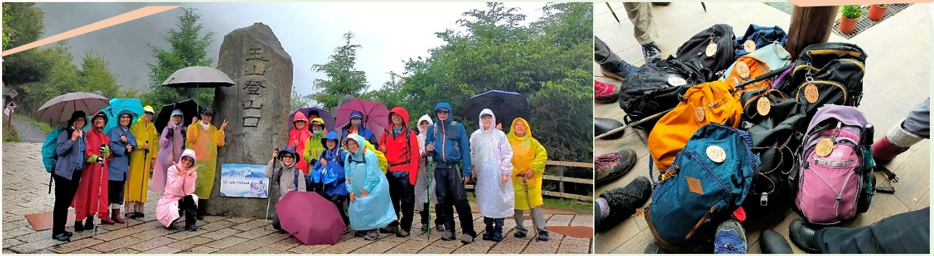
| 塔塔加的山徑帶我去看山看樹看花看草，看不盡大自然的變化萬千