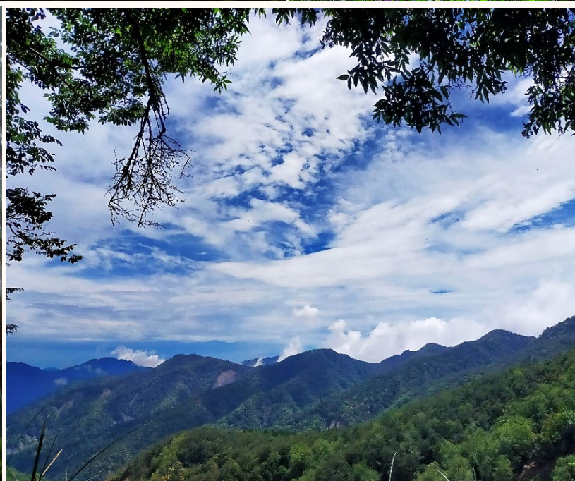
| 近山是愉快的藍與白雲輝映