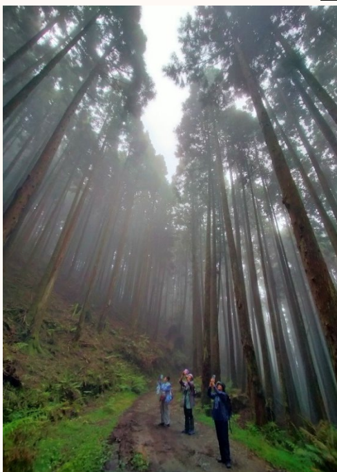
| 柳杉以雲霧為布幕，各自展現挺拔