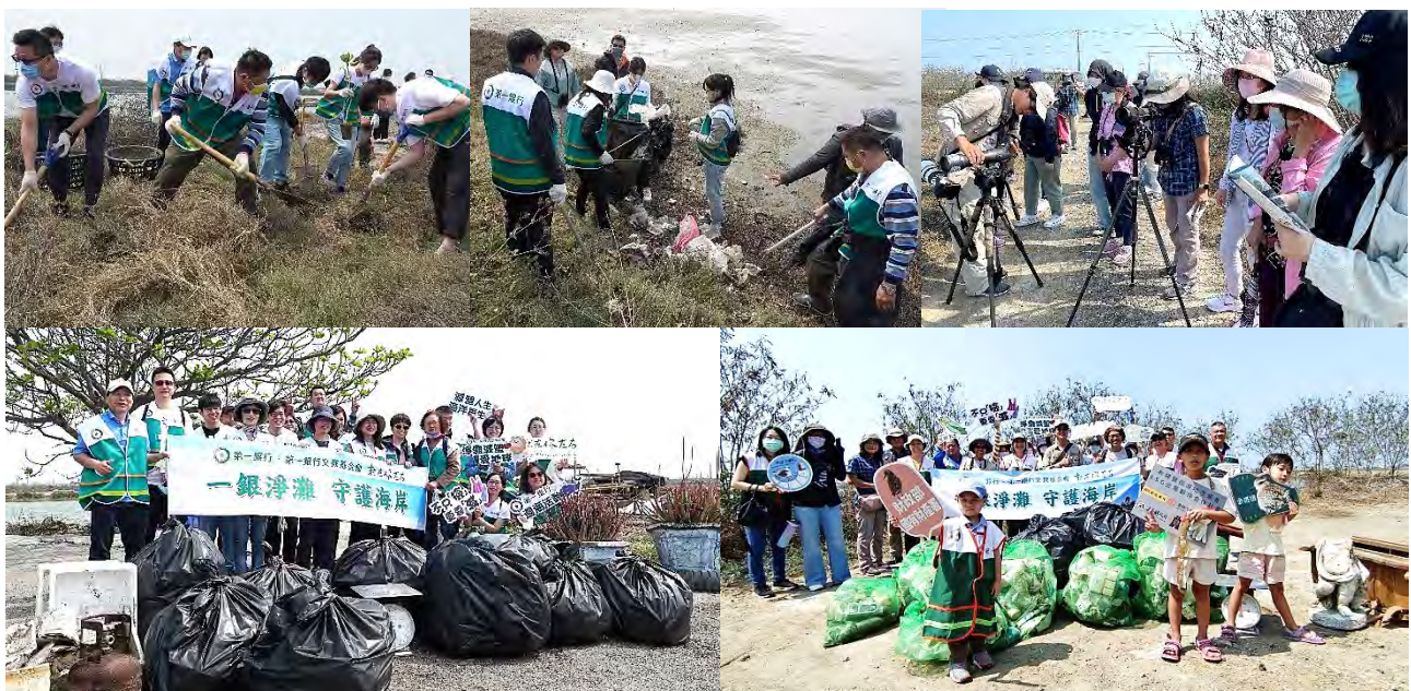
為第一銀行安排兩場的工作假期，除了賞鳥、淨灘外，也種下樹苗，以行動守護我們的環境

穿過3D彩繪村來到10區鹽田，順著曬鹽時期的鐵道，兩側堆地往下順鹽的瓦盤結晶池，是早期鹽工將一塊塊甕瓦碎片拼貼出的馬賽克紋理地景，鳥類起而代之的繁殖棲地，東方環頸鴿的巢蛋完全融入甕瓦碎片；在專員的帶領下找到