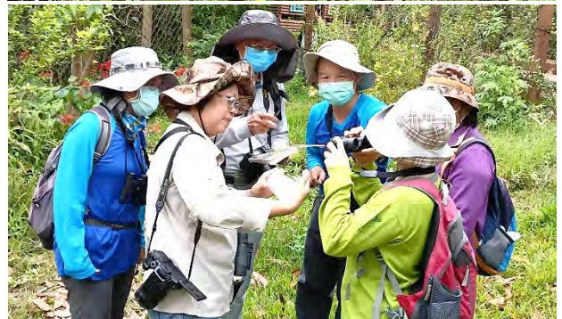
蝴蝶、蜻蜓生態調查