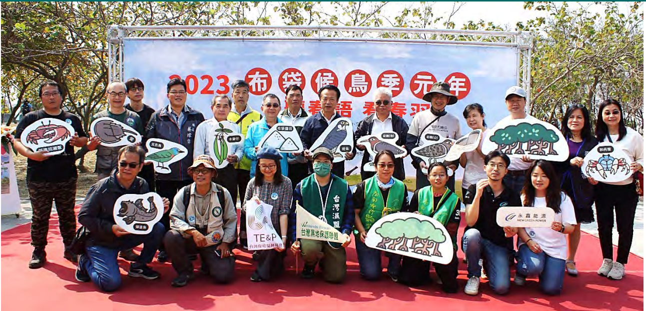
| 2023 布袋候鳥季元年啟動