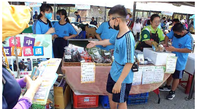
| 布袋國中學生熱情的動員參與