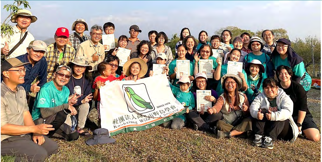
| 第二期志工結業授證並與第三期志工互相交流、學習