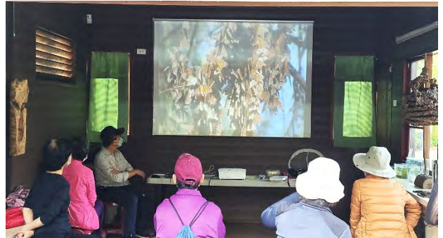
召開「鳥松濕地藝術實驗基地」計畫之工作會議