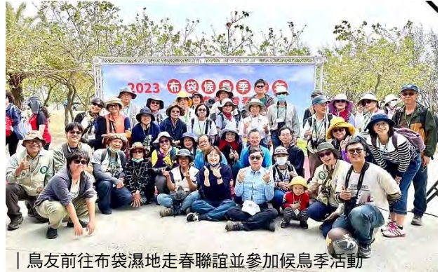
| 鳥友前往布袋濕地走春聯誼並參加候鳥季活動