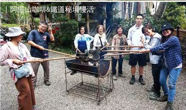
| 阿里山咖啡&鐵道秘境慢活