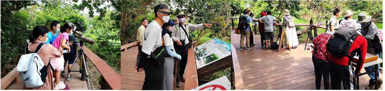
每個週日辦理的定點解說活動，感謝鳥會解說團隊專業的解說分享