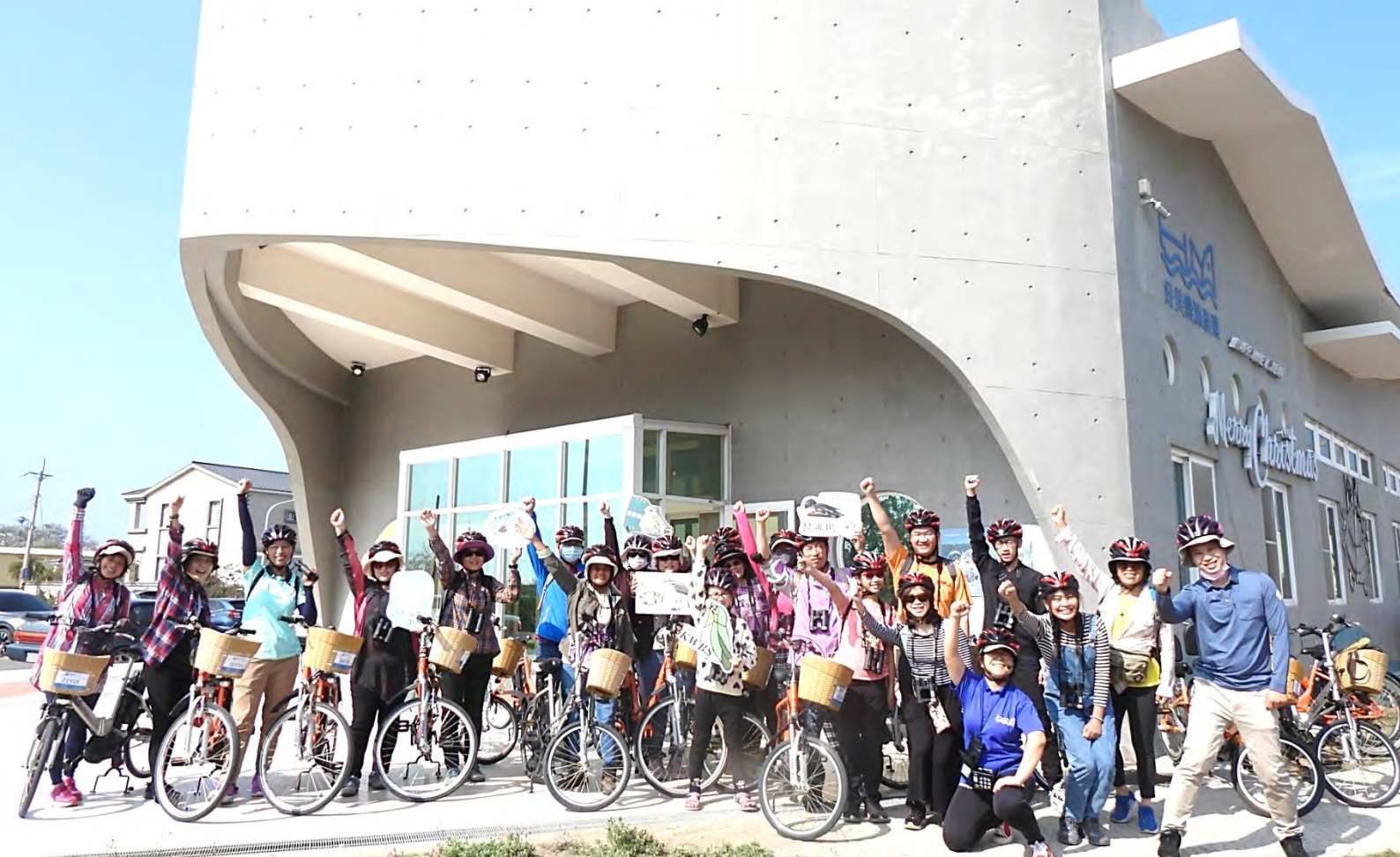
| 好美低碳慢遊小旅行，啟動！

一巢蛋，參加者保持距離的拍下照片、離開，導覽員介紹東方環頸鴿繁殖與鹽田濕地的管理。