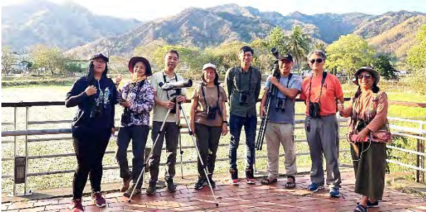
金線蛙生存環境探討

我們爭取到高雄市政府文化局的「112 年度社區產品品牌再造設計」，期待能以「美濃野蓮觀雉」再讓水雉替野蓮與美濃加分；並參與教育部「暑期社區職場工讀」，以提供生態觀察員與短片指導各一的短期工作名額；另以「凌波仙子巢材基地－荒廢鰲池變水草樂園」，申請「信義房屋社區一家」的全民社造計畫。