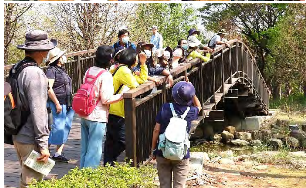
| Bird City-來去凹子底公園賞鳥活動