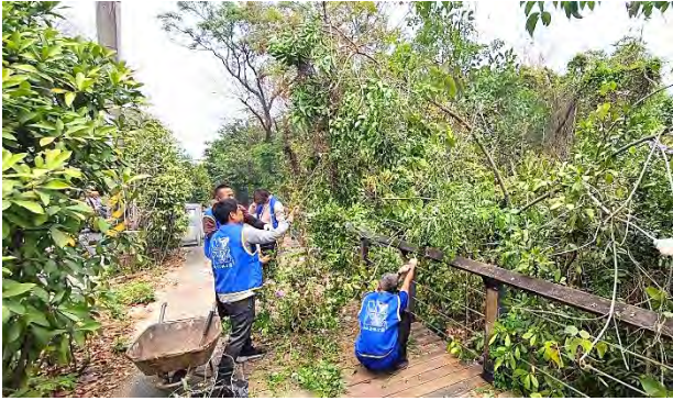
| 志工夥伴整理園區植栽