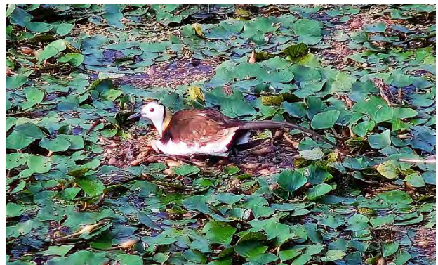
| 種苗池孵蛋的水雉公鳥

在志工的呵護下，大種苗池的菱苗已覆蓋九成水面，其他水面則為印度荇菜與滿江紅，西側池畔栽植筴白筍與樹豆，希望能降低民衆在近距離觀察水草與水生昆蟲時，對水雉繁育帶來過多影響。而小種苗池以印度荇菜、過長沙、大安水