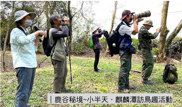
| 鹿谷秘境~小半天·麒麟潭訪鳥趣活動