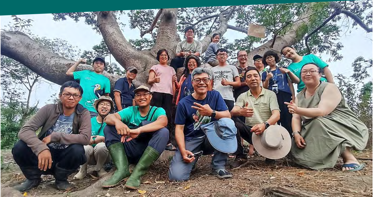
| 4/22 地球日，集結了各棲地共計 21 位志工夥伴參與舊鐵橋濕地水生植物移植行動，為舊鐵橋水雉棲地復育寫下歷史新頁