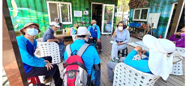
探索濕地藝術的實驗課程