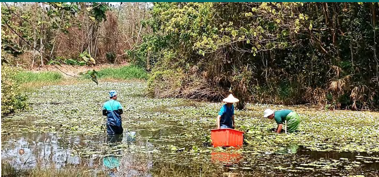
| 再次前往舊鐵橋濕採集印度荖菜

雖然還沒正式進入夏天，氣溫卻持續飆升，最大的問題，還是持續乾旱無雨。園區沉砂池還曾一度乾涸到連鸕鶿科的小型鳥類也來沉砂池享受著意外的自助餐。