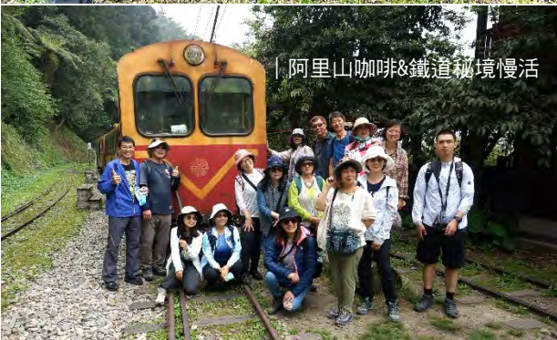
| 阿里山咖啡&鐵道秘境慢活