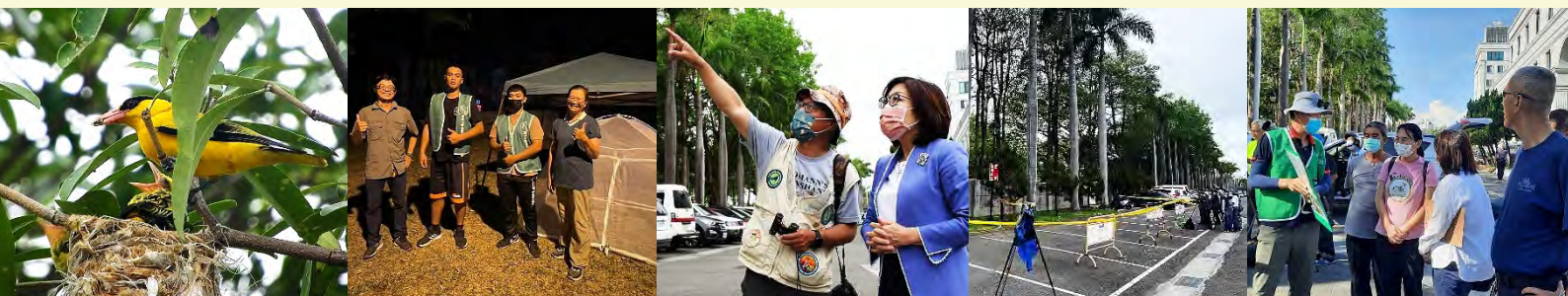
市議會黃鸝守護行動啟動，除了 24 小時的排班守護，也設置警戒線隔離並向民眾宣導解說，感謝康議長不時到場關切