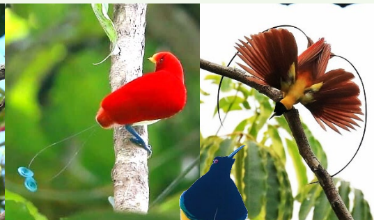
| 十二線天堂鳥