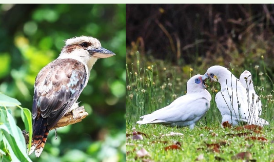
| 笑翠鳥、短嘴鳳頭鸚鵡、棕頭扇尾鵝