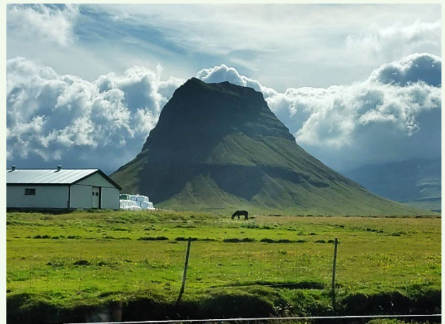
| 冰與火的國度～冰島

冰島，是除了紐西蘭外，人類最後定居的島嶼，維京人在 1,000 多年前發現並定居於此，冰島人就是維京人的後代。冰島位於中洋脊上橫跨歐亞及美洲大陸，土地面積約為台灣的三倍大，有兩處終年不化的冰河及無數的火山與間歇泉，美麗的景觀及雄偉的地貌處處可見。雖位於高緯度極圈邊緣，但因有大西洋暖流經過，經年溫度不至於過低，約在 0 度上下，跟其他同緯度地區比起