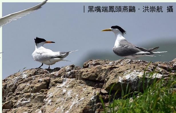
| 黑嘴端鳳頭燕鷗