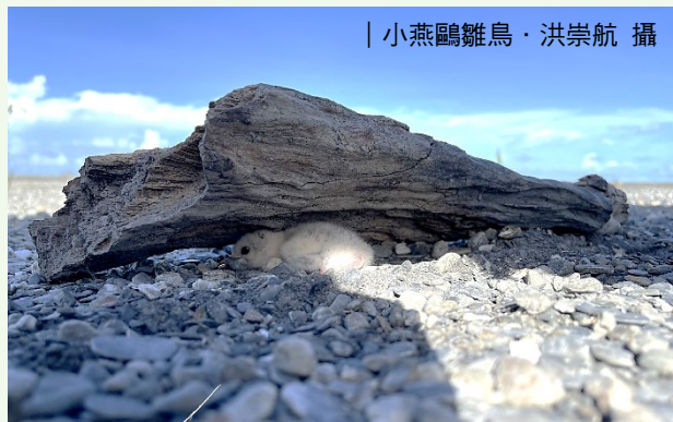
| 小燕鷗雛鳥