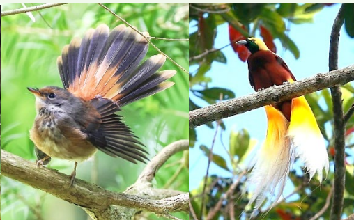
| 小天堂鳥、王風天堂鳥