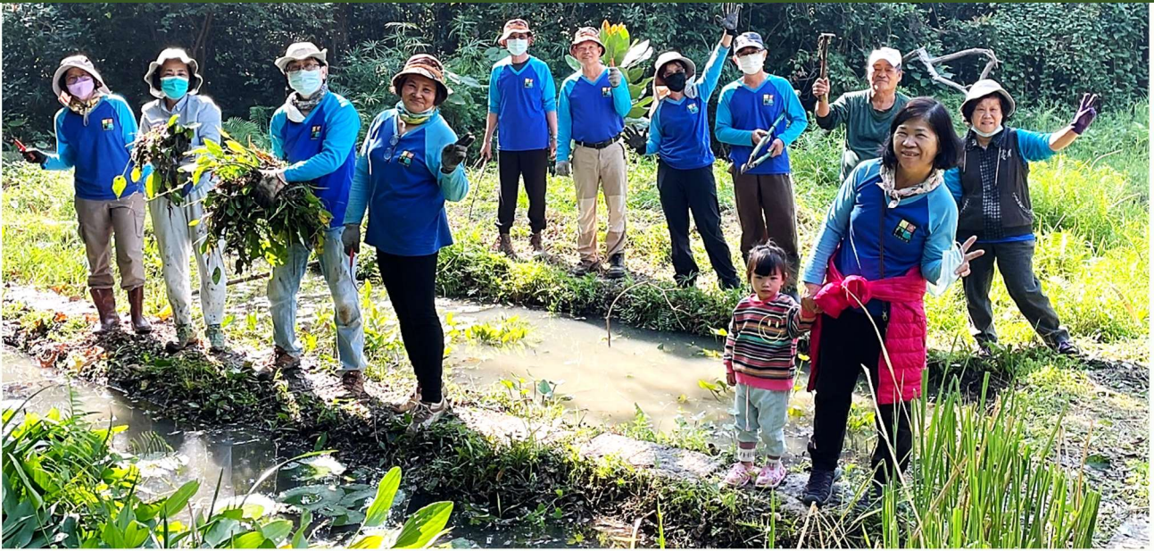
| 志工棲地服務，協助整理澤瀉

入冬以來氣溫偏低且水分較少，特別是早晚較為寒冷，園區內植物也因此生長緩慢，但為了讓各位來濕地時能有更好的體驗，這兩個月持續整理了教學池、小池池畔、大池水中島、溪流區以及烏柏步道等區域。