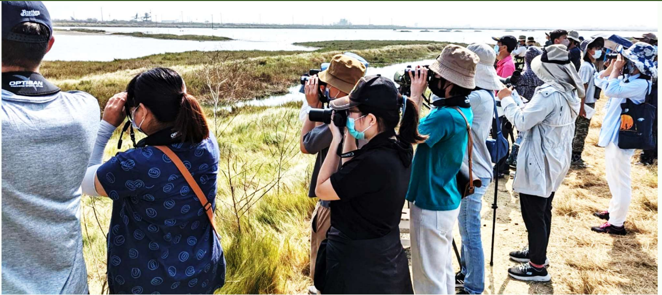
| 定期於濕地公園舉辦的鳥類觀察推廣活動，豐富的鳥況加上親切的解說，已建立了好口碑