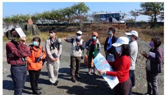
國產署進行認養布袋鹽田績效評審實地訪視