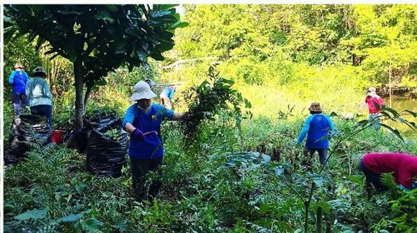
| 志工棲地服務，協助整理澤瀉、聖誕花圈的材料-藤蔓及移除生長過剩之植株與雜草