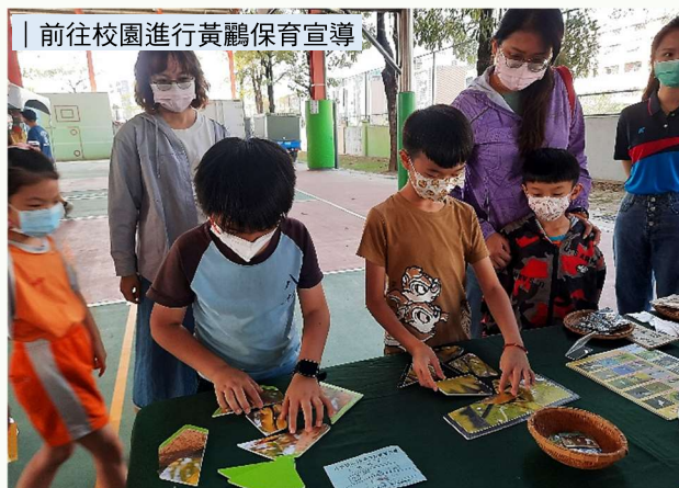
| 前往校園進行黃鸞保育宣導