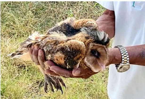
農民因野火事件撿到草鴉幼鳥，進而願意減少滅鼠藥的使用

感謝林務局屏東林區管理處的支持，2022 年的工作重點集中在友善農業的推廣和輔導。我們在鳳山水庫附近發現草鴉的蹤跡並訪視鳳梨田農民，原本農民對於減少滅鼠藥的使用有所排斥，但是因為一起野火事件讓這位農民撿到了草鴉幼鳥。當他親眼所見草鴉幼鳥是如此的漂亮、特殊之後，也改變了他想要保護草鴉的念頭，願意減少滅鼠藥的使用！瀕危物種的保育除了棲息環境的保護外，他們與利益相關的民衆之間能否發展出和諧、共生的方式，決定了物種的命運。我們相信這樣的案例會越來越多，草鴉的保育也充滿希望！