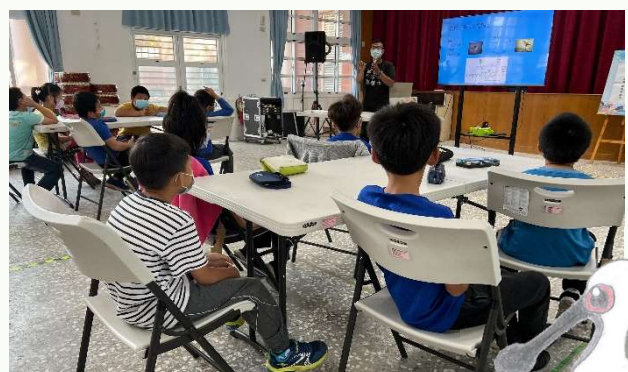
| 前進校園，安排「鹽田濕地生態與鳥類觀察」課程，小朋友課堂上手繪的黑面琵鷺