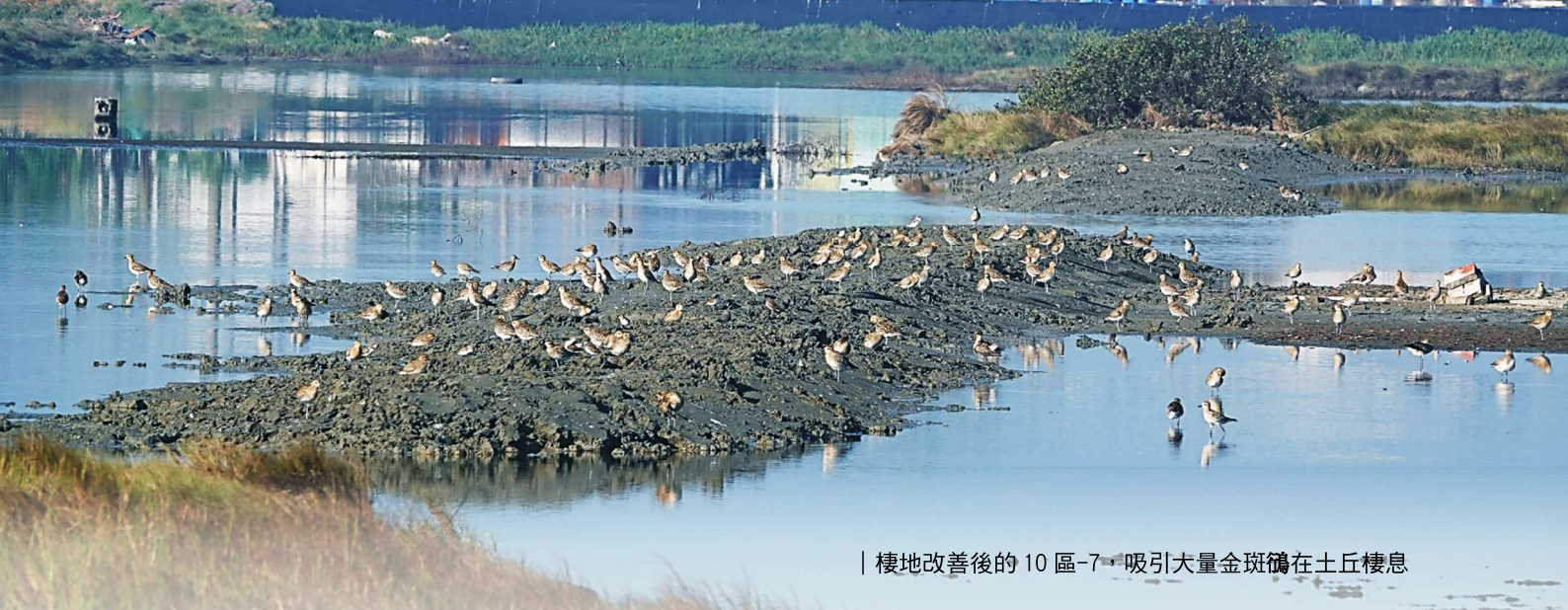
| 棲地改善後的 10 區-7，吸引大量金斑鴉在土丘棲息