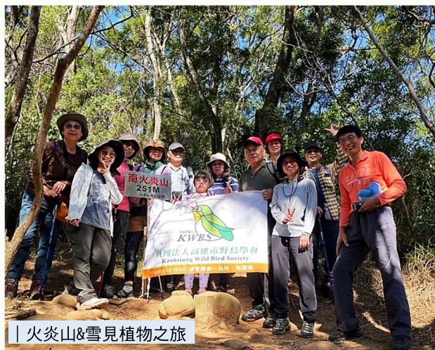
| 火炎山&amp;雪見植物之旅