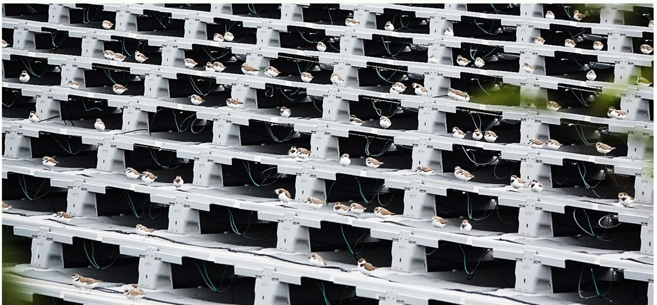
| 光電板上約停棲 500 隻東方環頸鴿

12 月時，也觀察記錄到新塭南區滯洪池有鳳頭潛鴨棲息，光電板上約停棲 500 隻東方環頸鴿；十區有大量黑腹燕鷗；九區擘恆電廠保留區大群的鳳頭潛鴨與白冠雞；空心菜收成後農田聚集上百隻小斑鴿…等豐富的鳥況。