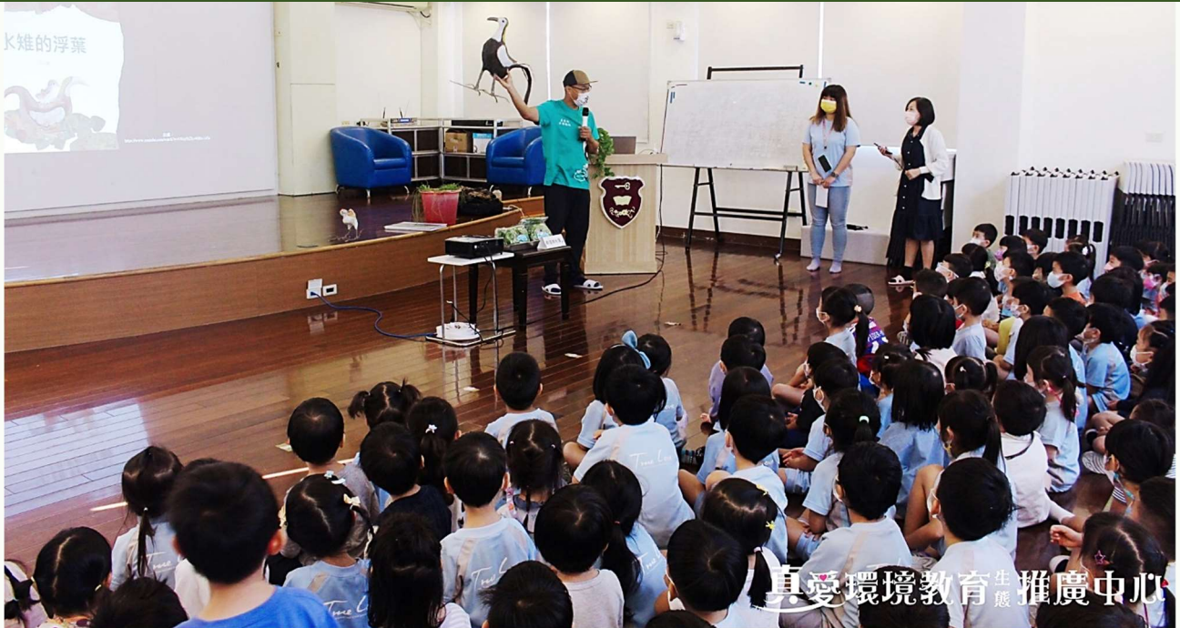
| 至真愛國際幼兒園推廣友善水雉野蓮

入冬後，工作愈加繁重，除了整理種苗池、大灣棲地、水草育苗的勞動外，隨著疫情趨緩，參訪邀約的頻率增加，也需處理綠獎、年度報告與林務局計畫的結案報告。目前美濃湖水雉棲地共計有 61 隻水雉利用度冬，志工隊長廖朝景在民間棲地盤點到多達 11 隻的田鵲、彩鵲亦有 5 隻。大灣棲地於 11 月中旬迎來稀有迷鳥～棉鴨，讓鳥友不必出國，即能在美濃湖賞棉鴨！初來乍到即在大灣棲地啄食印度芥菜的花朵，熟悉環境後，會與白冠雞一同探索美濃湖畔。黃淑玫老師亦在大灣棲地邊緣的草叢發現小秧雞與東亞秧雞，均為稀有冬候鳥。