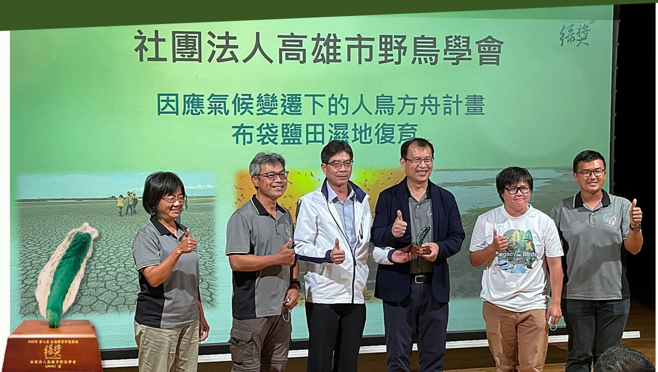
| 布袋鹽田濕地的認養與經營管理工作獲得 2022 年第七屆聯電【綠獎】的肯定！