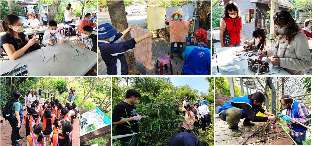
| 上圖：鳥松近期密集舉辦多場 DIY 活動～莎草編織、植物染、聖誕花圈等，讓大、小朋友玩得不亦樂乎