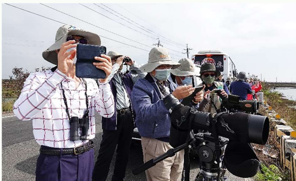
| 國產署署長陪同財政部部長等一級長官親臨布袋賞鳥

認養布袋鹽田邁入第四年，國產署署長 12/03 安排一趟布袋鹽田的賞鳥之旅，陪同財政部部長等一級長官親臨布袋，由總幹事及布袋團隊接待；而黑面琵鷺也不負眾望降落在鹽田濕地，近距離觀賞並用手機就可以拍到覓食的畫面，讓長官非常開心。 | 近距離就能觀察到黑琵，令人開心