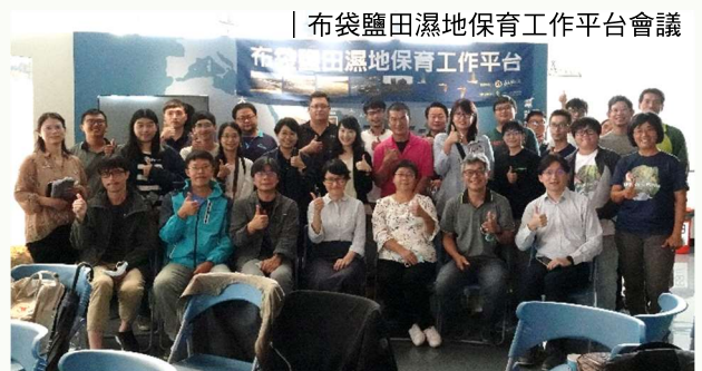
布袋鹽田濕地保育工作平台會議