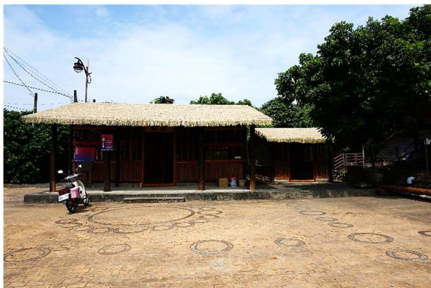
六重溪公廨現貌，以竹籠厝塔建分兩室