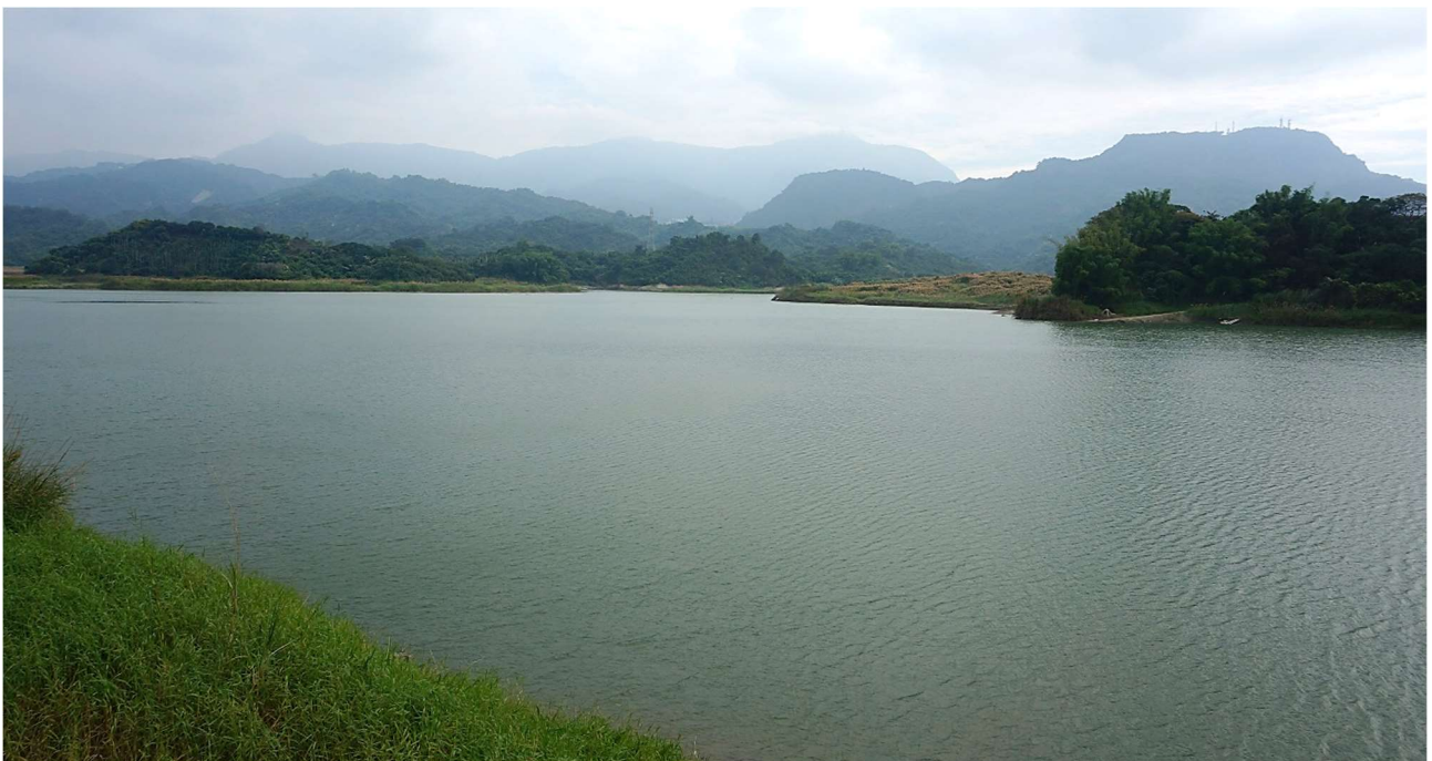
| 白河水庫遠眺枕頭山

白水溪教會海拔 150 公尺(197222,2583548)，1875 年，斗六都司吳志高以白水溪教會危害其祖墳風水為由，趁夜帶人縱火焚燒教會的禮拜堂及宿舍，甘為霖牧師連夜逃往嘉義縣城告官，後透過英國領事與清廷官方交涉，迫令吳志高賠償教會一百元及新建岩前教會以作為補償；俗諺「火燒白水溪，起岩前來賠」，此為白水溪事件的原由。花園內有甘為霖牧師紀念碑，敘說其為主盡忠可歌可泣的精神。另吳志高重建玉山書院，修大仙寺、白河福安宮，處理戴湘春事件，毀譽參半，褒貶不一。