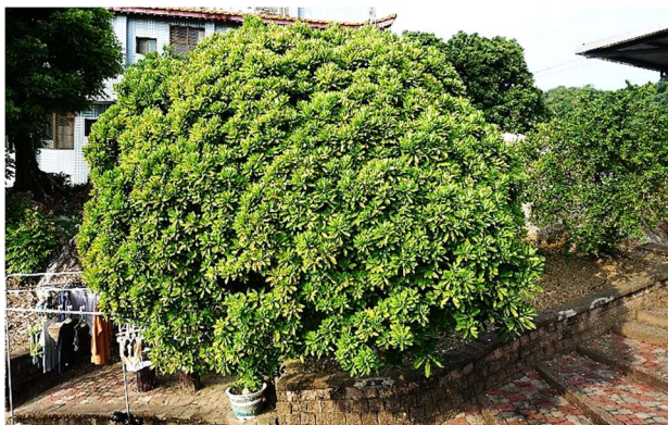
| 金剛纂，被修剪成榕樹形

其它植物另有酒瓶蘭、桂花、朱蕉、側柏、西洋杜鵑、蘭嶼羅漢松、玉蘭花、月橘、矮仙丹、福木、文殊蘭、蘋婆、臺灣肖楠、巴西鐵樹、樟樹、風鈴木、長葉垂榕、九芎、斑葉女貞、梅、山黃梔、金剛纂。