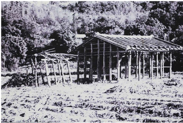
六重溪公廨老照片，可看出當時以刺竹為建築主體