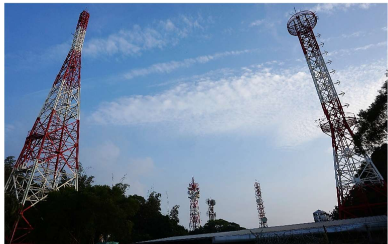
枕頭山上架設不少電臺的微波臺

枕頭山廢棄的漢聲電臺海拔 627(645)公尺(197550,2580714)，對面編號 CR030012, A01 是華視電臺，前方則是中央廣播電臺、警察電臺關仔嶺微波臺。指標樹茄苳胸圍 119 公分，植物另有變葉木、虎尾蘭、樹杞、構樹、蒲葵、臺灣山桂花、月橘、龍柏、槭葉牽牛、巴拉草、來社土茯苓、黃金葛、黑眼花以及狗骨消。狗骨消( Hedyotis uncinella )，學名由希臘文 hedys (甜美)和 otos (耳狀)締造而成，意指葉具有甜味呈耳形。