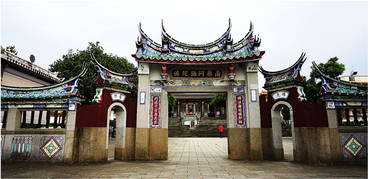
大仙寺，與俗稱新巖的碧雲寺，合稱為南瀛八大景之「關嶺雲巖」

6 號橋海拔 254 公尺(196410,2580293)，指標樹楹樹( Albizia chinensis )胸圍 190 公分，合歡屬名，其為紀念 1749 年將其引進栽種的佛羅倫斯·奧比奇·菲利普(Flippo Degli Albizzi)。高達 30 公尺，二回羽狀複葉，小葉 20-35 對，頭狀花序 10-20 朵，綠白花，密被黃褐色絨毛，莢果扁平，花期 5-7 月，果期 8-12 月。木材褐色，質柔軟、耐腐，可作硬質纖維板造紙及人造絲原料、家具、箱板，樹皮含鞣質、三萜皂甙、合歡催產素，對動物易造成流產。「楹」字，是古代計算房屋的單位，如「有田數百畝，屋三十楹」；或是指廳堂前直柱，後泛指柱子。