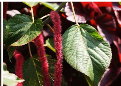
| 紅花鐵莧(長穗鐵莧)