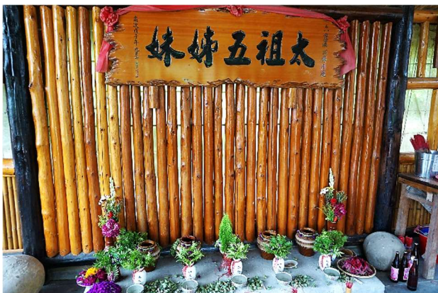
六重溪公廨祀奉太祖五姊妹