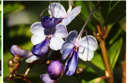
| 紫蝶花，花姿優雅，如翩翩群蝶飛舞

指標樹芒果樹胸圍 200 公分，教會花園的植物有蓮霧、山黃麻、朱蕉、聖誕紅、滿福木、立鶴花、美洲合歡、沿階草、煙火樹、野薑花、黃仙丹、辣木、大萍、真柏、百合竹、藍花楸、九重葛、厚葉榕、馬拉巴栗以及紫蝶花。紫蝶花