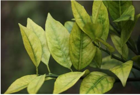
柳丁的柑橘黃龍病，是由柑橘木蝨媒介病菌造成