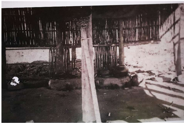
六重溪公廨老照片敘說篔簹路藍縷以啟山林之精神