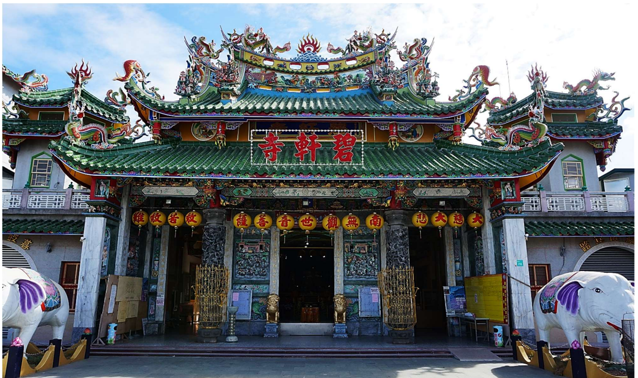
| 東山碧軒寺，其迎佛祖暨遶境活動，文建會核定為國家重要民俗資產

1706 年，應祥禪師奉觀音佛祖指示，將正二媽迎請至東山，並建草茅安奉，隨後便自行回碧雲寺，繼續修行之路。1844 年碧雲寺因兵燹而遭毀，東山先民遵從佛祖的指示，迎請正二媽至東山搭建便房安奉。2011 年 9 月 7 日東山碧軒寺迎佛祖暨遶境活動，文建會核定為國家重要民俗資產，2023 年 1 月 14 日(農曆 12 月 23 日)6 時 51 分登轎安座，7 時 27 分鑾駕起程；1 月 31 日(農曆正月初十)22 時 36 分恭請出龕，24 時 29 分登轎安座，24 時 53 分鑾駕起程回駕佛祖遶境。香路圖~(1)火山碧雲寺、(2)古香路、(3)三求精舍、(4)文興宮、(5)奉元宮、(6)石廟仔、(7)王爺廟、(8)福興堂(挽香)、(9)代天府、(10)明聖殿(挽轎)、(11)保安宮、(12)福德祠、(13)東山碧軒寺，全程約 23.4 公里。