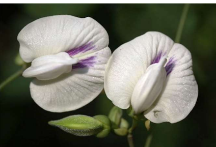
| 山珠豆(白花)，被引進做為綠肥