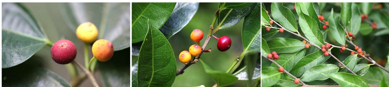
| 澀葉榕，葉片粗糙、中間寬，榕果大(左圖一)；菲律賓榕，葉三出脈狹長，葉基兩側脈較接近葉緣，榕果小(左圖二、右圖)

金剛纂( Euphorbia neriifolia )，別名霸王鞭、五楞金剛、金剛樹、龍骨刺，原產地在印度。原住民利用葉子與糖漿煮成糖果，樹皮是強瀉劑，葉子是利尿劑，葉子加熱壓榨加鹽吸取汁液治療哮喘、感冒，根與黑胡椒混合是防腐劑，外治毒蛇咬傷，生汁液有毒性會引起水泡。1700 年臺灣就引進栽培，碧雲寺香客大樓旁將其修剪成榕樹形。