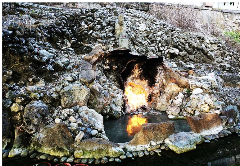
| 水火同源, 曾名列臺灣七景之一和臺南市八景之一

指標樹芒果胸圍 251 公分, 有 6 株臘腸樹( Kigelia pinnata ), 最大株胸圍 180 公分, 學名是由非洲莫三比克土名拉丁化締造而成, 1922 年引進栽培。紫紅色筒狀花萼, 先端淺 5 裂, 夜間綻放, 具有芳香; 雄蕊 4-6 枚, 花絲白色, 鮮果有毒, 食用易腹瀉。原產地是全株供狒狒、猴子、野豬、河馬食用, 大象、南非大羚羊則食用葉子, 鸚鵡食用種子。