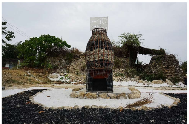
白河石灰產業文化教育園區〈枕頭山腳ㄟ灰窯〉

白河石灰產業文化教育園區〈枕頭山腳ㄟ灰窯〉海拔 173 公尺(196049,2582330)，位於志昌石灰工廠閒置外圍。公共藝術以舊石灰窯為原型製作，搭配燒製過程中使用煤炭(已由木炭取代)與石灰石，做成枯山地景藝術，建置入口意象。1923 年津口毅一成立關仔嶺興業公司開採石灰以運用在糖業，1941 年架設空中纜車，1947 年烏樹林糖廠設礦物料及增設五分車軌道，1960 年糖業沒落，1975 年廢除纜車改成卡車運送，1983 年烏樹林糖廠關閉，1991 年禁止開採石灰石。仙草里鼎盛時期有六家石灰工廠，相關從業人員達三、四千人，形成山區繁華小鎮。