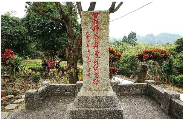
| 甘為霖牧師紀念碑，敘說其為主盡忠可歌可泣的精神