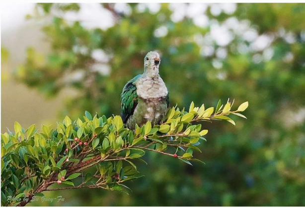
| 高字塔旁的榕園曾出現小綠鳩，風靡一時