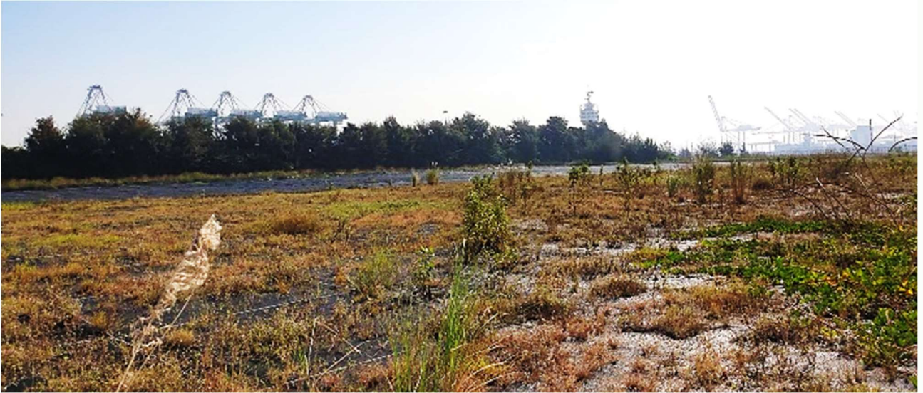
| 木麻黃林的西側有一大片漫草平地，是猛禽的覓食場地

舊高字塔，指示著野鳥遷徙的路線，木麻黃林的西側有一大片漫草平地，賞鳥人稱它為「大草原」，聽說是填土造陸出來的，這兒是猛禽的覓食場地，裡頭多的是外來種擴散的「多線南蜥」，常可見黑翅鳶在此覓食，紅隼、遊隼也經常出現，因為很多養鴿人士會到這個區域放飛訓練鴿子。當然，出現的猛禽不只這些，鳳頭蒼鷹、蜂鷹、魚鷹、赤腹鷹、灰面鵟鷹、鵟等都可能出現，就看鳥運！此處不只有機會遇到猛禽，草原裡還有小雲雀、鷓鴣、棕扇尾鷓，還有過境的鸚鵡科、鵲科及雀科等鳥類，只是不容易觀察。