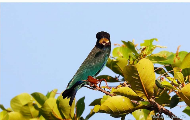
| 佛法僧的出現，讓拍鳥人蜂湧而至

從靠近木麻黃林的平台，可以望見稍遠處有幾株欖仁樹，那是一些野鳥可以落腳停棲的地方，先前待了兩個星期多的佛法僧就經常在此停棲，讓拍鳥人蜂湧而至，竟然將野草地踐踏成步道，盛況可想而知！此外，灰卷尾、紅尾伯勞、鵲科也都會停棲，甚至池鷺也曾停過。