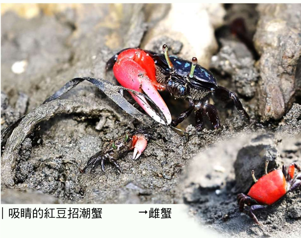
| 吸睛的紅豆招潮蟹 → 雌蟹

這片榕樹園原本有棵比較高大的枯樹，來往的野鳥常會駐足停棲，鳥友們如果登上舊高字塔二樓露台，與這棵枯樹的距離便會拉近，角度也剛好，只要有特殊鳥種停棲，很容易可以記錄及拍到較滿意的畫面，因此被戲稱為「神枝」。