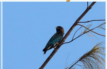
佛法僧的羽色閃亮，有著鮮翠綠至藍綠色的金屬光澤