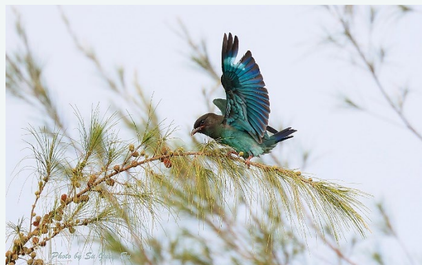
| 稀有過境鳥～佛法僧

後來，約距今750年前的某個夏天，金剛峰寺裡有位和尚白天在寺旁林子裡看到一隻藍青色漂亮的不知名野鳥，印象極為深刻，當天夜晚林子裡忽然傳來宛如「bu pou sou」的鳥叫聲，仔細傾聽，倒像是「佛法僧 ブッポウソウ」的發音，此時不禁聯想到白天在林子裡看到的那隻野鳥。心念一轉，真是難得啊！此鳥晚上還會唸佛呢！