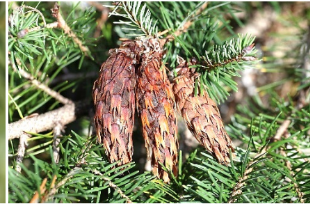
| 花旗松，是北美常見之經濟樹種

浮築路海拔 1637 公尺(277296,2724089)，大約 63 步，見證帝國主義以隘勇線行教化與威壓之實，主要目的是為確保日商在山區樟腦林產之利益。