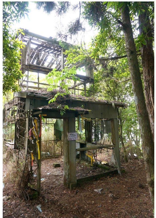
| 錦屏山山頂已廢棄的森林瞭望台

伐木鋼索海拔 2015 公尺(274047,2723173)，鋼索約有 12 公分寬，是見證這片森林遭遇人類濫伐的證據。2022 年世界森林狀況報告《唯有健康的星球，才有健康經濟》，生物多樣性能調適氣候危機，帶來永續經營高效益。常見玉山箭竹、高山新木薑子、烏心石、大葉石櫟、圓葉冬青。