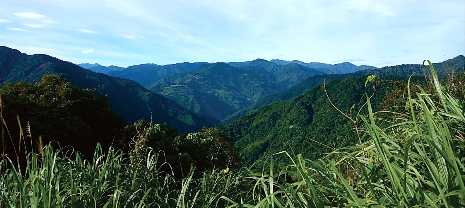
| 自芝生毛台山眺望泰平山、夫婦山、拉拉山、塔曼山、馬海望山、大霸尖山、基那吉山、養老山、加利山、境界山及檜山