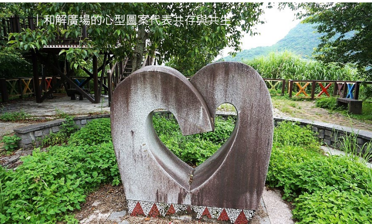
| 和解廣場的心型圖案代表共存與共生