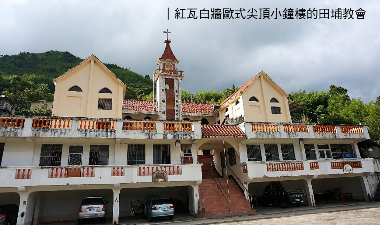
| 紅瓦白牆歐式尖頂小鐘樓的田埔教會