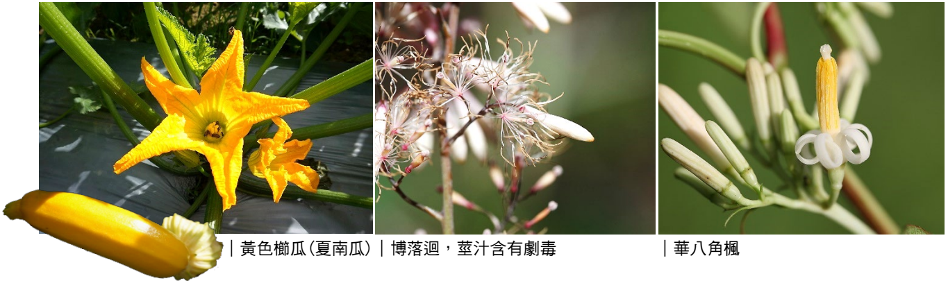
| 黃色櫛瓜(夏南瓜) | 博落迴，莖汁含有劇毒