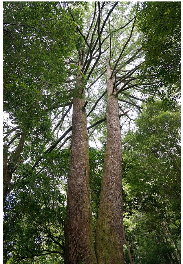
| 胸圍 570 公分的夫妻樹(台灣黃杉)

海豚石海拔 1785 公尺(275979,2724322)，丈量長 360 公分、寬 166 公分、高 240 公分，砂岩酷似海豚，是森林稜線重要景點。指標樹華山松胸圍 250 公分、台灣黃杉 310 公分。海豚石周遭植物有圓葉冬青、阿里山茵芋、毛柱楊桐、薄葉虎皮楠、西施花、錐果櫟、墨點櫻桃、巒大紫珠、台灣樹參、卡氏槲、大葉石櫟、木荷、毬子櫟、有刺鳳尾蕨、紅柄鳳尾蕨、變葉新木薑子、長葉