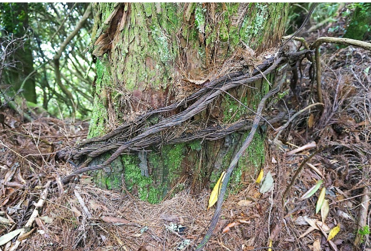
| 伐木鋼索是見證這片森林遭遇濫伐的證據

2000 峰海拔 2012 公尺(274464,2723134)，指標樹華山松，胸圍 210 公分，路牌指標至錦屏山約需 40 分鐘。觀察柳杉造林胸圍 33-140 公分，林層下有西施花、台灣杜鵑、細枝柃木、木荷、錐果櫟等優勢種。