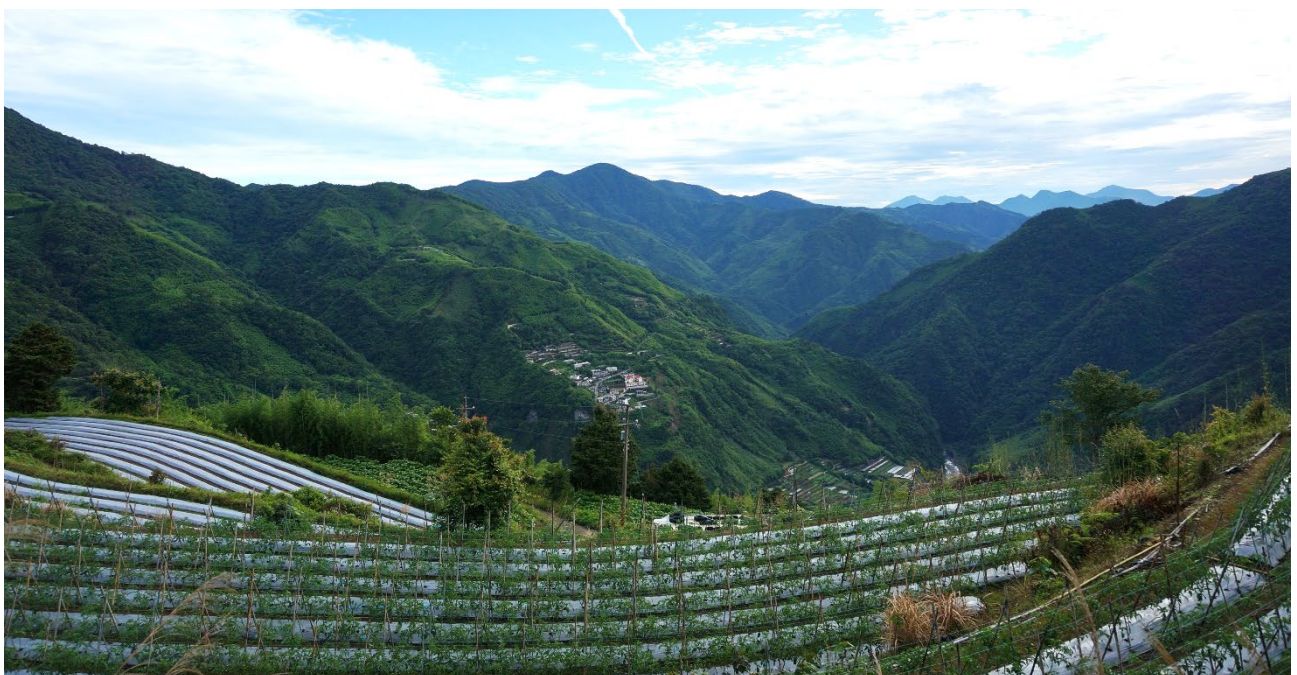
| 自烏來山遠眺馬望僧侶山、夫婦山、拉拉山

叉路口海拔 1422 公尺(277560,2724512)，右方五節芒廢產道，可不經屯野生台山直達石麻達山；屬回程路線縱走，全程 12.3 公里，費時 8 小時。指標樹短尾葉石櫟胸圍 122 公分，伴生小構樹( Broussonetia monoica )，單性花，雌雄同株，雄花序頭狀。比較構樹，雌雄異株，雄花序穗狀下垂，和楮樹相同。植物另有青楓、尖葉楓、山豬肉、山香圓、華鳳丫蕨、光高粱、石月、杜虹花、角花烏斂莓、飛龍掌血、變葉新木薑子、香桂、烏心石、金毛杜鵑、馬藍、台灣三尖杉、台灣天南星、小椴葉懸鉤子、台灣排香。