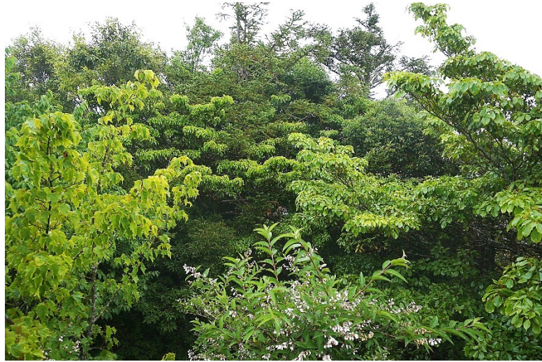
| 台灣紅榨楓與昆欄樹

指標樹昆欄樹，胸圍 172 公分。三角點植物有西施花、南燭、青楓、台灣紅榨楓、薄葉鈴木、玉山杜鵑、玉山糯米樹、杉木、大葉溲疏、山櫻花、毬子櫟、厚葉鈴木、狹葉櫟、玉山假沙梨、台灣杜鵑，外圍全是柳杉造林。原路折返，經石麻達山、海豚石、夫妻樹至岔路口，右線經屯野生台山，選擇左線則返回田埔產業道路。