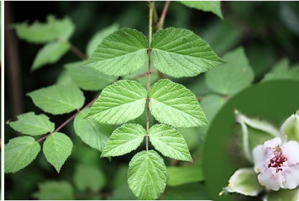
| 小构葉懸鉤子 ↑ →