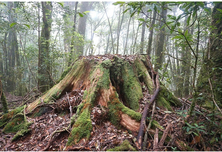
| 胸圍約 1050 公分的紅檜殘木

紅檜殘木海拔 1983 公尺(274629,2723194)，紅檜胸圍約 1050 公分，想像一下，當初雄踞一方是多麼雄偉的神木！無奈 1896 年本多靜六林學博士採集後，發現其與日本花柏是近緣種，主張強力開採，濫伐結果造成今日所見的墳場。四周今已補植柳杉，伴生高山新木薑子、細枝柃木、薄葉柃木、大葉石櫟、四川灰木、錐果櫟、粗毛柃木、卡氏槲、毘子櫟、霧社木薑子、長果紅淡比、木荷、水絲梨、假柃木。