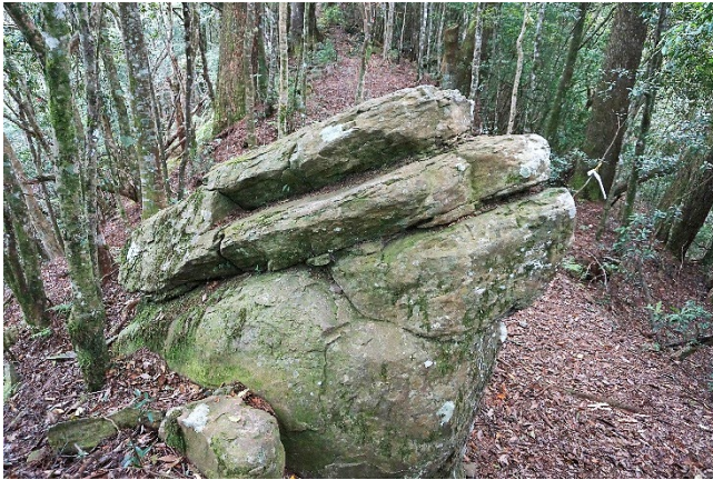
| 海豚石，是森林稜線的重要景點