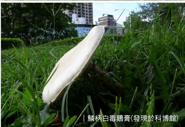
| 鱗柄白毒鵝膏(發現於科博館)