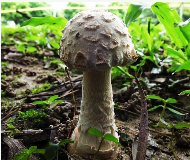
| 鱗柄白毒鵝膏(幼時)