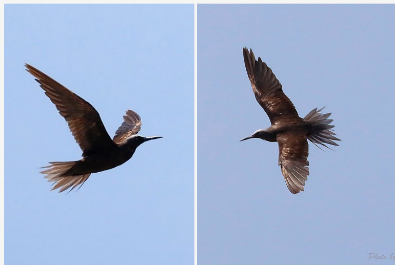
| 黑玄燕鷗廣泛分布於熱帶、亞熱帶，在臺灣屬於迷鳥