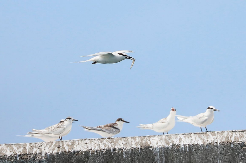
| 堤岸邊，還有不少紅燕鷗及蒼燕鷗，這兩種鷗鳥很多是帶著幼鳥遷徙，不少還在餵食階段，親鳥辛苦，幼鳥也辛苦