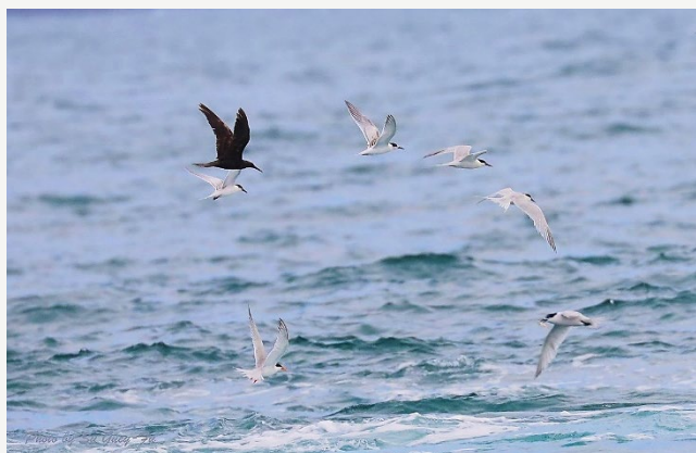
在二港口發現一隻黑抹抹的鷗鳥～黑玄燕鷗

隔天，鳥友來訊說黑玄燕鷗還在，會在對岸的水泥沉箱上的欄杆上停棲，有大船出入時會飛出跟船覓食，在綠燈塔附近觀察算是比較近的，於是再抽空前往，果真如此，有時還出現在更外