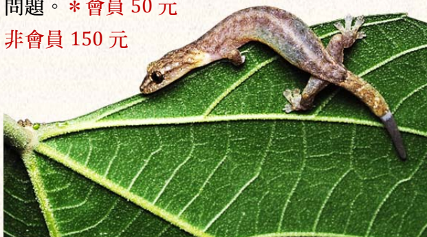
| 身體纖細的半葉趾蜥虎