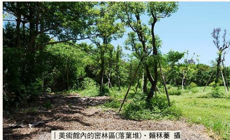
| 美術館內的密林區(落葉堆)