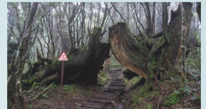
太平山鐵杉步道