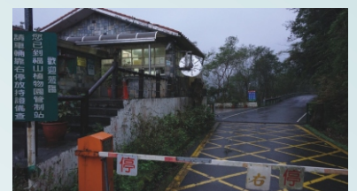
福山植物園/凌明裕 攝