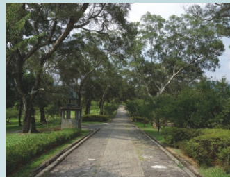
角板山行館