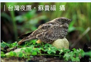
| 台灣夜鷹

人口不斷成長，環境不斷演化，無形中也影響到鳥類的演化，近十幾年來，有些本土野鳥產生都市化現象，也有不少外來鳥種大舉擴張族群，造成不良影響。本次將介紹這些鳥種的生態行為及其造成的影響，並思考應如何為野鳥留片天地。內容包括：野鳥的都市化、都市鳥種、外來種鳥類及其影響、為生物多樣性留空間等。