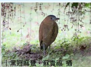
| 黑冠麻鷺