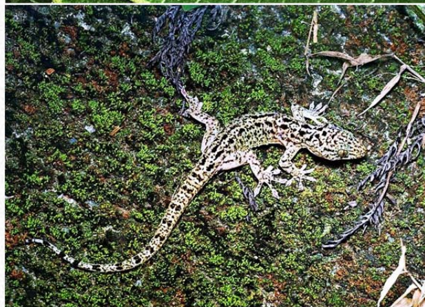
| 上圖：身體纖細的半葉趾虎。下圖：菊池氏壁虎