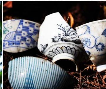
| 彩繪磁碗