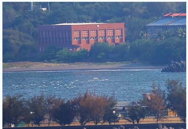
黃頭鷺沿著中山大學校區的壽山邊緣北上

的在地特色。不由心想：普鳥也可以拍得不普！ 咦！今早這兒怎麼都沒其他鳥人，獨享奢侈！