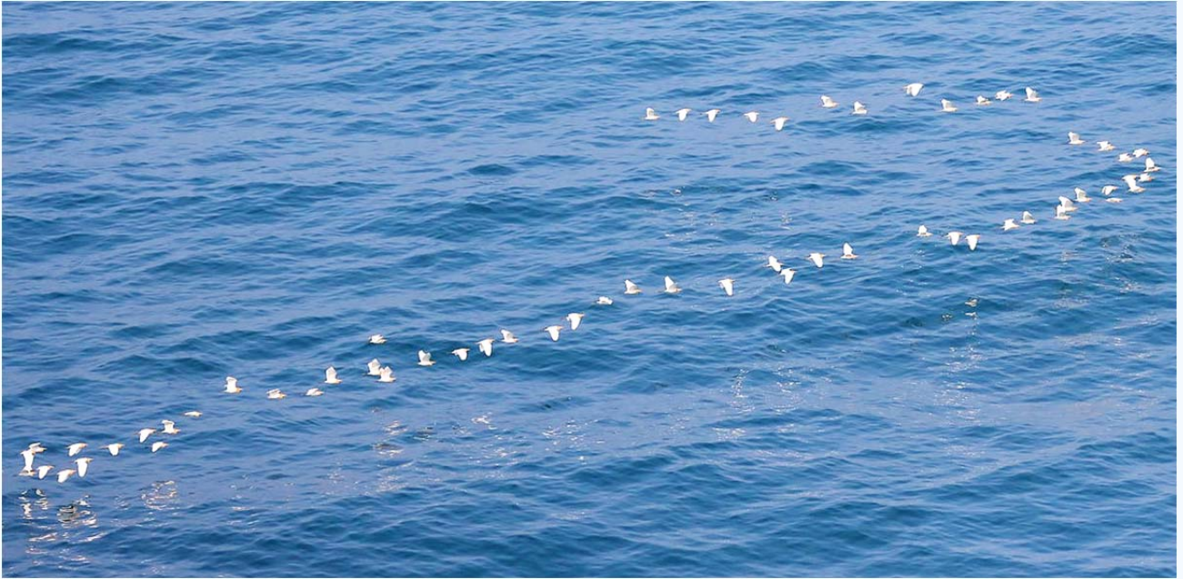
黃頭鷺在海面上連成一線，宛如一條珍珠

隻以下。其中，有三群黃頭鷺從岸邊海面低空飛過，最能感受海面遷徙之美；最多的那群飛過港區航道時，正好遇上一艘歸航的漁船，船上的人可樂了吧！相信事後大夥兒一定會津津樂道：「這麼幸運！」另有一群8隻突然從頭頂飛過，別有驚愕之感：難得人鳥座標重疊呢！稍晚的遷徙，黃頭鷺飛行的高度離水面較高，可能是受熱氣流所影響吧！