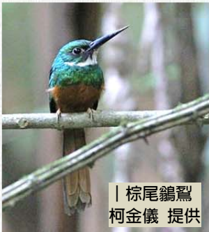
棕尾鷓鴣

翟鵬是中油的子弟，青少年在高雄煉油廠的園區長大。就讀東海大學生物系時，受到歐保羅教授的啟蒙，以台灣鳥類的生態棲位作為碩士論文；同時，創辦了學生社團的野鳥社，比台北鳥會還早一年。1987年在德州大學奧斯汀分校取得博士學位，論文是研究波多黎各雨林裡的熱帶鳥類