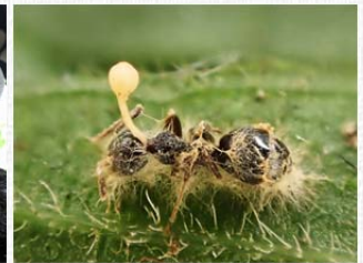
黏小奧德磨(左)、蛇蟲草(右)