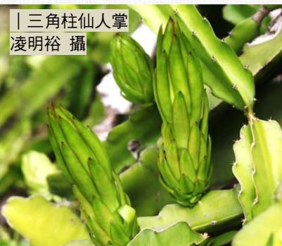
三角柱仙人掌