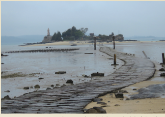
金門建功嶼

金門具有獨特的海島特色文化，有閩南古風的宗祠祭典、高密度而造型獨具的風獅爺與辟邪物，處處可見傳統聚落與古蹟建築。因位於大陸邊緣，又是候鳥南來北往的中繼站，鳥類資源特別豐富，全島到處可見彩羽繽紛、群鳥悠然停棲的景致，也是賞鳥人士的天堂。請跟隨我們的步伐，一同欣賞金門繽紛的冬日美景。