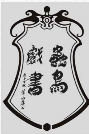
| 半屏山珊瑚礁→