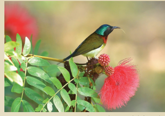
叉尾太陽鳥