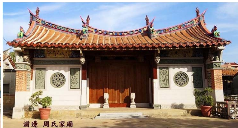
浦邊 周氏家廟 | 圖 7. 浦邊聚落的周氏家廟