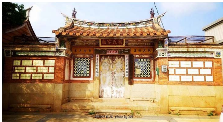
圖 3. 翁氏家廟

位於頂堡東全庄頭之大宗家廟【翁氏家廟】(圖 3-4)，建於 1731 年，1772 年遷於現址，距今已有 250 年。家廟內可見歷史悠久的木條樑柱，