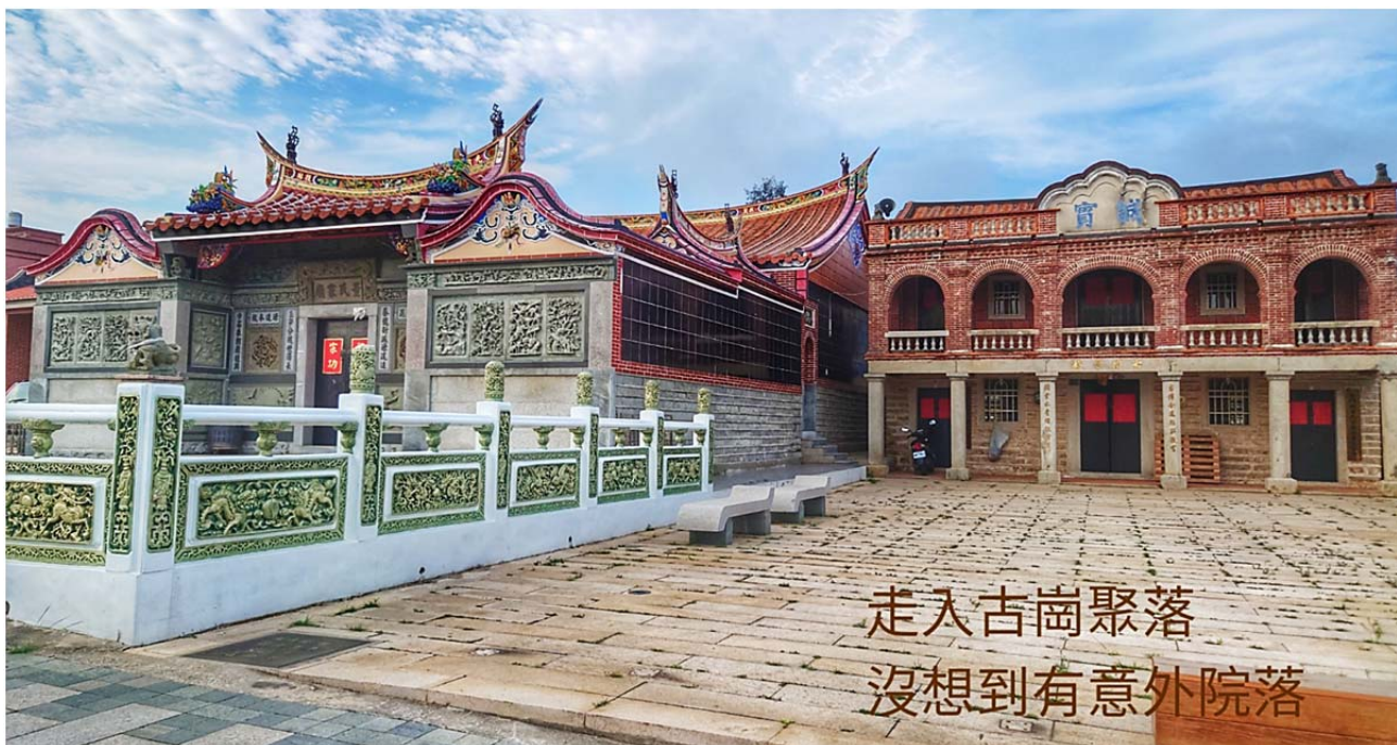
圖 12. 古崗聚落，家廟、洋樓並陳

如果您想看具原始較古樸的民宅聚落、家廟宗祠，就要加緊腳步速速前往，一趟、兩趟金門行是不夠的，找個時間來趟金門賞鳥之餘，外加傳統建築家廟文化慢旅，絕不會是金門只看軍事建築坑道的行程，走入非觀光景點的聚落，相信將有不同以往的感受。