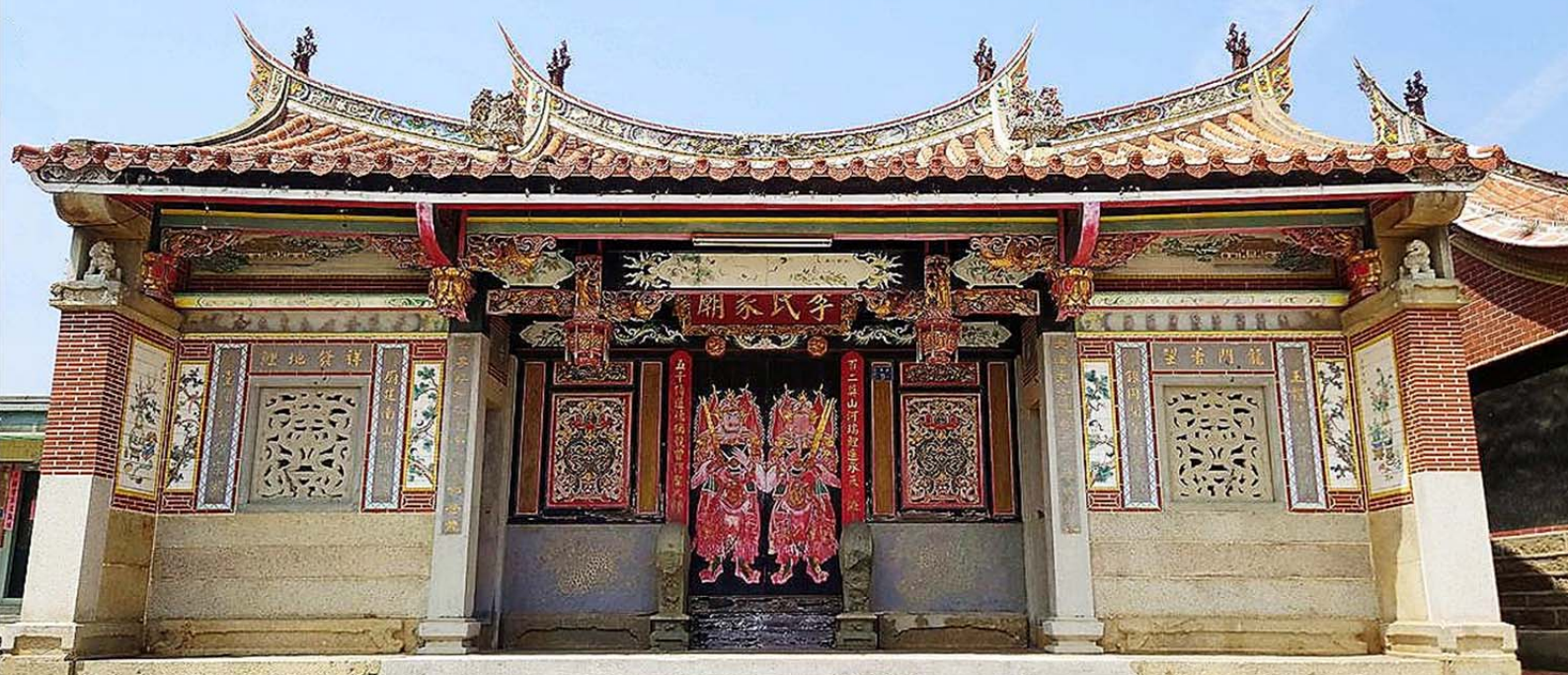
南山聚落/李氏家廟(古寧頭南山、北山與林厝聚落共有 7 座「李氏家廟」，其中南山「李氏家廟」是古寧頭三村之李氏族人始祖之大宗家廟)

金門縣政府、金門國家公園為維護各聚落自然生態環境，保存傳統、文化特色，凝聚居民意識，透過公私部門資源整合軟硬體建設計畫，古厝、洋樓翻修，或是將無人居住的損毀雜木處理，讓整個聚落呈現新面貌。文建會將金門全島列為「世界遺產」的潛力點，即是肯定金門文化資源之豐富；金門致力發揚閩南文化，打造「活的閩南文化島」、「活的博物館」，在「聚落創生」理念串聯全島各家廟，建立數位資產典藏，將如血脈連結各聚落、家廟、姓氏及族譜等資源發展，打造華人宗族尋根交流入口平台！