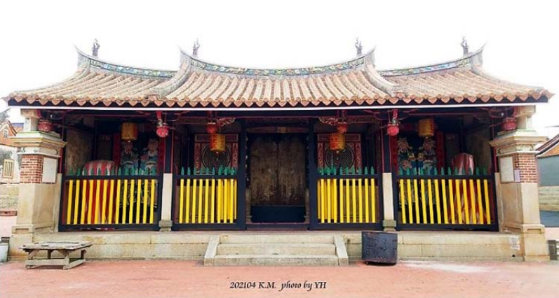
202104 K.M. photo by YH | 圖 6. 瓊林聚落的十一世宗祠

水頭聚落屬於多姓聚落，其中黃氏宗祠就有三座，顯見黃氏家族地位極重。水頭聚落大宗宗祠【黃氏家廟】，其風水穴爲「虎穴」，習俗上新娘不可入內祭拜。黃氏家廟屬二落大厝+右護龍形式，立面屬寬廣，大門旁的子午雕花窗，著色五彩繽紛細緻精美，門下青石石鼓顯見穩重莊嚴。(圖 8)