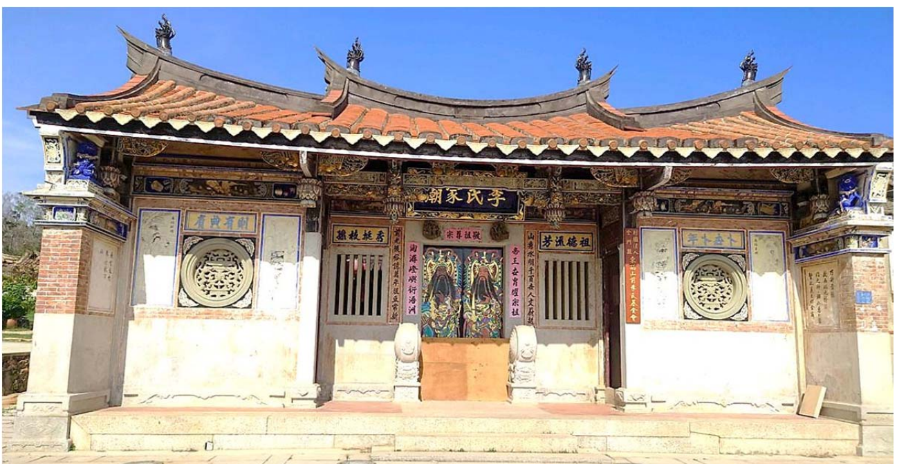
圖 5. 西山前聚落的李氏家廟，為縣定古蹟

談到家廟宗祠，絕對少不了〈瓊林聚落〉。瓊林位於金門中央偏北，環島北路旁，就有一尊