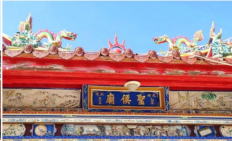
圖 2. 寺廟的龍頭則朝內

祠，而其一間內有二宗祠)；頂堡聚落(分頂堡東、頂堡西)有二間宗祠，下堡聚落(分下堡東、下堡西)也有二間宗祠，頂堡與下堡都是翁氏，四間宗祠外還有一間古老的大宗家廟(宗祠)。