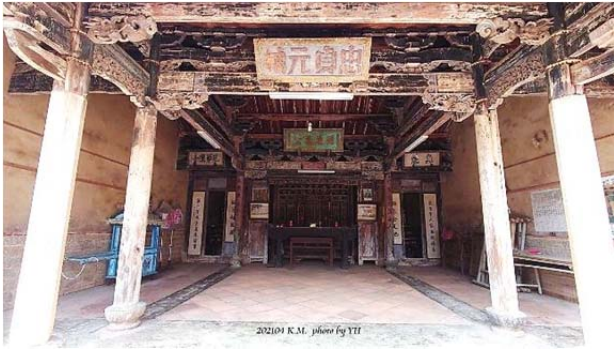
圖 4. 位於頂堡東全庄頭之「翁氏家廟」，家廟內可見歷史悠久的木條樑柱

除了祖先牌位，幾乎都掛滿「進士」、「翰林」、「博士」等匾額，代表後代子孫光宗耀祖的事蹟。