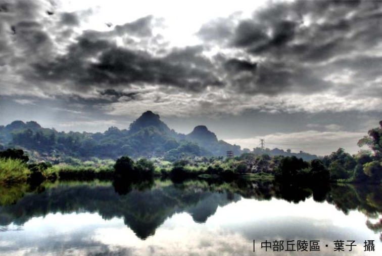
| 中部丘陵區

育過程、土壤母質組成地質的自然生育環境，如高位珊瑚礁及泥岩惡地等，這些環境常為貧瘠、水分容易流失或土盤過硬，植物難以深根，而這類環境卻也孕育許多特殊且為高雄獨有之生態與物種，歡迎來瞭解～ *會員 50、非會員 150