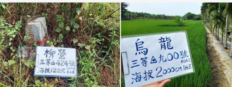
| 平地三角點

(四) 講者：葉子/「原來野花這麼美」一書作者 自高雄縣市合併後，大高雄地區晉身為台灣面積最大的直轄市；在地形地貌上，從玉山南峰海拔標高 3,844 公尺的高山山地、丘陵平原一直到沿海，橫跨寒帶、溫帶、亞熱帶、熱帶等多個氣候型態，生態與地景皆具有相當高度的多樣性。高雄地區氣候以 4 至 9 月雨量最為豐沛；10 月至隔年 3 月降雨量最少，有明顯的長時間乾季，屬熱帶季風氣候。陸域生態系依海拔大致分為東北區高山、中部丘陵區、西南部平原、沿海地區，海拔由東北向西南遞減。此外，更有區域性特殊化