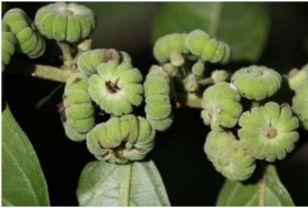
| 菲律賓饅頭果是許多蛾類的主要食草