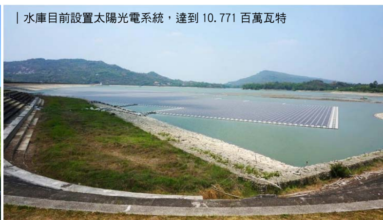
| 水庫目前設置太陽光電系統，達到 10.771 百萬瓦特