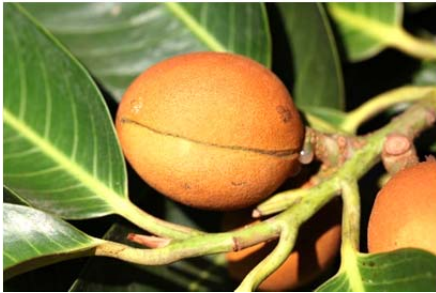
蘭嶼肉豆蔻，核果與假種皮含有脂肪