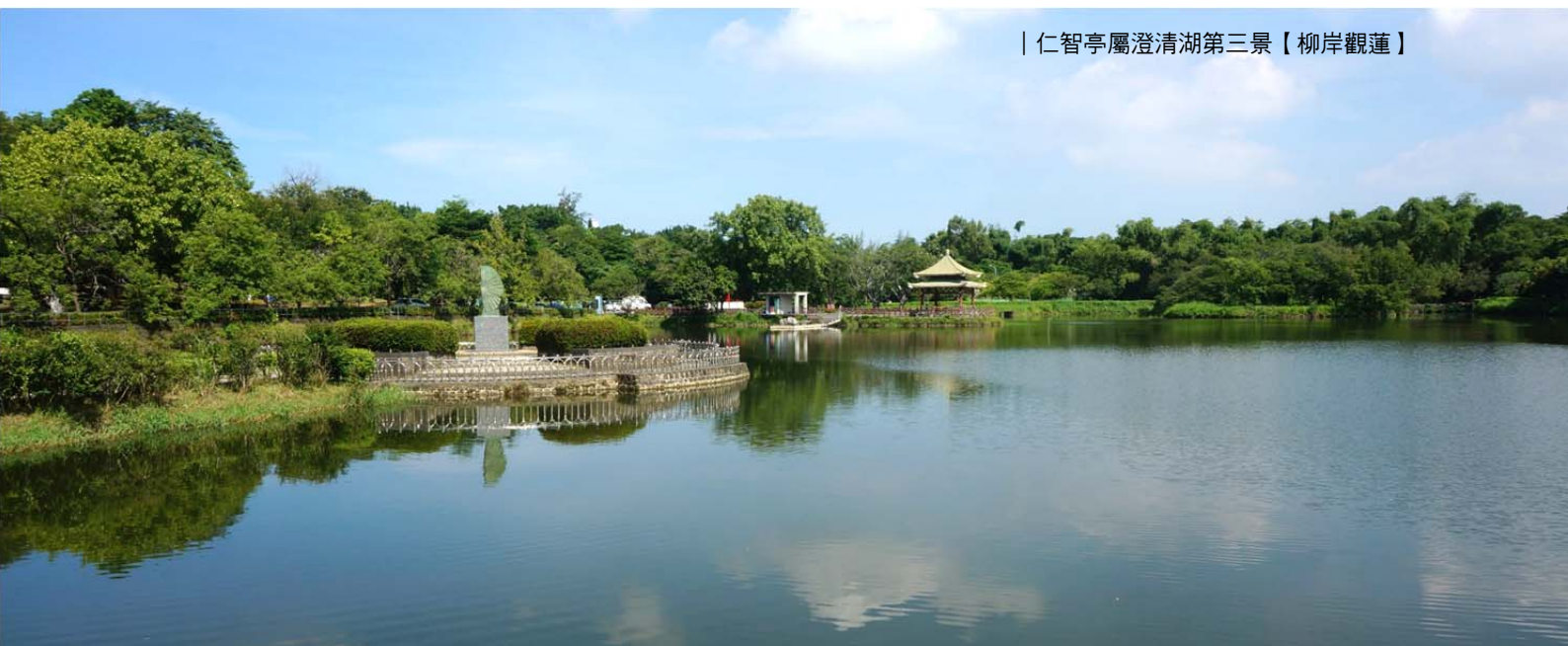
| 仁智亭屬澄清湖第三景【柳岸觀蓮】

甘泉橋頭叉路有美葉蘇鐵、油患子、火筒樹；側面有日本田澤湖的守護神〈辰子飛翔之像〉與黃鸝、大葉桃花心木。指標樹是在舊有划船場的菩提樹，胸圍 436 公分。常見植物黃花風鈴木( Handroanthus chrysanthus )，原產地墨西哥至委內瑞拉，是巴西國花，1969 年引進，3 月金燦耀眼，華麗爆發，黃金廊道蔓延河堤。相似種毛風鈴木，蒴果披絨毛，掌狀小葉較厚，先端全緣，花萼筒密披絨毛，盛開 3 月與 10 月。