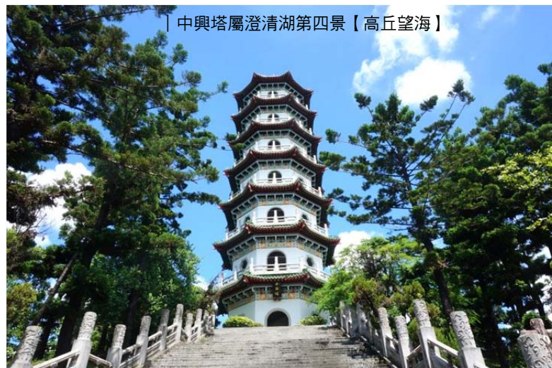
中興塔屬澄清湖第四景【高丘望海】

植物花季隨時序遞嬗，近觀 3 月苦楝、黃金風鈴木，4 月油患子春紅，5 月鳳凰木紅似火，7 月鐵刀木、盾柱木金黃耀眼色彩。空中注視樹冠層，刺竹垂柳型，木麻黃一枝獨秀型，檸檬桉、濕地松、阿勃勒、楓香、銀樺圓錐形，鳳凰木、