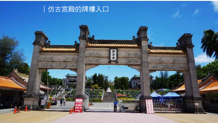
| 仿古宮殿的牌樓入口

類、黑板樹、春峰(雞冠木)、朱槿、鵝掌藤、美人蕉、黃槿、棋盤腳、茉莉花、馬拉巴栗、麒麟花、芙蓉菊、桂葉黃梅、福木、千年竹、刺軸欄、盾柱木、琴葉榕、黃蝴蝶以及銀樺。銀樺( Grevillea robusta )原產澳洲昆士蘭，近觀此株已栽種 30 年，植株開黃花，花兩性，花被片 4 枚，基部橘色連合，線形，反捲，雄蕊 4 枚，著生在深紅色花被片上，花柱細長如彎曲麥克風。銀樺的樹葉會產生一種植物相剋物質，抑制其它植物，在毛里求斯(模里西斯)、加勒比、法屬波利尼西亞等國家被視為入侵種，木屑粉含有十三烷基間苯二酚，會造成過敏皮膚炎。