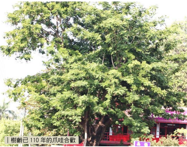
樹齡已 110 年的爪哇合歡