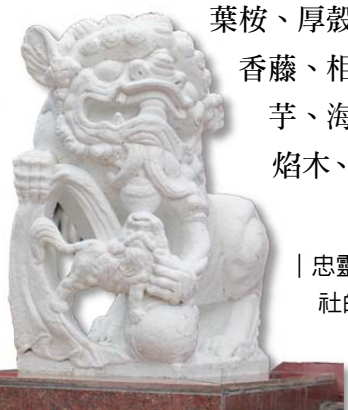
| 忠靈塔前的石獅子，原是 1933 年鳳山神社的三對狛犬之一

〈正氣亭〉指標樹榕樹胸圍 238 公分，常見植物大王椰子、大王仙丹花、山柚、臘腸樹、大葉桉、厚殼樹、百合竹、蟲屎、血桐、扛香藤、相思樹、黃金葛、春不老、合果芋、海金沙、黛粉葉、棟、烏臼、火焰木、龍柏、黃椰子、叢立孔雀椰子。