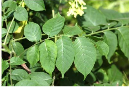
麻棟，花中含有紅色、黃色染料，嫩枝與樹皮含有單寧