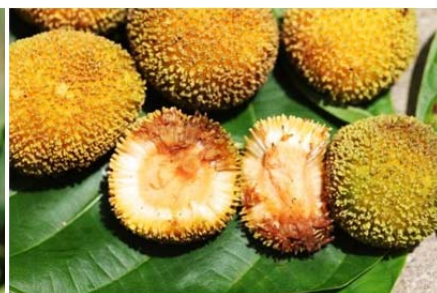
| 卡鄧伯木為印度神聖樹