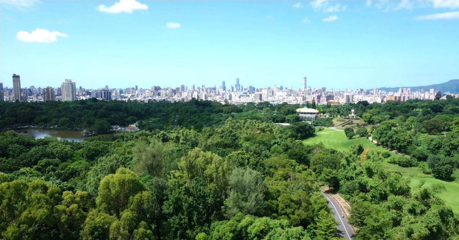
| 從中興塔塔頂登高遠眺高雄的著名大樓，也深刻感受被綠樹環抱的美好心境

雨豆樹、大花紫薇、水黃皮傘型，樟樹、鐵刀木、錫蘭橄欖、台灣欒樹圓形，另大王椰子、叢立孔雀椰子、可可椰子呈現棕櫚形。