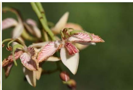
| 羅望子在亞洲、拉丁美洲地區被當調味料