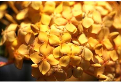
| 矮黃仙丹 | 水竹芋