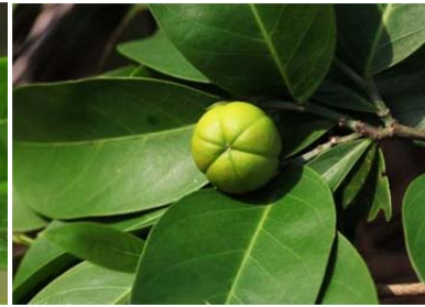
| 白樹仔的蒴果球形，由綠轉黃色，比泰國產(右圖)的小

建茶、月桃、小葉桑、馬櫻丹、毛蓮子草、烏柑仔、山素英、海金沙、高雄卷柏、酢漿草、三角葉西番蓮、山柚、恆春厚殼樹、鷓鴣、瓊麻。