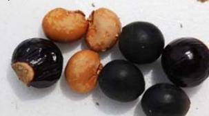
| 油患子小、無患子中、龍眼大