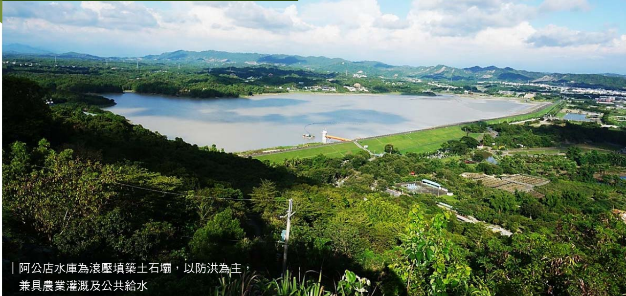
| 阿公店水庫為滾壓填築土石壩，以防洪為主， 兼具農業灌溉及公共給水

阿公店水庫位於高雄市燕巢區、岡山區與田寮區交界之阿公店溪上游，為滾壓填築土石壩，壩長 2.38 公里、高度 31 公尺、寬度 8 公尺，豎井溢洪管自然溢洪，無控制自由溢流堰，集水面積 31.87 平方公里，以防洪為主要目標，兼具農業灌溉及公共給水。