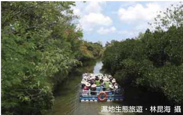
濕地生態旅遊