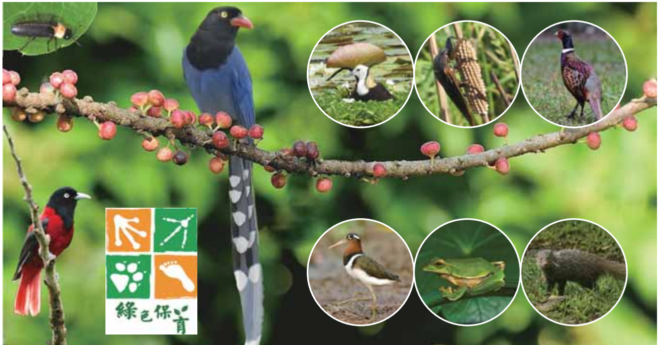
綠色保育物種～黃胸黑翅螢、朱鷗、台灣藍鵲、水雉、大田鱉、環頸雉、彩鷓、翡翠樹蛙、食蟹獾

根據慈心基金會的統計，截至2020年8月31日止，共有391戶農友通過綠色保育標章，通過面積達591.20公頃。包含翡翠樹蛙、台灣藍鵲...等47種申請物種，營造187處水域、陸域及多樣化棲地環境。慈心基金會執行長蘇慕容說：「綠色保育的推動事實上是一種『提醒』！是對生產者的提醒，希望在生產過程中，關照他農地裡的生物；也提醒消費者，如果選擇這樣產品，可以幫忙豐富生態的多樣性，而產品也是安全的。」