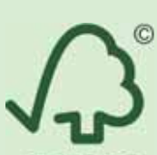
森林管理委員會標章