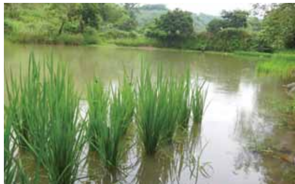
種植田鱉米的農田