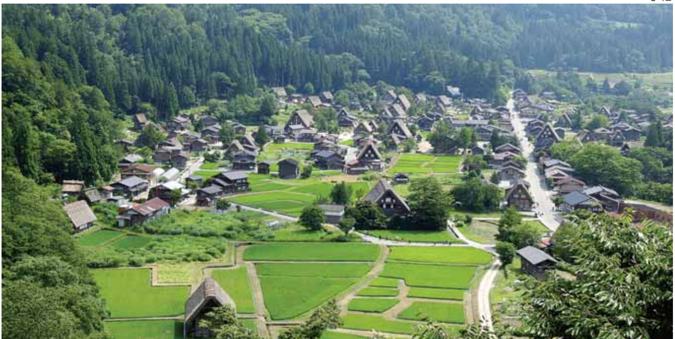
日本合掌村，被自然擁抱的聚落，與環境共生共榮