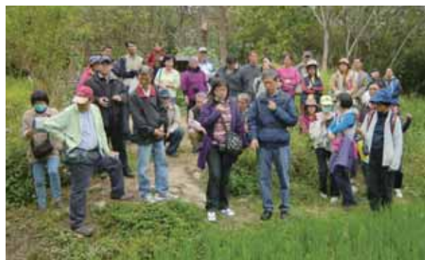
2014年鳥松濕地與泰國KKF合作辦理自然農法培訓課程

2014年，聯合國訂爲「國際家庭農耕年」，希望世界各國能重視小農、協助農民，以遏止日益嚴重的饑餓和貧窮，提供糧食安全進而改善農民生計、有效管理天然資源並保護生態環境，以達到永續發展目標。2014年，世界濕地日的主題爲「濕地與農業成長的伙伴」，根據統計，農業開墾是濕地喪失的最主要原因；爲了與世界接軌，鳥松濕地與泰國KKF(泰國米之神基金會)合作辦理自然農法培