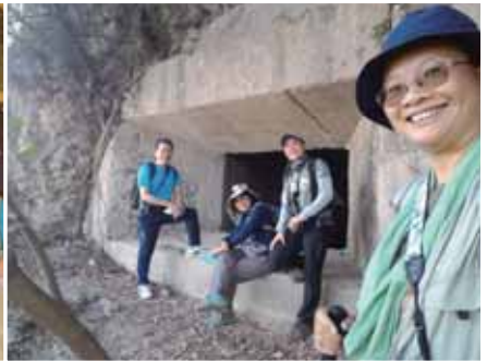
參與新年數鳥嘉年華-左營樣區的調查

重要！對旅行也很感興趣，常約三五好友來個一日或多日的生態之旅，本島、離島跑透透；除了找鳥享受自然美景之外，當地特色美食當然不能錯過；最喜歡找個安靜的角落坐下來發發呆、吹吹風，悠閒的與大自然對話；充實的