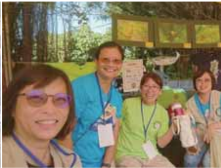
支援鳥會在關渡博覽會的設攤宣導