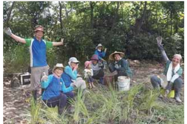
經常協助黃蝶翠谷鳥類觀察解說與鳥松濕地的棲地維護