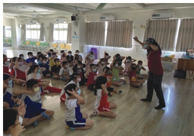
內惟國小保育宣導