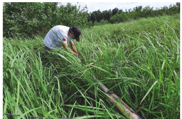
更換猛禽棲架相機電池