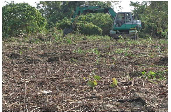
路科認養區外來種植物移除工作