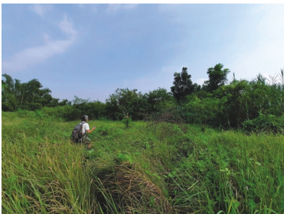
2021年10月燕巢棲地現場