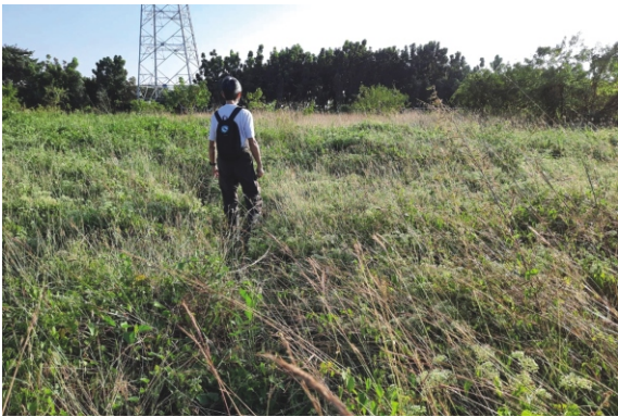
小花蔓澤蘭分布範圍不斷擴張

由於外來種植物入侵的面積太大且還在持續擴散中，以挖土機等大型機具在最短時間內進行大面積挖除，是唯一的方法。所幸南科管理局認可鳥會的方法，協調廠商進行清除多數的外來入侵植物，包含銀合歡、巴西乳膠樹、盒果藤、美洲含羞草、小花蔓澤蘭等，趕在年底前完成，隨後等殘留株冒出新芽，再招募志工以人力拔除。經過這次事件，路科認養區的棲地營造工作只能從零開始，2022年起，我們將胼手胝足地營造棲地，重新還給草鴉一個合適的環境。