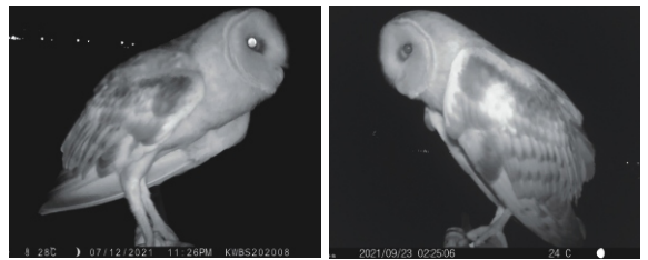
2021年7月、9月路科草鴞棲地認養區拍攝到草鴞影像