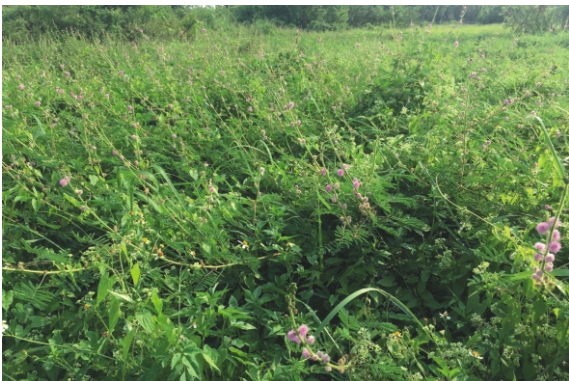
草鴉棲地認養區美洲含羞草入侵