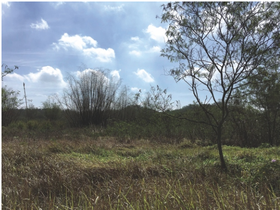
2021年5月燕巢棲地現場