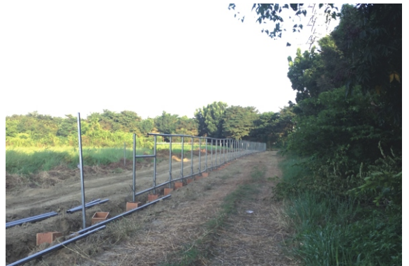
認養區圍籬施作中