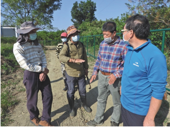
2021年12月與南科管理局現勘外來種植物入侵狀況

由於外來種植物入侵的面積太大且還在持續擴散中，以挖土機等大型機具在最短時間內進行大面積挖除，是唯一的方法。所幸南科管理局認可鳥會的方法，協調廠商進行清除多數的外來入侵植物，包含銀合歡、巴西乳膠樹、盒果藤、美洲含羞草、小花蔓澤蘭等，趕在年底前完成，隨後等殘留株冒出新芽，再招募志工以人力拔除。經過這次事件，路科認養區的棲地營造工作只能從零開始，2022年起，我們將胼手胝足地營造棲地，重新還給草鴉一個合適的環境。