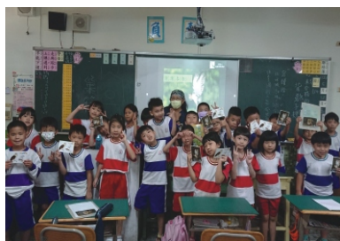
仁美國小保育宣導

教育推廣是草鴉保育工作中很重要的一環，期望2022年能出現新的契機，一掃疫情陰霾，讓保育宣導工作順利進行，使更多人有機會認識瀕絕的草鴉。