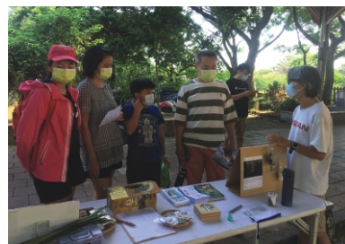
舊鐵橋生態環境教育嘉年華(設攤宣導)