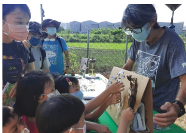
善耕合作社2021童樂會(設攤宣導)