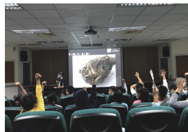
文府國小保育宣導