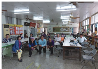
內門溝坪社區保育宣導