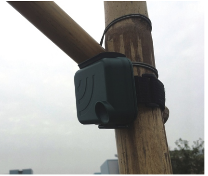
設置自動錄音機進行草鴞調查

但是事情並沒有預期中的順利！時間來到11月上旬，推測草鴞可能會再回到認養區來進行繁殖，調查人員進入上一年(2020)草鴞繁殖的白茅草區，卻發現整個生態環境已改變。原本生長茂盛的白茅草，幾乎完全被外來入侵種植物小花蔓澤蘭、美洲含羞草所取代，只剩下零星族群點綴於其中。這樣的環境，草鴞應無法棲息利用，自動錄音、回播調查證實了草鴞已經離去。