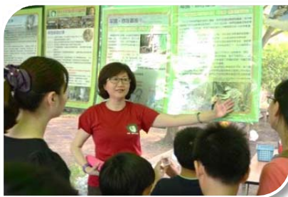
10/20 在鳥松濕地的活動中設攤宣導

本年度在林務局的支持下，將舉辦第二次的草鴉繪畫比賽，分為水彩和平面設計組，詳細比賽辦法將公布在鳥會官網及獎金獵人網站。