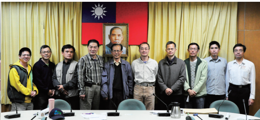
12/27在林務局召開的「第二次草鴉行動平台專家會議」