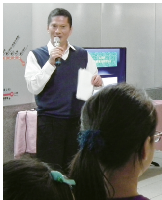
感謝李永得副市長蒞臨作品展開幕茶會