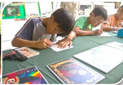
10/27 前往燕巢區面前埔社區的興龍宮廣場舉辦宣導活動及演講