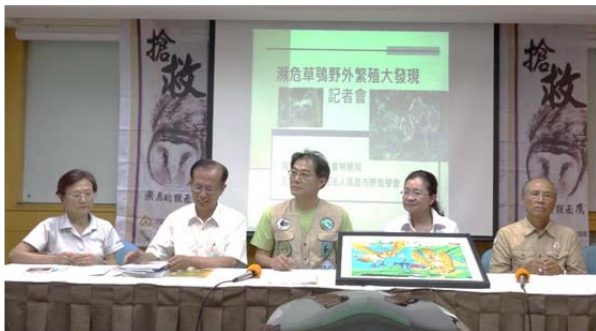
於台北召開的「瀕危草鴉野外繁殖大發現」記者會