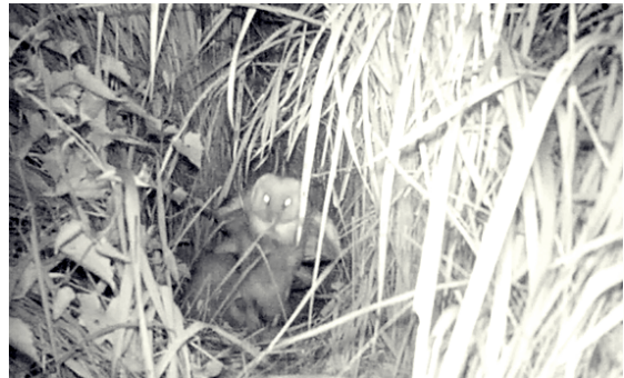
↑ 紅外線相機拍攝到的育雛畫面

今後我們將會持續追蹤監測，在追蹤之餘，也同時記錄該區的生物相，希望能將該區的生物資料蒐集的更完整，並期待日後能有更多草鴉的新消息；在此也呼籲各地的鳥友們如果有任何關於草鴉的訊息，請第一時間通報給鳥會！