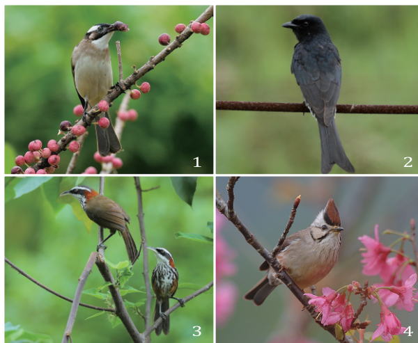
圖1.白頭翁。圖2.大卷尾。圖3.小彎嘴。圖4.冠羽畫眉。

在16個樣區中，茄荳樣區一直以來都是鳥種數及總數量最多的樣區，今年鳥種78種、總數量17,651隻次都是最多的，且超出其他樣區很多。茲將2014-2016年來均有調查記錄之13處樣區，依鳥種數及鳥類總數量消長情形做成圖一及圖二，其中茄荳濕地因為鳥類總數量與其他