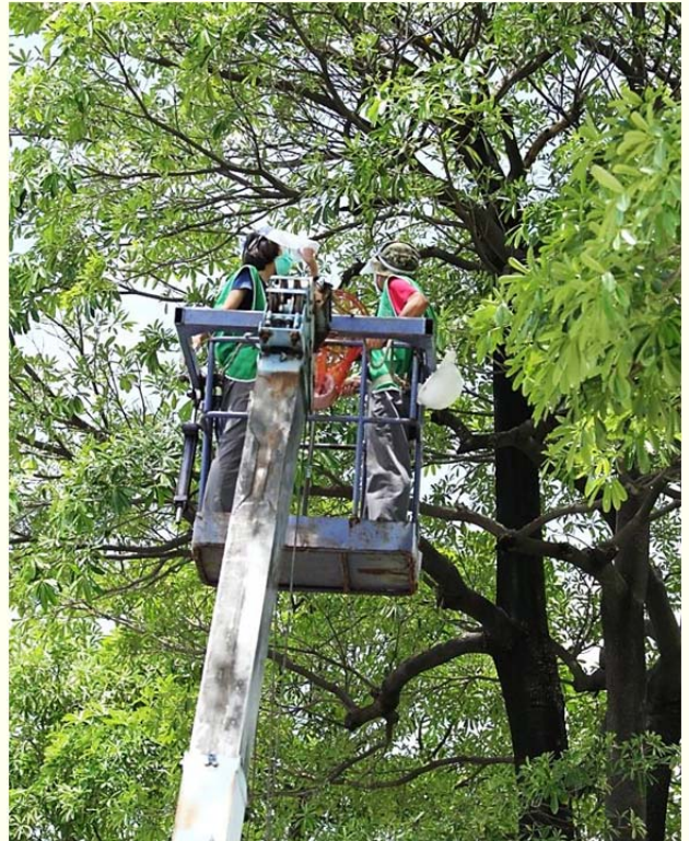
| 今年首次租借吊車進行幼鳥繫放及救援工作

期許未來有更多人關注高雄地區的黃鸝族群,有越來越多人支持高雄鳥會的黃鸝研究、保育工作。