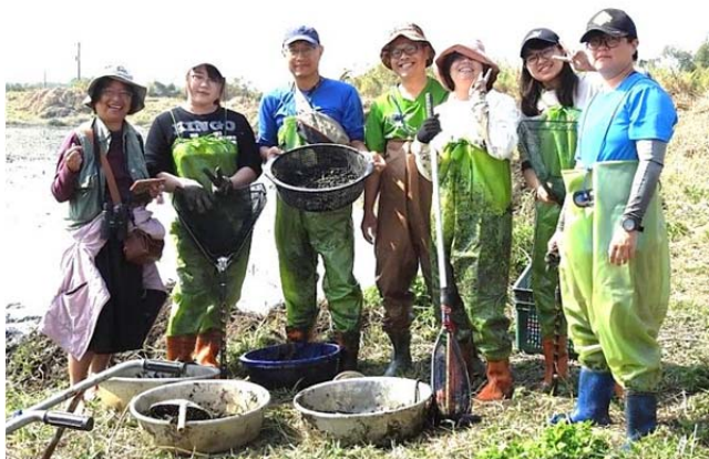
前往官田水雉生態園區採艾實種子