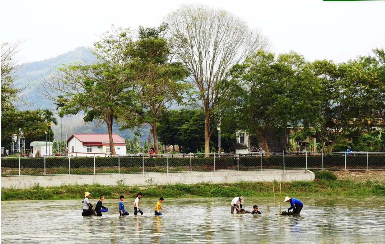
東門國小師生種下希望

美濃湖水雉復育的經驗充分展現了民間力量的可貴與潛力，未來我們希望藉由營造美濃湖水雉棲地的經驗，為水雉族群創造更多的棲地，讓美麗的凌波仙子在台灣各地的淡水埤塘中重現，展現自在優雅的風采。