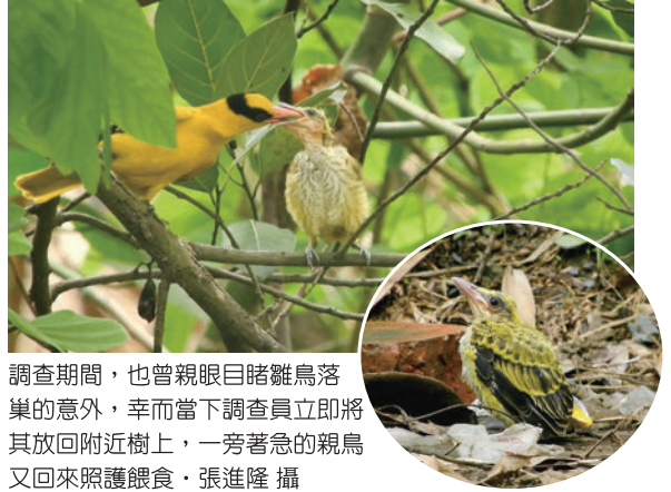
調查期間，也曾親眼目睹雛鳥落巢的意外，幸而當下調查員立即將其放回附近樹上，一旁著急的親鳥又回來照顧餵食。張進隆 攝

鳥類的繁殖主要分為四個階段，築巢期、產蛋期、孵蛋期以及育雛期，由於黃鸝需在10-20公尺以上較為高大茂密的樹林中築巢，因不易觀察巢中繁殖狀況，故無法得知產蛋期和孵蛋期的時間，僅能透過親鳥的行為大概推算出繁殖狀況。黃鸝的繁殖過程從築巢至幼鳥離巢約需一個月的時間，築巢期約為一週，坐巢期間(包含產蛋期和孵蛋期)約為15-20天，而育雛期則約需10-13天。