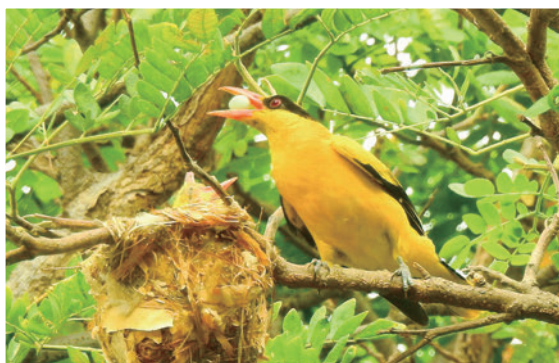
觀察發現，黃鸝會捕食其他鳥類的鳥蛋。