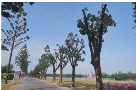
不當的樹木修剪會影響黃鸝的生存與繁殖的成功率