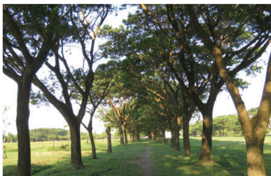
高大的樹種能提供黃鸝築巢、覓食的空間