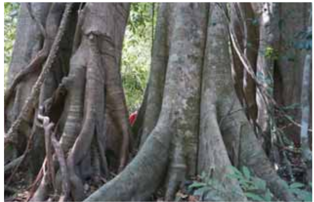
矗向天際的熱帶板根林

物，有暹羅蒲桃 ( Syzygium siamense )、大蒲桃 ( S. grande )、芒楨 ( Schoutenia accrescens ) 及大葉桂 ( Cinnamomum iners )；大葉桂的樹皮與茶葉可替代劣質肉桂，葉子精油具有去味、發汗、利尿、催乳之療效。其它尚有大花紫薇、魚木、交趾黃檀 ( Dalbergia cochinchinensis )、鎮康崖豆藤、狄薇豆、花旗木及熱帶雨林的虎鬚 (箭根薯)，總苞4枚紫黑色，內總苞2枚是蝠翼，小苞片長鬚狀如老虎鬚。