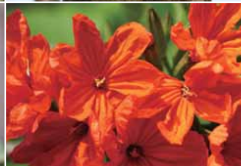
紅花破布木的猩紅花朵如火紅太陽