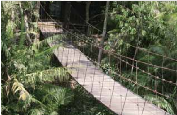
Kong Kaew瀑布步道的環狀路線觀察熱帶雨林植物盤根錯節