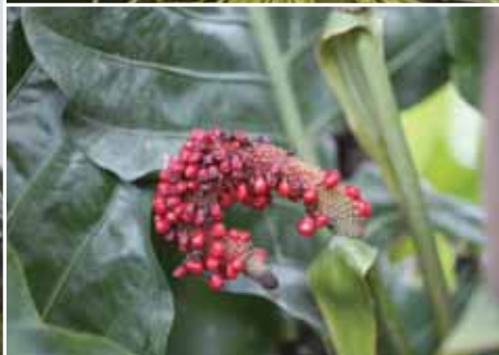
密林叢花燭的漿果呈鮮紅色