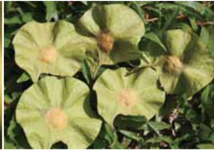
大果紫檀的果實是印度紫檀的3倍