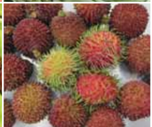
綠色為臭豆，緬甸臭豆為褐色 中間為紅毛丹，外圍為葡萄桑