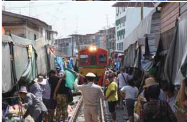
美功鐵道市場每天有火車經過，素有「危險菜市場」之名

綠、黃、紅三色，切丁炸、鮮食加辣、鹽、糖形成特殊味蕾，另五顏六色糯米飯更是吸引觀光客目光，網路上有芒果糯米飯食譜共23種，讓泰國甜點更平民化。2019年泰國旅遊局舉辦「我們在乎您」觀光活動，使用1500公斤糯米、6000顆芒果，獲得金氏世界紀錄。