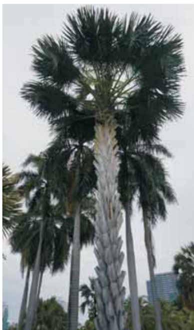
高度已超過15公尺的泰國貝葉棕

不定時在假日由曼谷交響樂團表演傳統音樂，舉目所望超過15公尺高的泰國貝葉棕( Corypha lecomtei )，一株草(單子葉植物)竟然突變成大喬木，探討棕櫚科形成層，幼小期莖細桿，隨著頂芽成長，分生組織細胞集中在頸肩部，與土壤接觸莖部，無法形成緻密年輪，肥厚木材組織。其它有大王椰子、水椰、蒲葵、扇椰子、狐尾椰子、油棕、可可椰子及刺