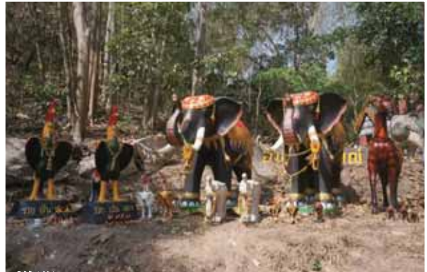
香火鼎盛的山神廟，有不少民衆還願的動物木雕品