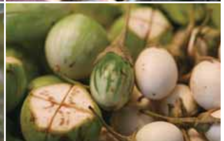
左圖為綠色圓茄、右圖為蛋茄