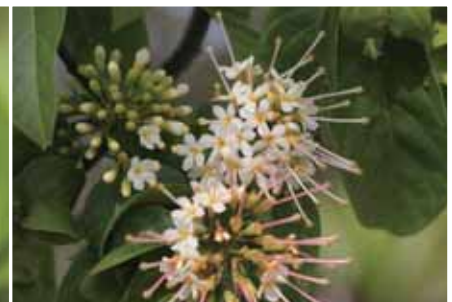
泰梭羅樹的外型與台灣梭羅樹極為相似