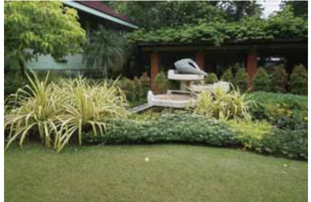
怡圖恰公園是由泰國鐵路局捐獻土地建築而成的公園

臨鐘樓，種植有巴西棕櫚樹 ( Copernicia prunifera )、斐濟櫚、馬尼拉椰子、大王椰子、中東海棗、蒲葵、黃椰子、狐尾椰子、可可椰子、圓葉刺軸欄、細葉棕竹。在八角亭植物區對面廁所，遇見手巧的泰國婦女正編織漂亮香林投花串，香林投是馬來椰漿飯美食的主要香味。隔鄰在福建茶作成垃圾桶，可見東方烏檀 ( Nauclea orientalis )，花型如同黃梁木一團火球，是飛狐、食火鳥最愛的果實，樹皮生物鹼研究具有抗瘡、抗癌作用及黃色染料，木材用於地板、木雕、建屋、獨木舟。其它有印度假黃楊 ( Putranjiva roxburghii ) 屬非洲核果木科，堅硬白色種子可製成念珠項鍊。矮白花羊蹄甲、多花紫薇、大花紫薇、魚木、山鹽娑羅。八角