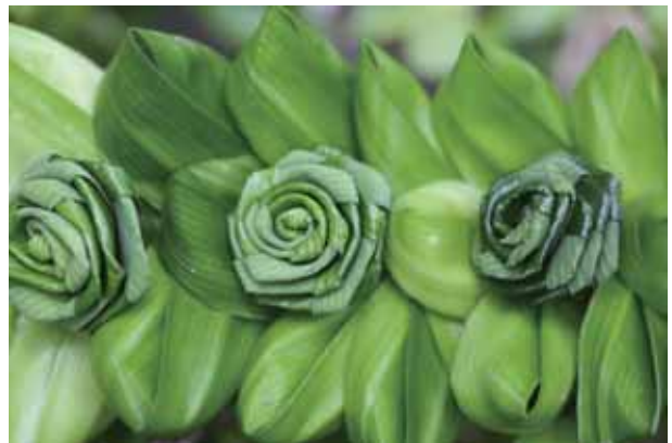
泰國婦女手工編織的香林投花串

亭有玫瑰柿 ( Diospyros rhodocalyx ) 屬盆栽樹、矮香水樹、樹蘭、水梅、文殊蘭、睡蓮、野薑花、灌叢瓜馥木、月橘、玉蘭花、薄葉仙丹花、羅比親王海棗、蝶豆 (藍白色)、聖誕椰子、芹葉福祿桐、蓬萊竹、禾葉林投、茉莉花、馬櫻丹、夾竹桃。續行有兩種紫葳科行道樹，老鴨煙筒花 ( Millingtonia hortensis ) 白色花筒如菸槍；另一種為火燒花 ( Mayodendron igneum ) 橙黃色花冠密生5-13朵，盛開如火焰在樹梢。鎮康崖豆木 ( Millettia brandisiana ) 粉紅色花雞血藤相似白花崖豆木。