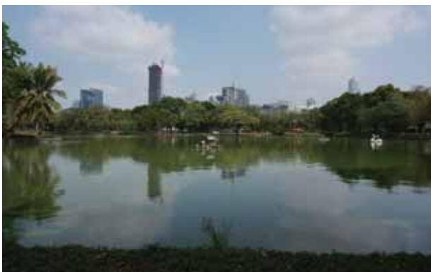
倫披尼公園被譽為曼谷中央公園、都市之肺

拉瑪六世 (1880-1925) 是首位留學英國的泰皇，擔任過陸軍上將，統治現今泰國、寮國、