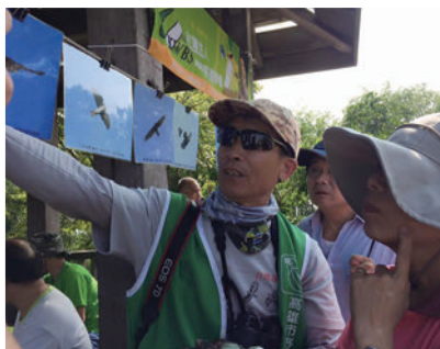
支援半屏山賞鷹解說