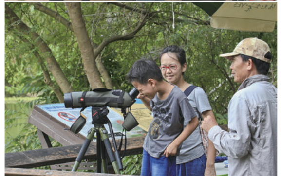
協助鳥會帶隊至馬祖、澎湖賞鳥；每年生態季時都支援鳥類定點觀察