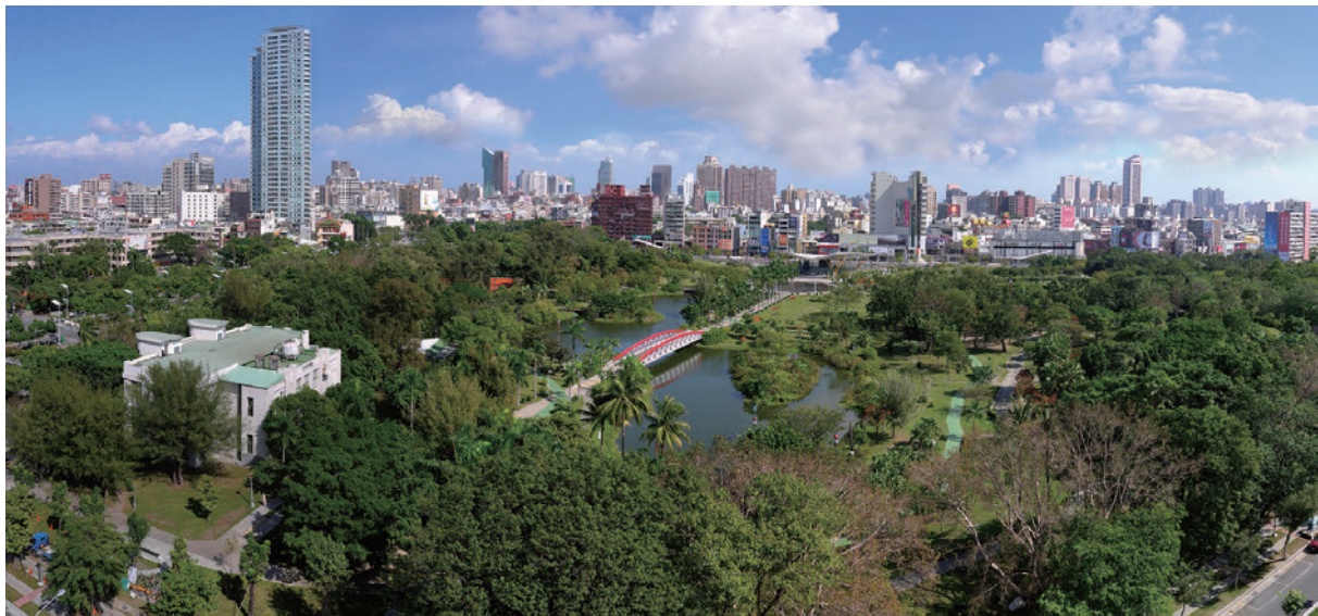
中央公園一片綠意盎然

平常的池面給予故事、給予生命。當一隻看似不起眼的醜小鴨，展開翅膀的美姿及色彩的變化，深深吸引著我，於是有了「一連串醜小鴨」「追追追」的作品呈現；「怒對」是鴨子表情與水花激盪作美麗的結合；「加油」是兩隻黑鴨戲水追逐，旁邊三隻白鴨做加油狀，黑白不