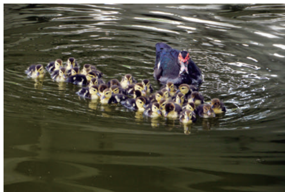
母鴨帶著一群小鴨在水池上悠遊，畫面和諧，姿態優美

直到有一天清晨，春江水暖鴨先知，我發現有一隻母鴨帶著一群小鴨在水池上悠遊，畫面和諧，姿態優美，仔細一數，小鴨竟然有三十隻之多，真是超級鴨媽媽，突然興起把這些醜小鴨、番鴨、綠頭鴨、紅臉鴨、紅冠水雞、鵝...等，作為我攝影的題材，將平時以為稀鬆