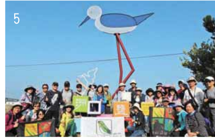
圖說：2. 鳥松濕地復育成果座談會。3. 志工協助賞鴨平台植栽。4. 橋頭地檢署檢察官前來視察。5. 志工聯誼參訪。