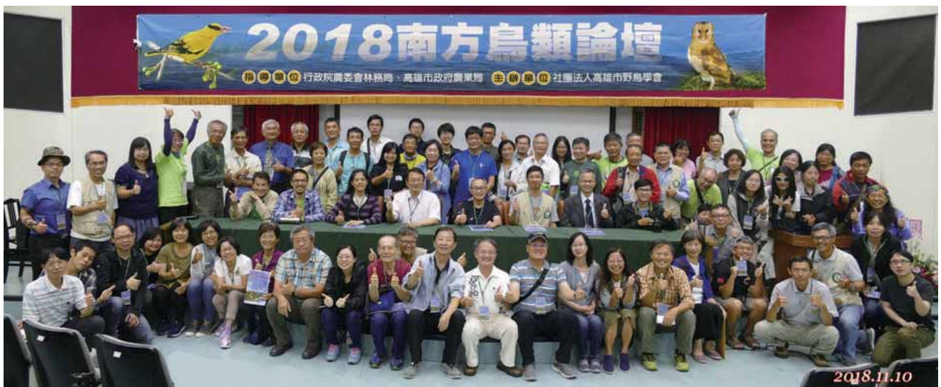
2018南方鳥類論壇圓滿成功