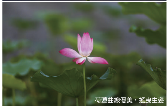
荷蓮曲線優美，搖曳生姿

蓮花效應是由於電子顯微鏡的問世，才被實際觀察出來，目前已逐漸被世人所瞭解，並開始應用。已被應用於建築物外牆塗料、自潔玻璃、馬桶(台灣已商品化)、汽車美容臘...等生態環保產品，可以節約清潔用水。