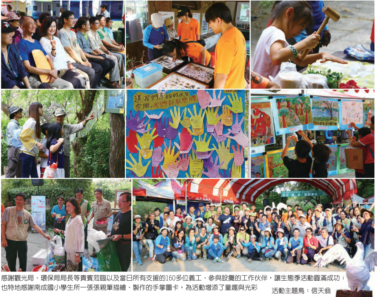
感謝觀光局、環保局局長等貴賓蒞臨以及當日所有支援的160多位義工、參與設攤的工作伙伴，讓生態季活動圓滿成功；也特地感謝南成國小學生所一張張親筆描繪、製作的手掌圖卡，為活動增添了童趣與光彩