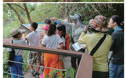
1. 議員至園區勘查。2. 教學池重新整理。3. 張文政檢察長與社服、義工共同參與鳥里山創作。4. 志工培訓。5. 環境小尖兵培訓營。