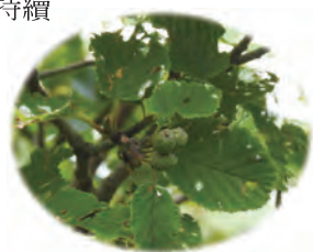
赤楊屬植物，高度不高

上坡；起初路旁還有綠意，也有高過人的赤楊屬植物，之後便是低矮的、類似台灣的高山柳、虎杖、筷子