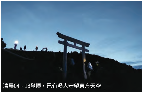
清晨04:18登頂，已有多人守望東方天空