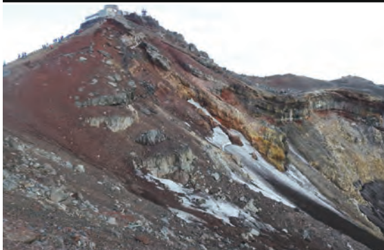
左上方是排隊與劍峰合影的登山客，劍峰是富士山最高點3776公尺

夏季在野地看到雪，將眼睛看得好遠好遠，也不禁駐足拍攝。自富士山歸來，股四頭肌極度疼痛，想跪下拍攝精細的線條是不可能，只能以半蹲的姿態爲草花留影。行走間，眼睛瞄到一灘水，水中有倒影，連忙走位觀察，走入溝渠，身體半伏，以淺淺的一灘水爲鏡，留下立山連峰倒影。餐後，背著住宿裝備移動，夏季花卉爭妍，暗自承諾，停留的三天要好好逛，這山中花園可是夏季限定呢！