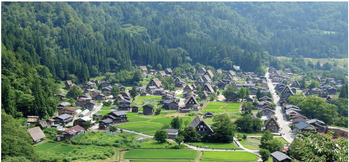
被自然擁抱的聚落，與環境共生共容