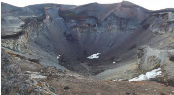
火山口猶有積雪也持續風化中，左上角的細線是環繞火山口動線