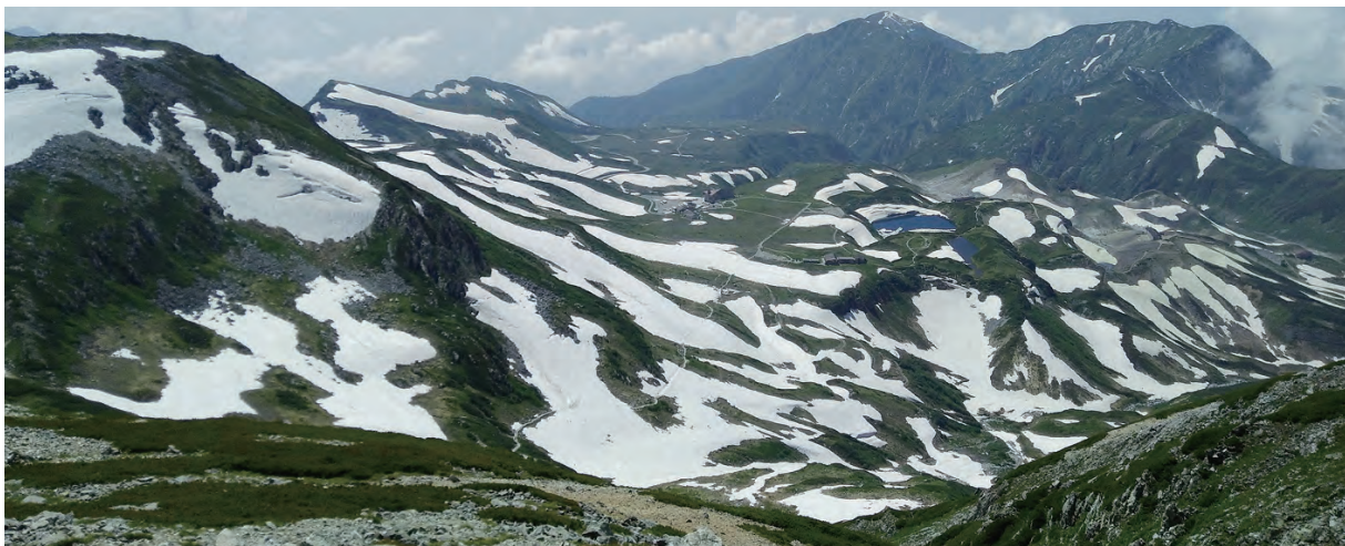
綿延的翠綠山巒起伏，積雪不規則的點綴，有著虎鯨藏匿其間的錯覺

冬為了避敵，會發展出純白的羽色。母鳥在顧盼間，不理會拼命拍牠的人類，自顧自地覓食。有人索性安靜坐著，以手機記錄山中美好的相遇。我帶著微笑下山，一邊思索下一步該如何落腳，在滿是亂石的路徑該如何才不打滑..