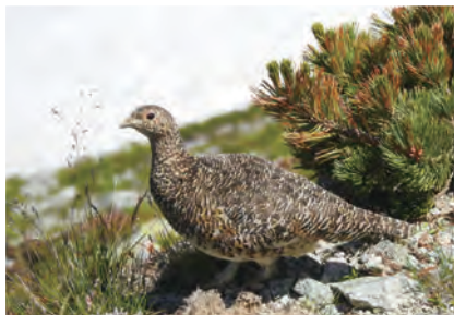
雷鳥的出現引起騷動

隔天一早，往城山展望台走去，想再登高欣賞全村被合抱的感覺，舒適的溫度，怡人的田園風光，簡易純樸的建築群，各自散落田園