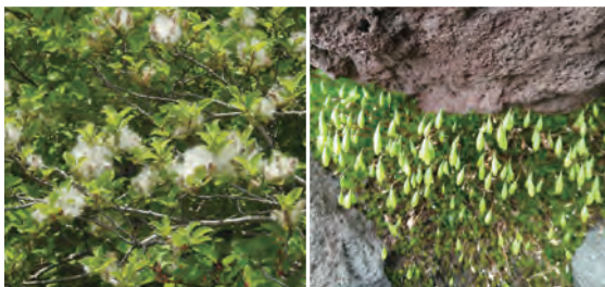
山頂零星出現苔蘚