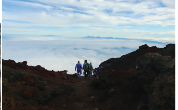
壯闊的雲海在下山之際，遇見

警戒心，官方資料說，室堂一帶約有240隻左右，我們期待看見牠們。自冰河時期存活至今的族群，顯然有著獨特的生存法則，因應環境顏色變化，也身穿不同色彩的羽翼；七月，羽色應該轉為咖啡色調，若出現在雪地之中，非常醒目；若是躲在步道兩側高度約1-2公尺的臥藤松下，將難以發現。我們逐一搜尋觀察牠們隱伏的最佳處所，也將野花細細品味。