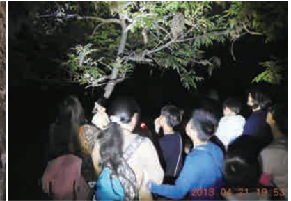
小老闆x大市集活動