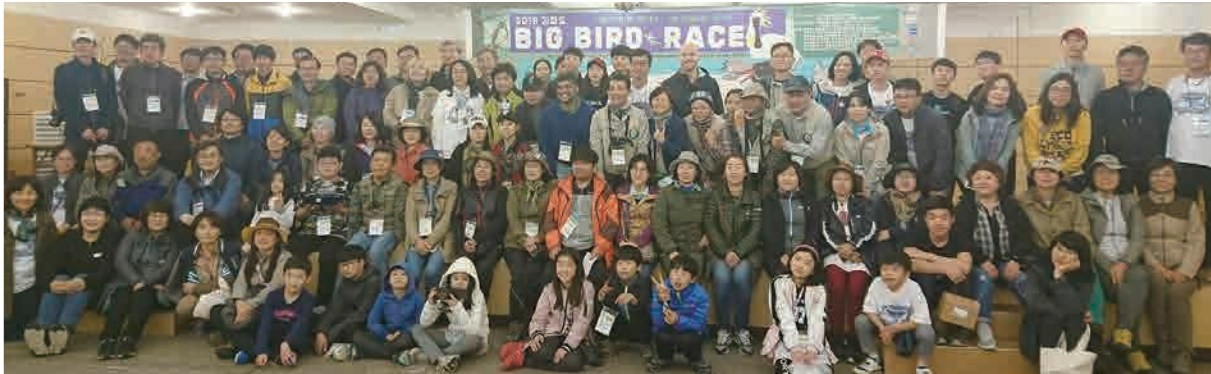
理事長與鳥友應邀參與南韓第二屆江華島國際賞鳥大賽，並於會中介紹台灣的27種特有種鳥類