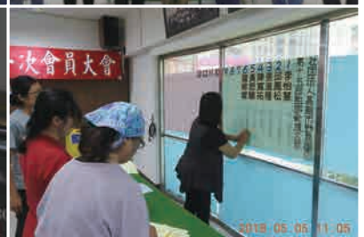
會員大會中表揚感謝義工多年來對鳥會的協助支援；同時進行第十五屆理監事的改選