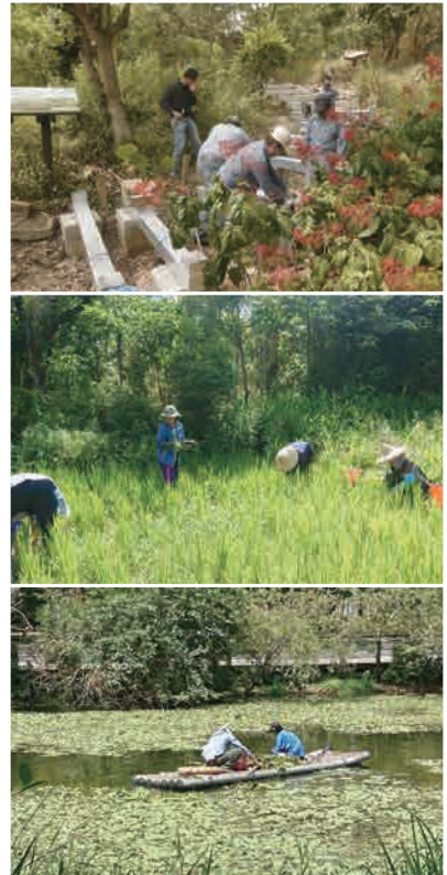
圖1：園區整修工程正陸續進行中