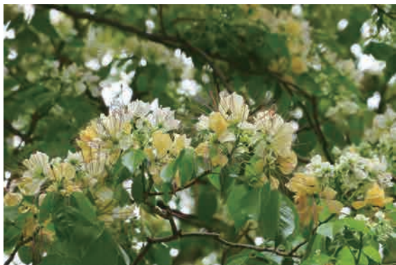
花朵正盛開綻放的加羅林魚木花樹

後來從陳姓好友得知住家附近這棵魚木是「臺灣魚木」，也就是屬臺灣原生的特有亞種，也知道臺灣有兩種魚木，一是原生的臺灣魚木，另一是外來的魚木(即加羅林魚木)。這