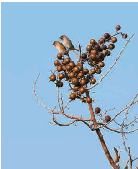
短暫停棲於枝頭的斑文鳥

我並不急著趕路，於是坐在步道旁的石椅上等待，調整相機準備捕捉影像。我對斑文鳥並不陌生，牠們和麻雀一樣非常普遍處處可見，所以並不引起野外觀鳥者的青睞。其實我