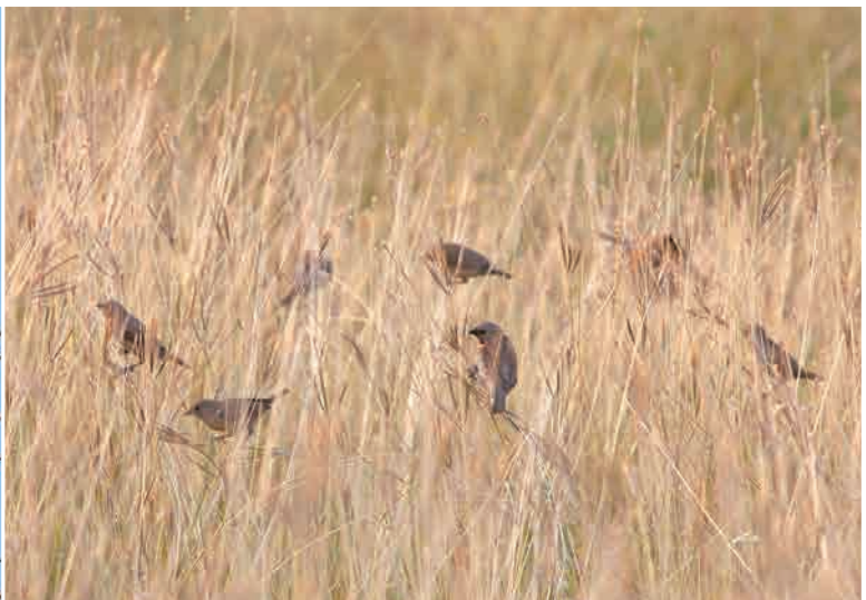
一群斑文鳥隨風晃蕩、輕啼