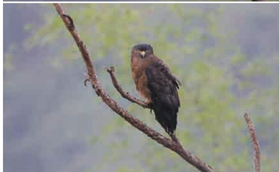
停棲在樹枝上的大冠鷲