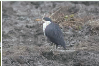
白頸黑鷺