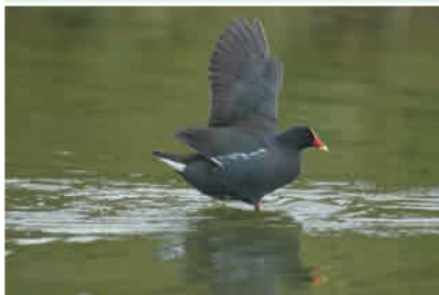
紅冠水雞