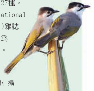
鳥頭翁 · 柯木村 攝