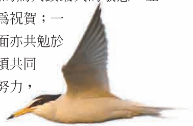
小燕鷗，是台灣鳥類史的第一筆紀錄

很高興優先拜讀世祥兄，在生態保育方面寫了多位恩人對台灣保育的啟蒙與貢獻，他們將生態保育視為一生志業，積極行動，他們是台灣最可貴的友人，也是台灣的恩人，實在感觸良深，特別向早期的鳥人致最大的敬意，並樂於為本書寫序，以為祝賀；一方面感念恩人，另一方面亦共勉於生態保育方面工作仍須共同奮進，不忘前人奉獻努力，使台灣漸入佳境。