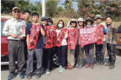
感謝鳥友協助新年數鳥嘉年華活動

* 新年數鳥嘉年華自12/16-1/07同步進行，高雄今年一樣有16個調查樣區，包括：永安濕地、扇平、茂林、黃蝶翠谷、左營、旗鼓鹽、衛武營、鳥松、舊鐵橋、鳳山水庫、南星鳳山、林園、二集團、中寮山、援中港、東沙島等，感謝各鳥老大與鳥鄉民的協助。