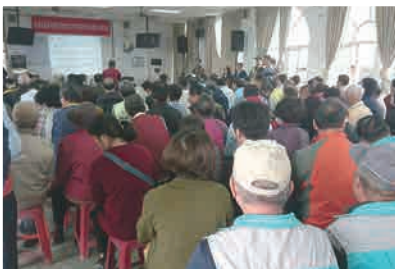
「興達電廠燃氣機組更新改建計畫」說明會