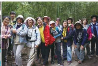
奮瑞古道生態之旅