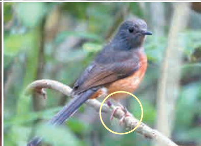
105-106年間，利用色環和足旗組合，已成功在壽山繫放了148隻白腰鵲鵙