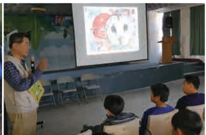
溪洲國小草鴉保育宣導