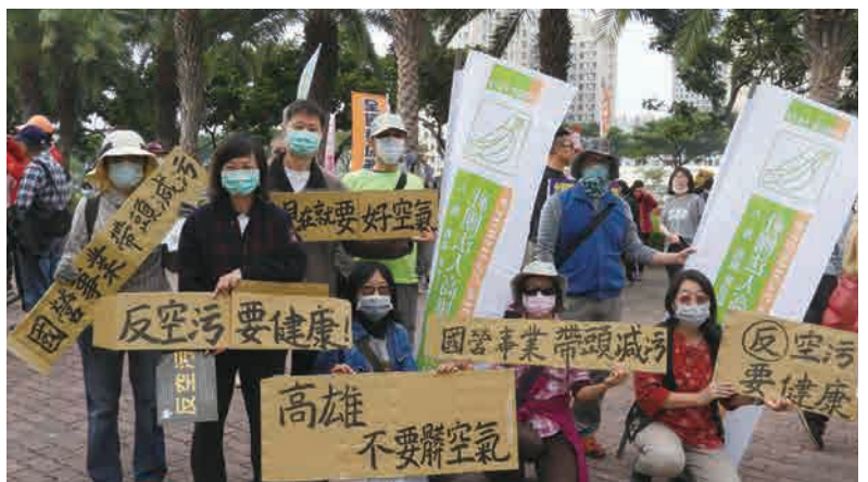
12/17參加反空污大遊行