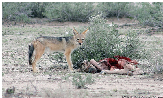
自然界中，殘酷的生與死

“The Hunt”影片總共有七個單元，The Hunt：The Hardest Challenge述說著，大自然界中，獵食者與獵物之間的競爭是最引人注目的，對這兩者都是攸關生死的存在，而往往失敗的都是「獵食者」。“The Hunt：The Hardest Challenge最艱難的挑戰”揭示了獵食者用來捕食獵物的技術及其運用的策略，雖然不能每次必中，但那智慧、那謹慎、那精準、那快捷、那合作、那真實，都讓我對這群獵食者致上無限敬意，卻也有些許感概，明明面前一堆食物(食