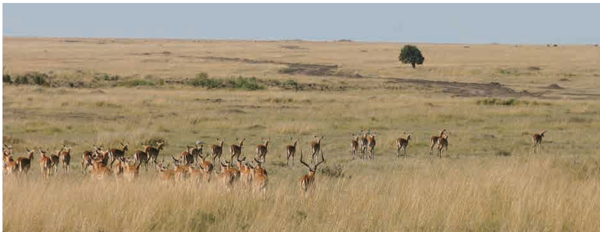
非洲大草原上，獵食動物與獵物間的生死搏鬥，幾乎每天都在上演

草原上，花豹蹣手蹣腳的潛近到草食性動物約四公尺處才進行獵捕，如此般的隱匿高手，卻也是七次攻擊只有一次成功，是的，當下我們都會同情弱者草食性動物，但是，當母花豹需捕食來養育幼豹時，真的很為花豹的存續擔心！