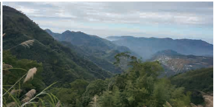
眺望四大天王山與大尖山稜線