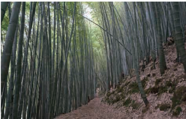
忘憂林有整片孟宗竹林，彷彿置身電影臥虎藏龍場景

1公里椿海拔1259公尺(217929,26004241)，等於奮瑞古道6.5公里椿，右前方眺望瑞里全景，學校、飯店羅列在山林。出現烏皮茶( Pyrenaria shinkoensis )，葉搓揉有淡淡杏仁味，是北部山系普遍種，與武威山烏皮茶相比較，葉無杏仁味，樹幹具縱列條紋。另有卡氏櫛、狗骨仔、樟葉楓、黃杞、山紅柿、紅楠、鵝掌柴、阿里山灰木、杉木胸寬215公分、琉球與圓葉雞屎樹、角花烏斂莓、苗栗崖爬藤。1.5公里椿忘憂林，屬整片孟宗竹林，雲來時，虛無縹緲，想像一下置身電影臥虎藏龍場景。觀察石頭上附著植物有布勒德藤、全緣卷柏、台灣肺形草、腎蕨、小毛蕨、冷清草、巒大秋海棠，和葉有白斑的台灣秋海棠( Begonia taiwaniana )是優勢種，可任意雜交成鍾氏秋海棠、台北秋海棠與武威秋海棠。左邊解說牌清水溪流流域縱切3個高地有幼葉林、九芎坪、科仔林，孕育山谷