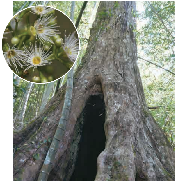
台灣赤楠胸寬444公分

奮瑞古道5公里椿海拔1466公尺(218286,2603416)，後方2株巨木是胸寬244與330公分的假長葉楠。另有孟宗竹、巒大秋海棠、亨利氏鐵線蓮、冷青草、石朴、三奈、牛奶榕、華八仙、米碎柃木、小梗木薑子、串鼻龍、虎婆刺。4.6公里椿海拔1518公尺(218349,2603258)有兩椅休憩處，菲律賓楠胸寬264公分，伴隨無脈木犀、山香圓、小花鼠刺、孟宗竹。台灣赤楠老樹海拔1535公尺(218419,2603234)，胸寬445公分，樹幹被鋸成長103公分、寬44公分空洞，嫩芽鮮紅、樹型優雅，生長緩慢，是最佳園景樹。小枝纖細纏綁與十子木同稱Karusu(排灣語)番仔掃帚。大葉楠解說牌在4.5公里處有座木棧道，發現與樟葉楓長在一起的著生珊瑚樹( Viburnum odoratissimum var. conspersum )，胸寬61公分，果端漸尖不同於橢圓形的珊瑚樹。叉路口續接產業道路，擇左纜繩絞盤處往雲戴山，直走往奮起湖。