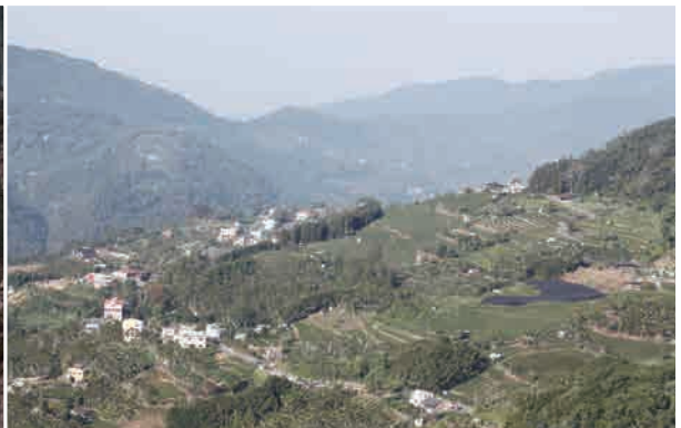
眺望瑞理全景，學校、飯店羅列在山林