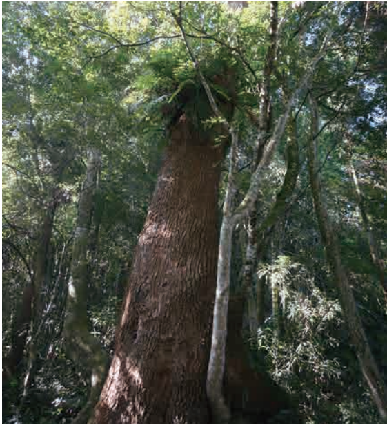
牛樟巨木胸寬460公分

間的烏龍茶產地。而一旁菲律賓楠大喬木是製造牛車輦板的最佳材質。牛樟巨木海拔1270公尺(218249,2603972)，胸寬460公分，當初沒有被侵略者帶走，憑古弔今不勝感慨！瑞里居民刨取牛樟煉油可申請不必至南洋當軍伕。伴生植物有火燒栲、黃藤、玉葉金花、黃杞、奧氏虎皮楠、粗毛柃木、金粟蘭、紅楠、山龍眼、長葉木薑子、台灣楊桐、黑星櫻，偶見鬼櫟。向前走是七步回音亭，亭上落葉層是烏來麻、腎蕨、台灣山蘇、姑婆芋、長果藤、柃樹藤等良好棲息地。往奮瑞古道叉路口海拔1302公尺(218246,2603865)，直走至瑞太古道。