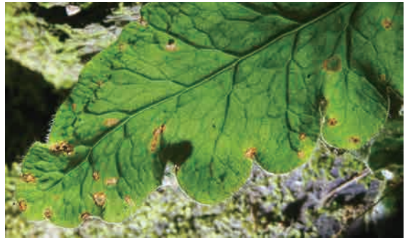
地耳蕨的網脈，網眼內無游離小脈

在海拔750公尺的此處發現，借光，拍到牠的葉片網脈，如書上描述，網眼中沒有游離小脈，也可見到葉片上的長絨毛，真是感恩的經驗。