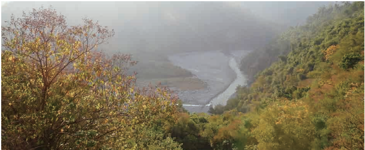
茂林是個好地方，好山好水，卻因莫拉克風災之後遭到很大創傷，昔日景點很多都被淹沒