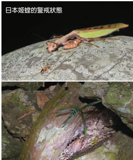
日本姬螳的警戒狀態

那夜，我們以蝸牛的速度前進，體會黑夜的寧靜與豐富，暗夜中，肯氏南洋杉的幼苗悄悄成長，山羌也驚慌回眸，留下一抹白尾印記延長視覺印象。睡前，思及日本姬螳，前足收到胸部腹下，保持警戒狀態的牠，一如功夫熊貓中師傅的神態，不禁莞爾入眠。