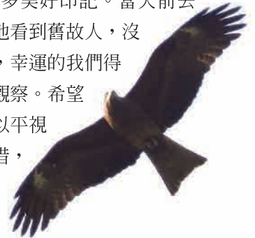
黑鳶幾度自頭頂盤旋劃過，連類單都抓得住

茂林是個好地方，好山好水，卻因莫拉克風災之後遭到很大創傷，昔日景點很多都被淹沒，路徑也不似以往順暢，雖曾小小冒險鑽過小路，現在也只是在樣區觀察，鮮再進入多納林道。在提倡生態旅遊的同時，也與青年創業的朋友有所交流，屢屢拜訪德恩谷，在生態豐富之所，品味原民風味餐、辦理營隊、夜間觀察，拜訪數回，留下諸多美好印記。當天前去只有小狗相迎，喜孜孜地看到舊故人，沒有狂吠，只有親近搖尾，幸運的我們得以進入園區用餐，繼續觀察。希望能如去年一般的好運，以平視角觀察五色鳥進食…可惜，當日園區鳥況不佳，倒是蟲況不錯。