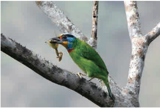
平視角看五色鳥大啖螳螂