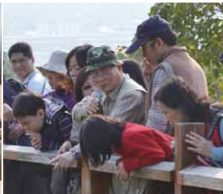
協助中都濕地植物觀察解說