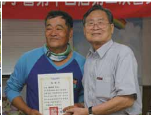
每年一定出席會員大會頒獎給當年度的優良義工