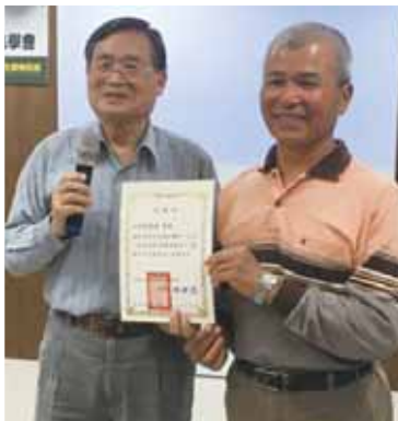
魏老經常推薦蕨類專家來與鳥友分享

魏老說，本來在學校裡學的是輪機，畢業後曾經有三年在輪船上的航海歷練，下船後在民營公司任職，後來考上「美國驗船協會」驗船師的資格，從事驗船工作數十年；他說驗船