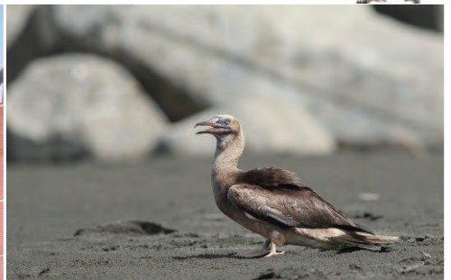
重新感受海風的氣息